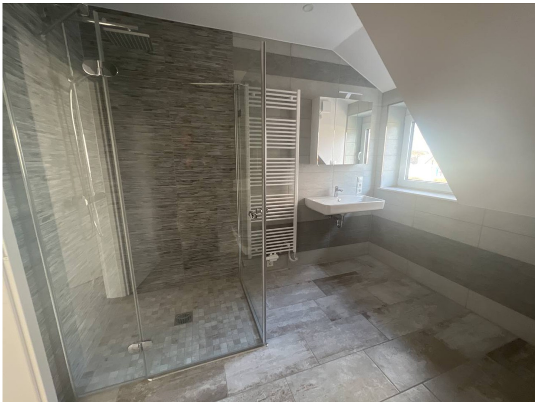
sehr schönes Bad