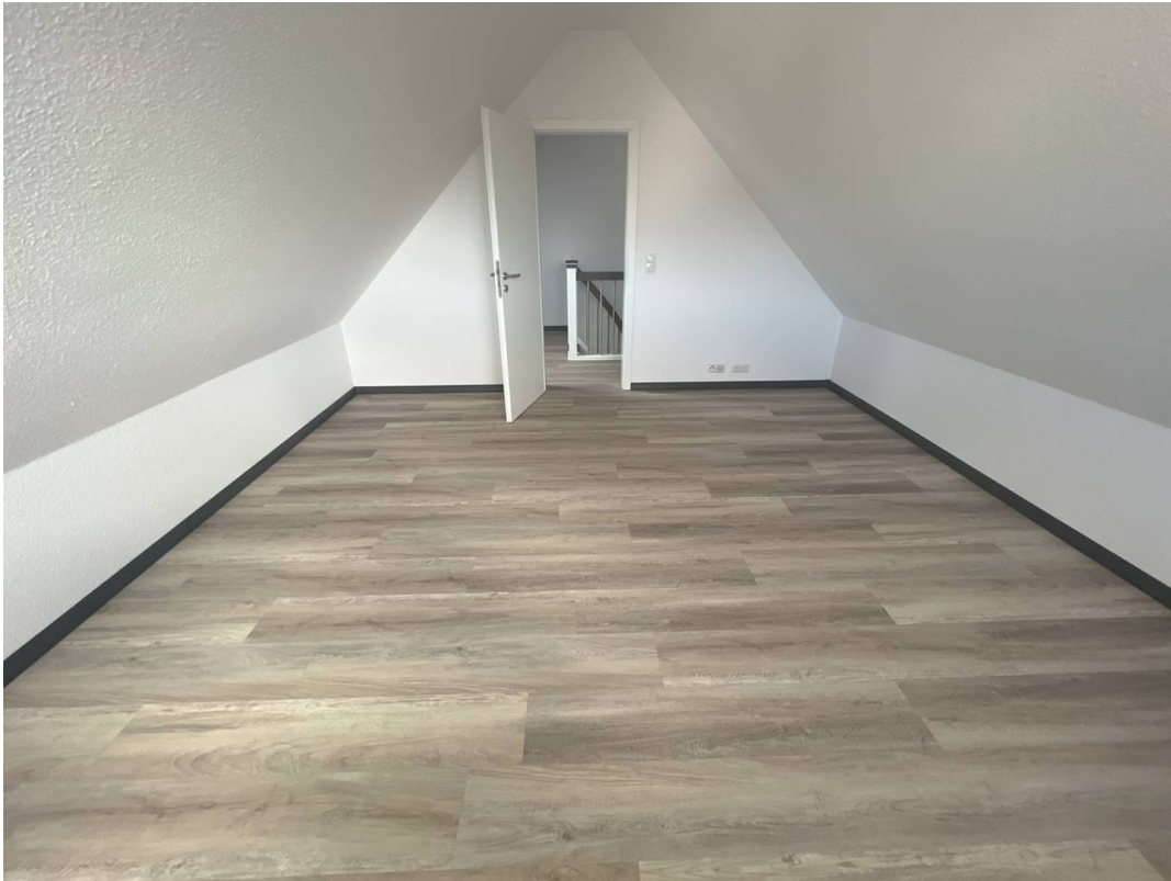
Zimmer 3 - Dachgeschoß