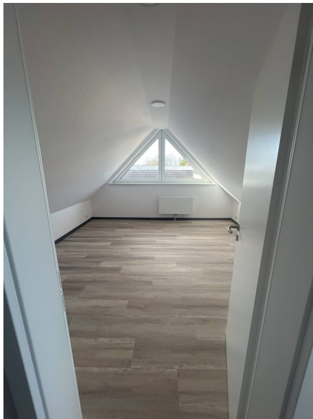
Zimmer 3 - Dachgeschoß