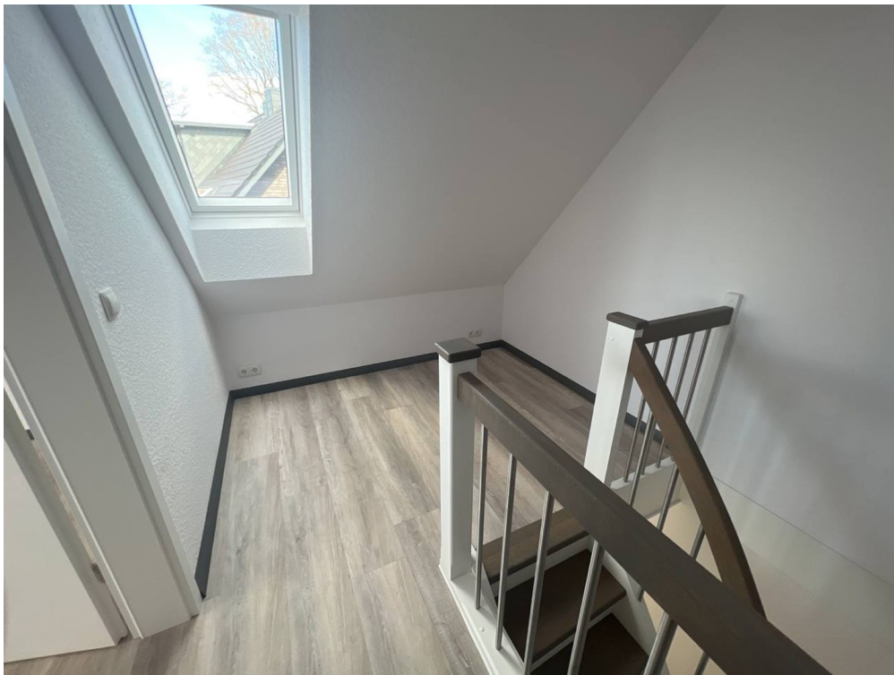
Treppe zum DG