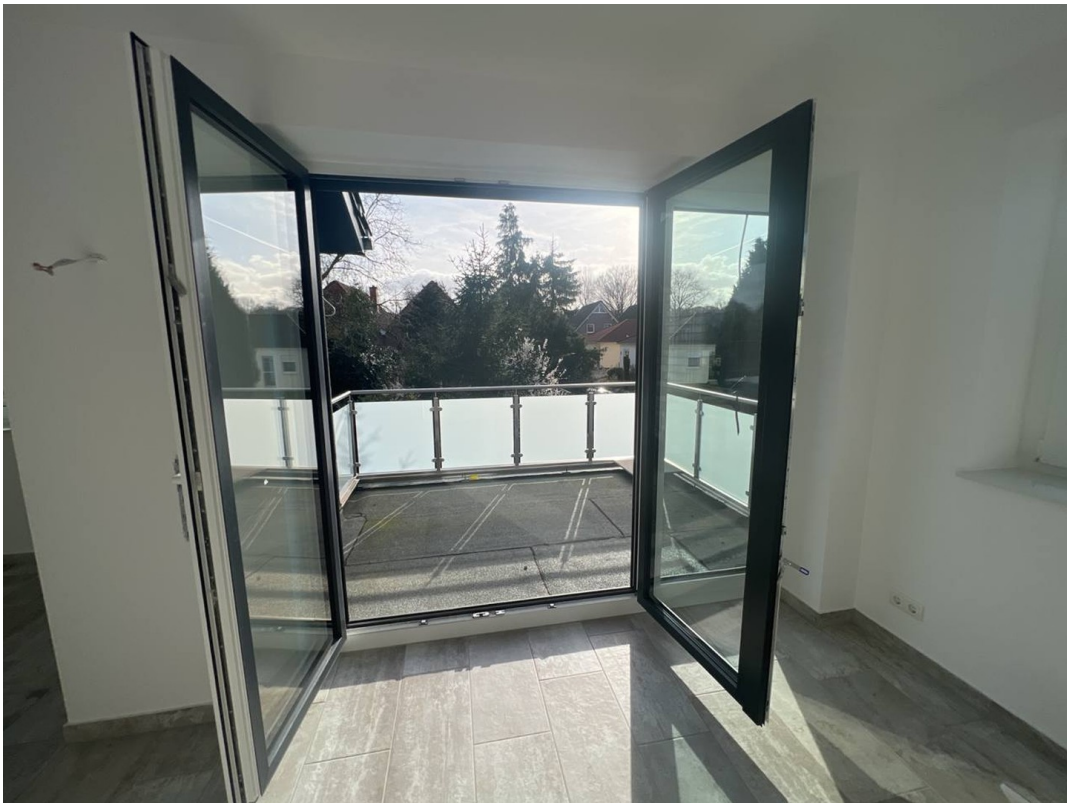
Blick auf Balkon