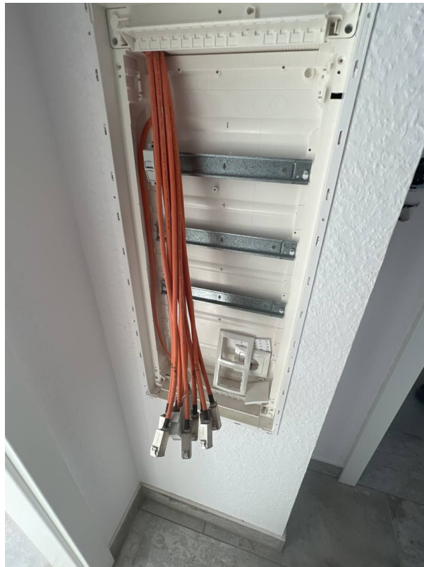
Netzwerk - inzwischen fertig