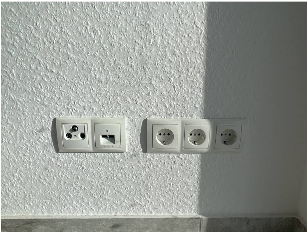
in jedem Zimmer Netzwerk