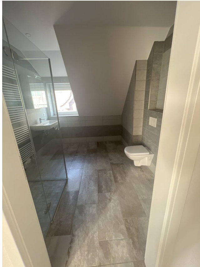
sehr schönes Bad