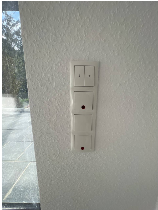
überall elektrische Jalousien