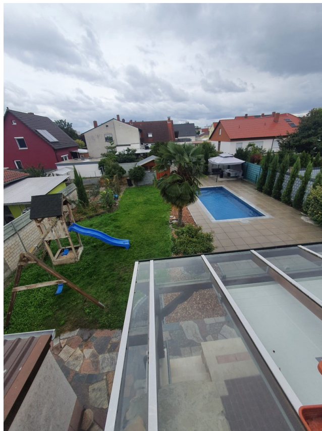
Blick auf Garten