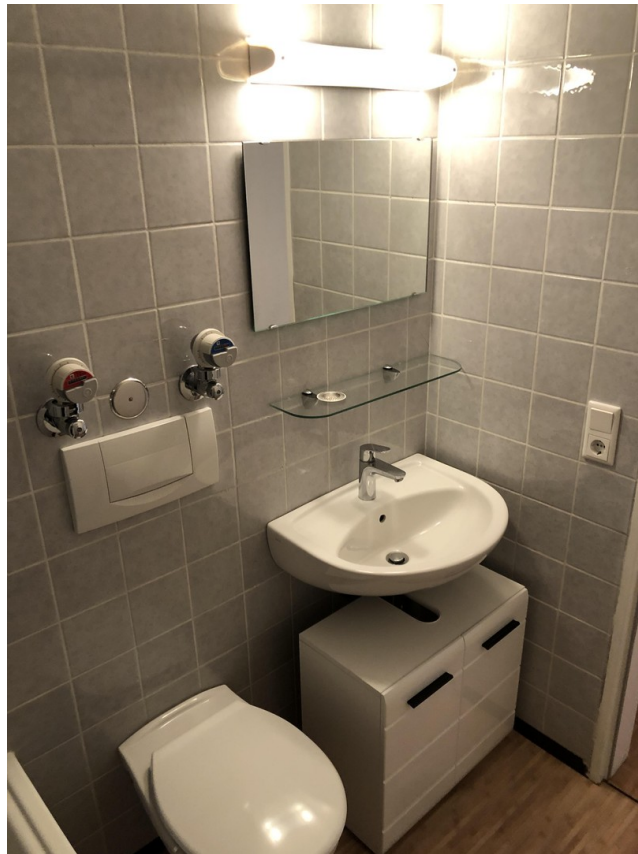
Bad - Bild 2