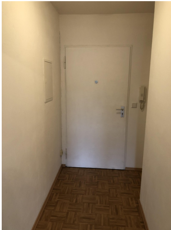
Flur - Bild 1