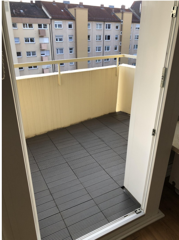
Balkon WPC-Boden - Bild 4