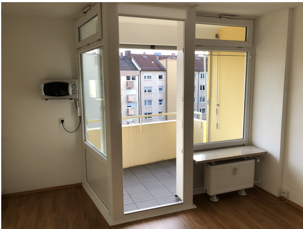
Balkon - Bild 1