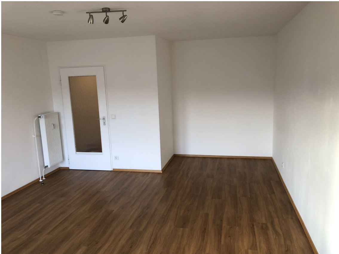
Wohnraum - Bild 2