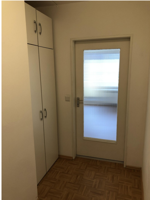
Flur - Bild 2