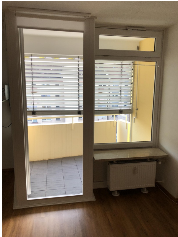
Balkon Jalousie - Bild 3