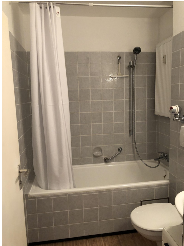
Bad - Bild 1