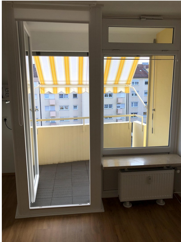
Balkon Markise - Bild 2