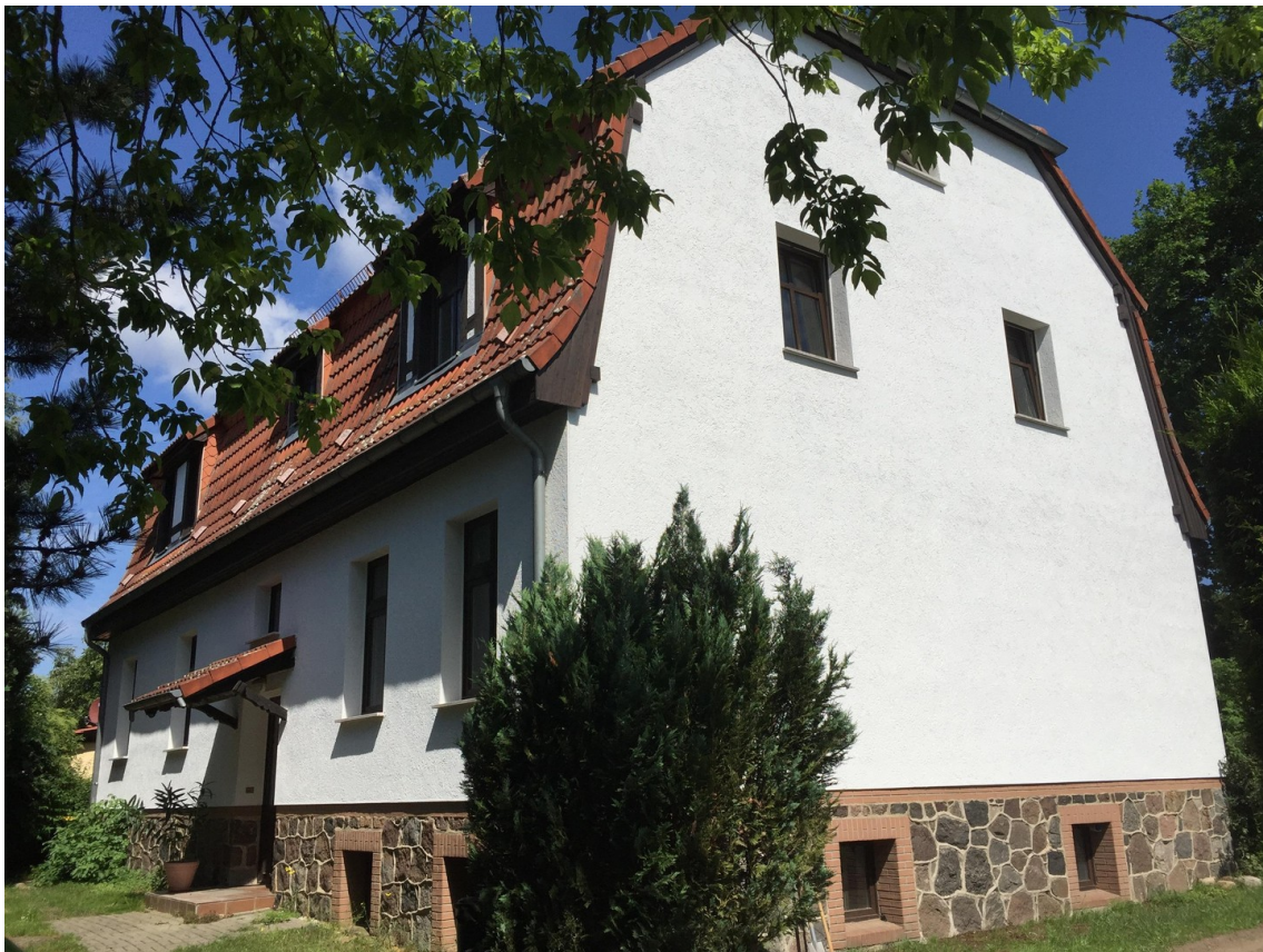
Hausgiebel sowie -rückseite