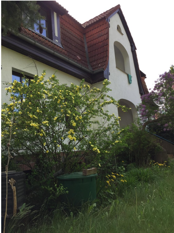
Hausdetail im Frühling