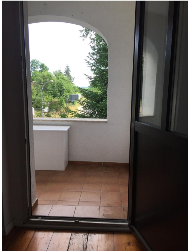
OG, vom Flur zur Loggia