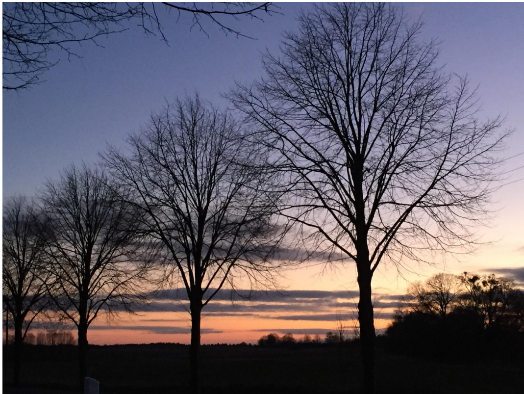
Abendhimmel im Vorfrühling