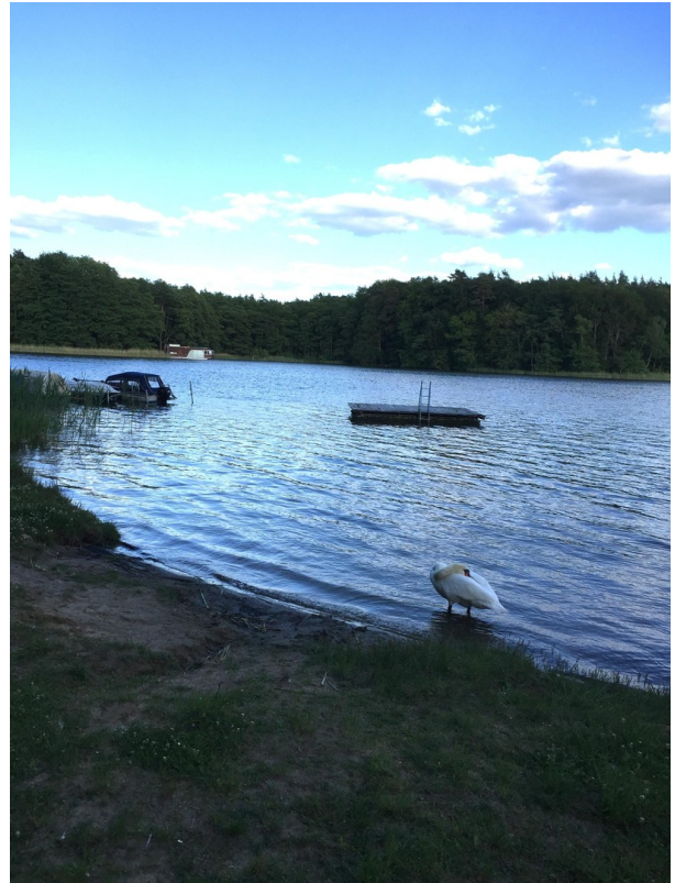
See in naher Umgebung