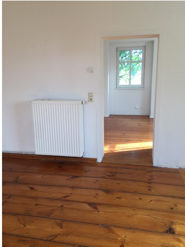
OG, vom Zi. 3 zum Zi. 2