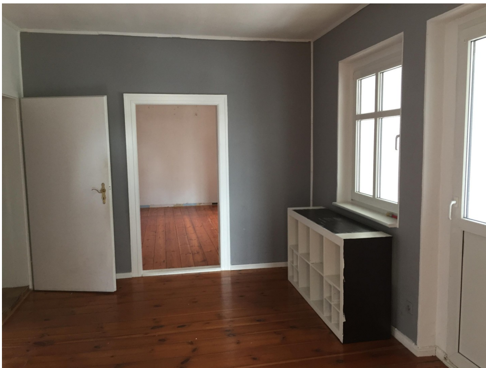
OG, vom Flur zum Zi. 1