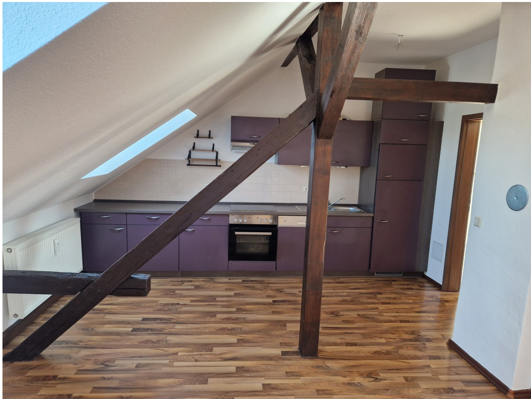
Küche im Zimmer 2