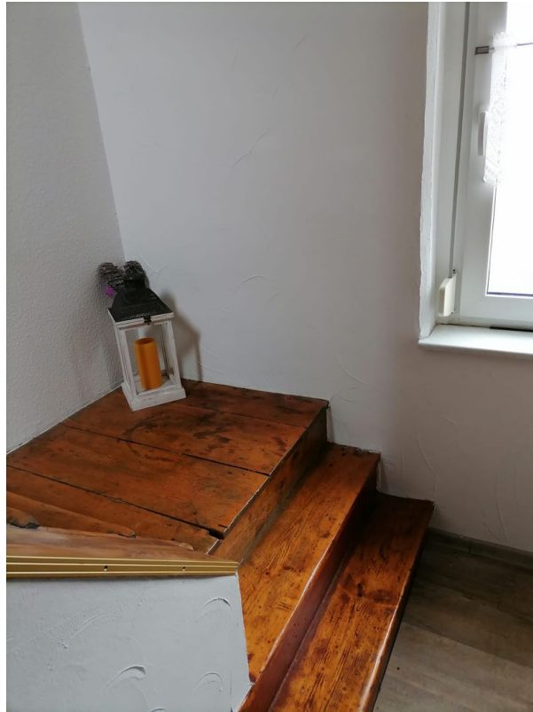
Treppe vom Eingang in den Wohn