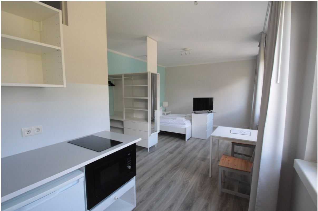
Wohnraum mit Küche, Beispiel