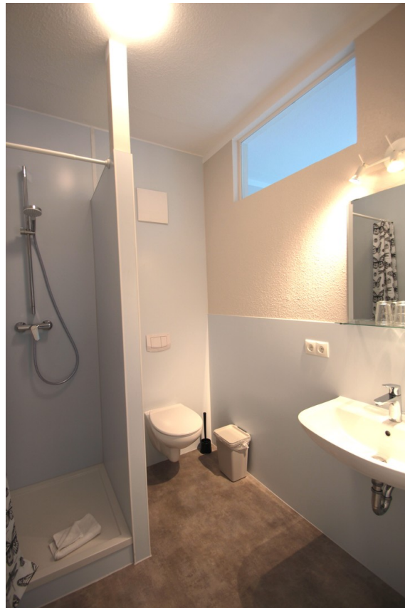
Duschbad mit WC