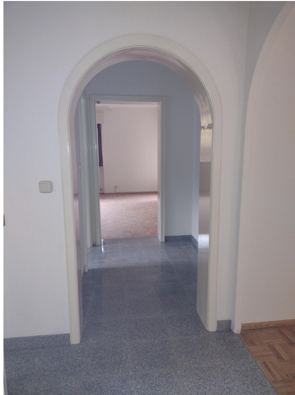
Diele / Gardarobe