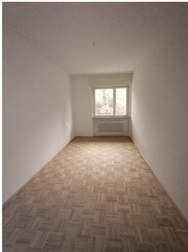
Kinder- bzw. Arbeitszimmer