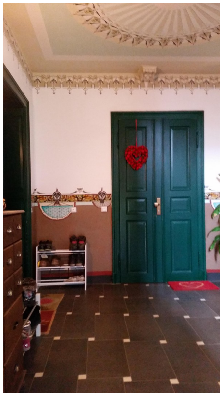
Hausflur Eingang WE