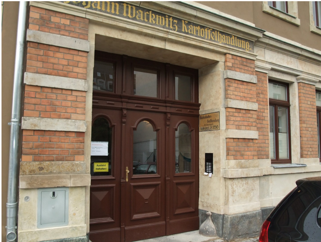
Hauseingang Menageriestr. 4