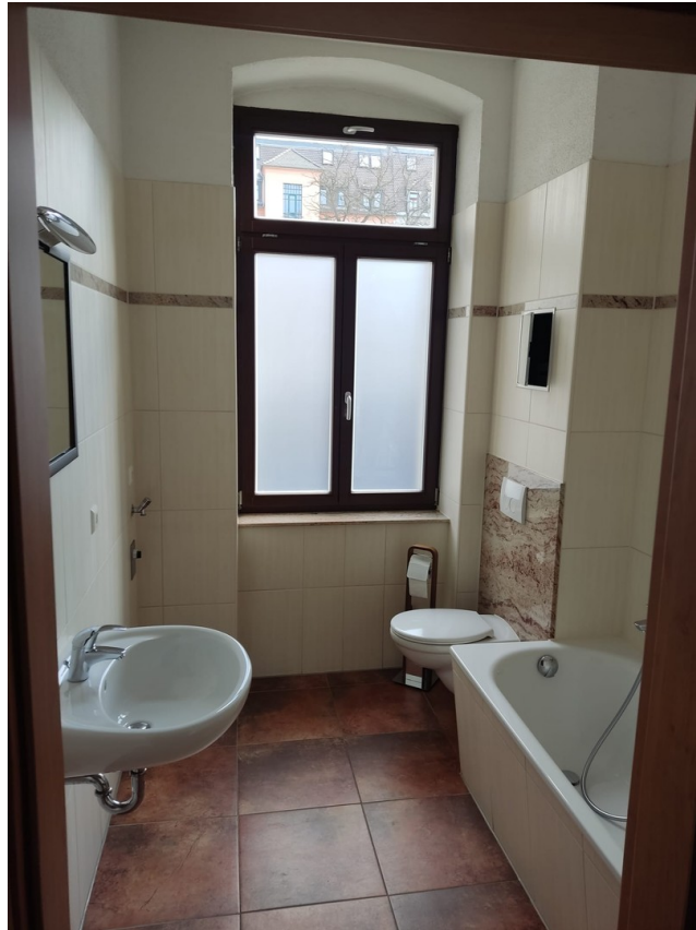
Blick ins Badezimmer