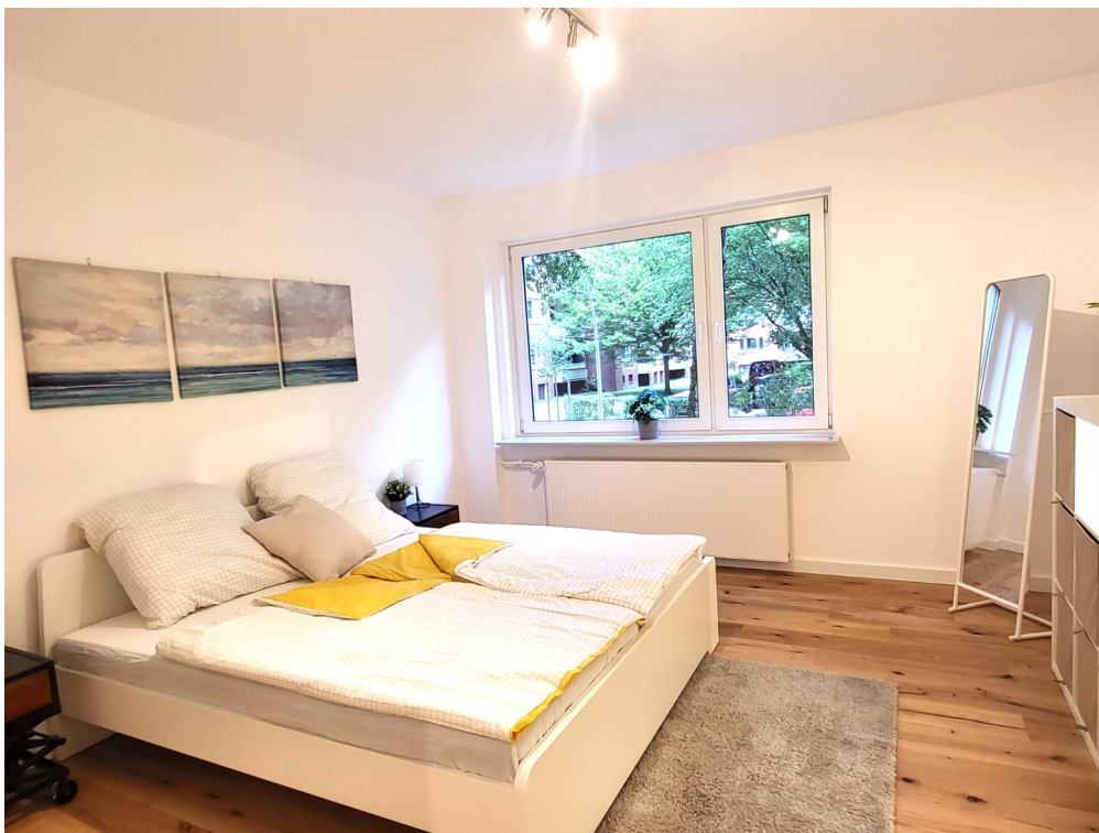
Schlafzimmer Ansicht 1