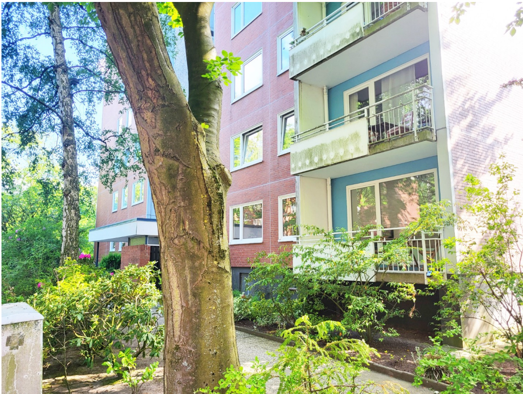
Wohnung rechts Hochparterre