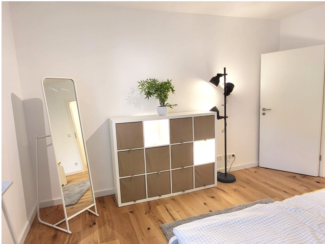
Schlafzimmer Ansicht 2