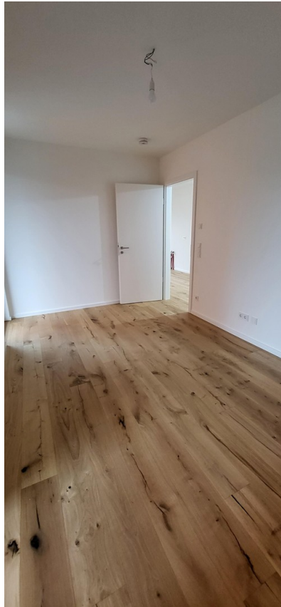
Blick ins Kinder/Arbeitszimmer