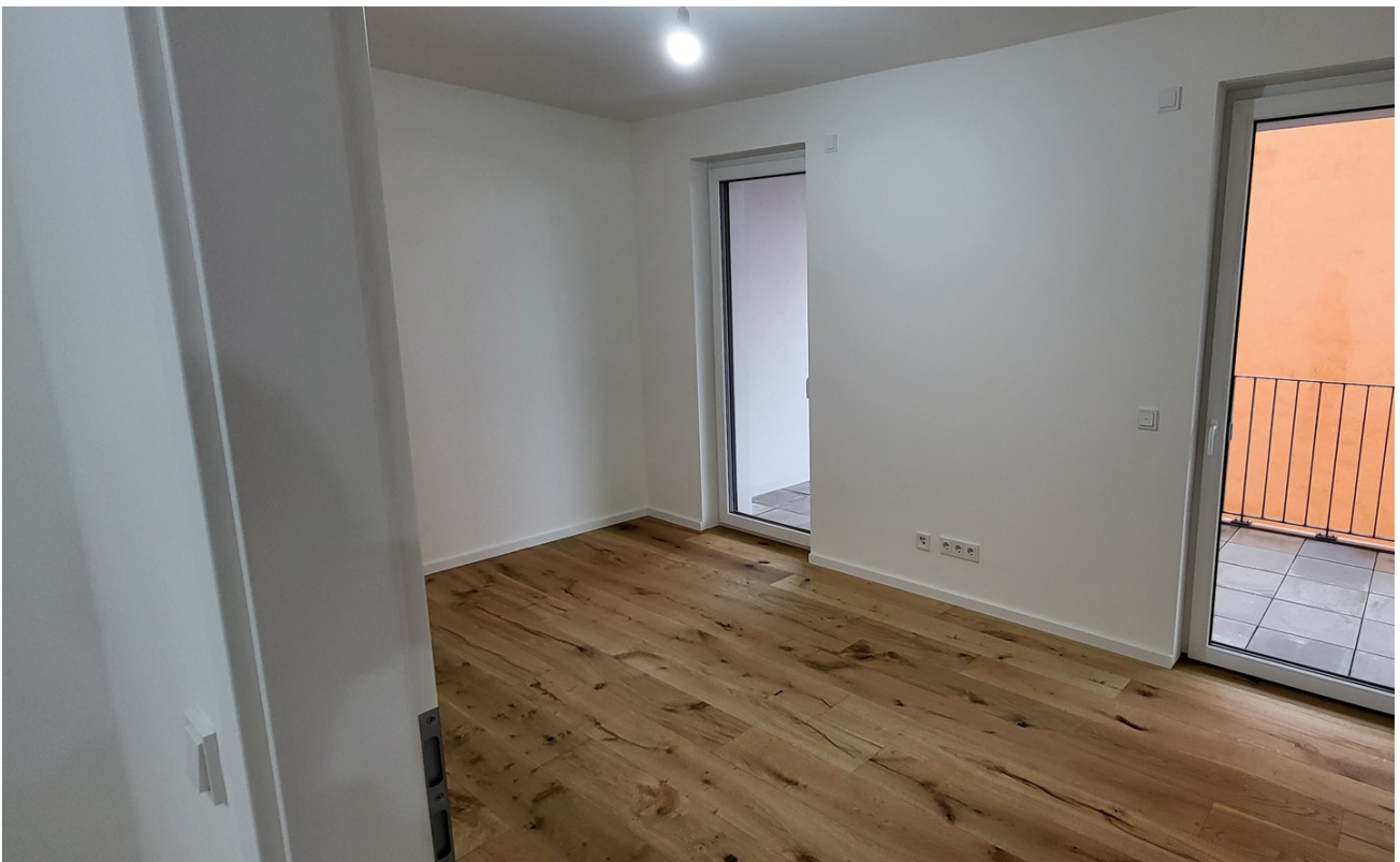
Blick ins Kinder/Arbeitszimmer