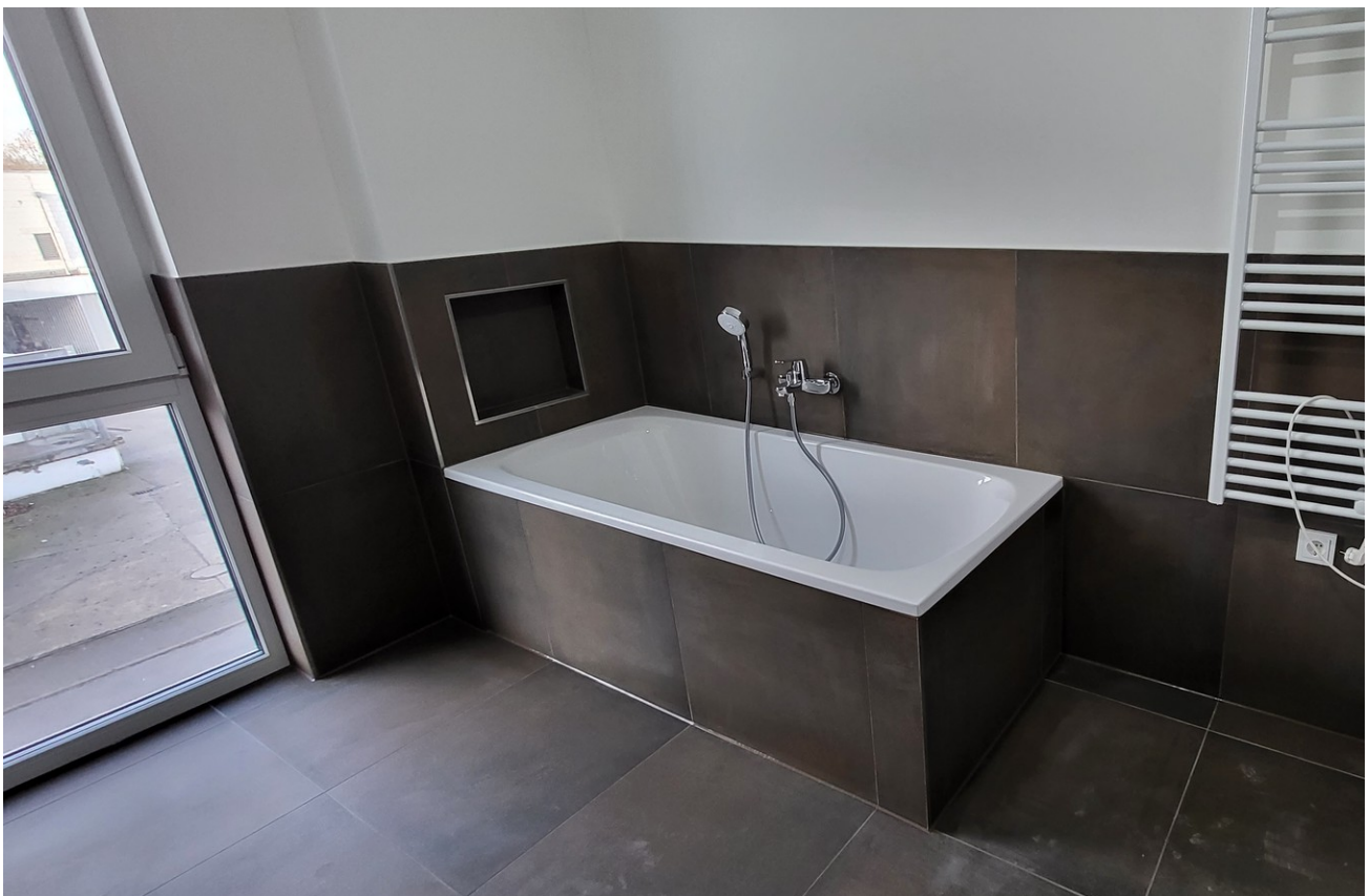
Masterbad mit Wanne und Dusche