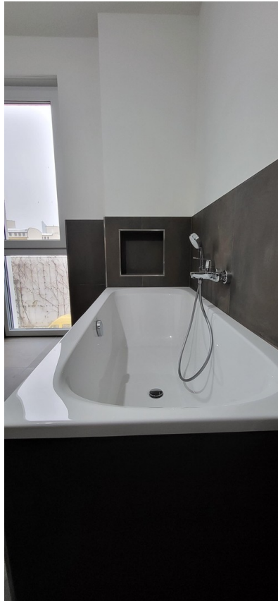
Masterbad Wanne mit Ablage