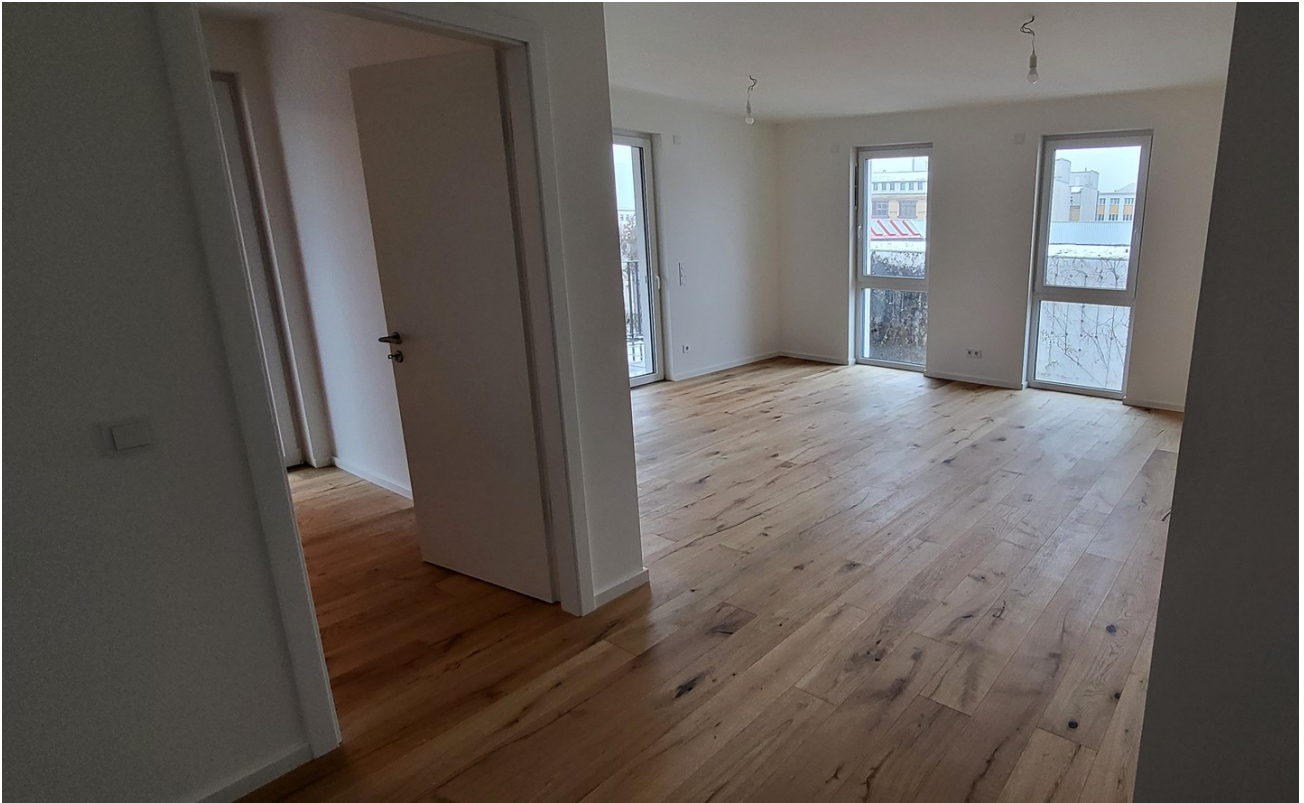
Blick ins neue Wohnzimmer