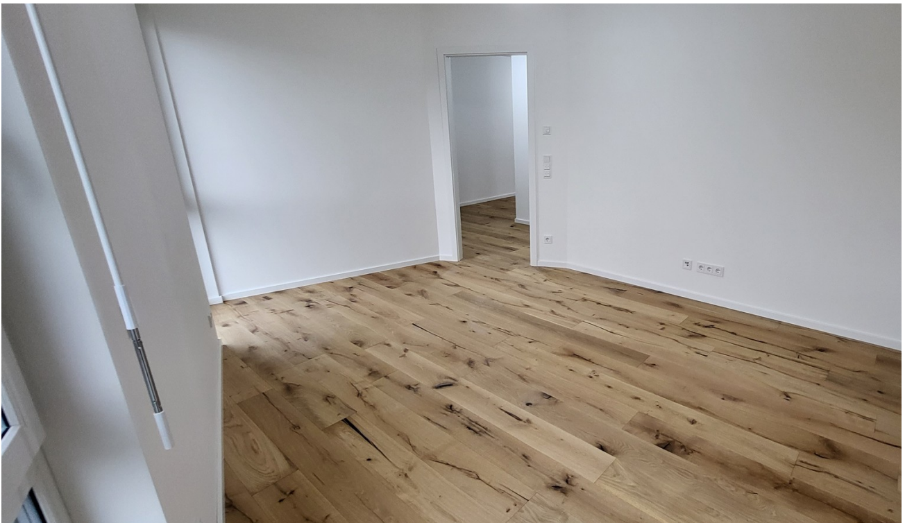
Dein neues Schlafzimmer