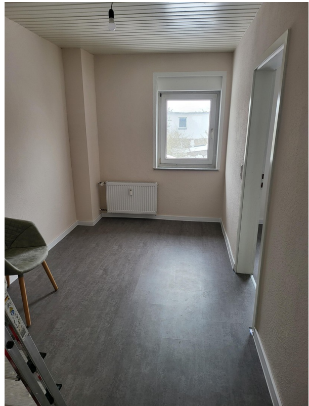
Ankleide / Durchgangszimmer