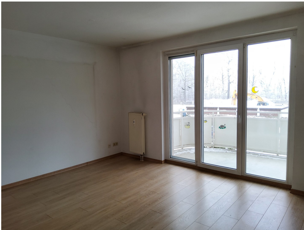
Bild 2 vom Wohnzimmer