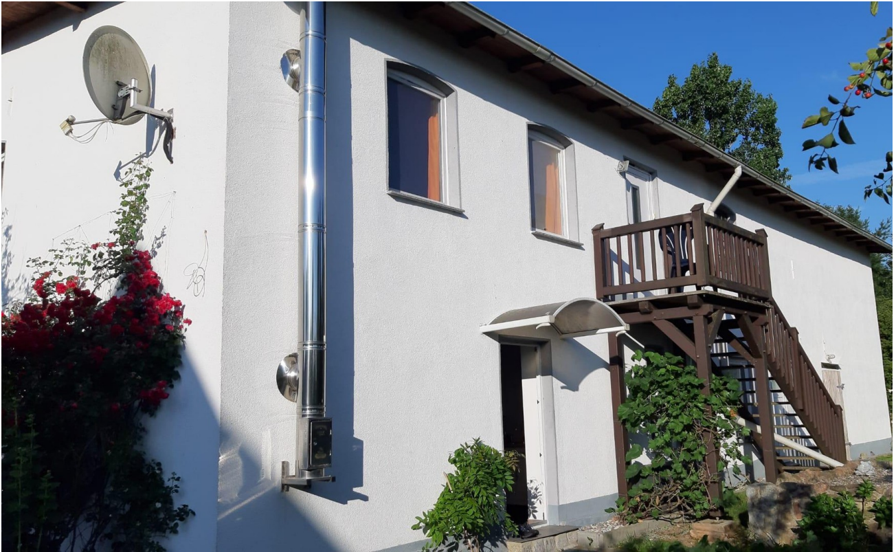
Eingang Wohnung 2