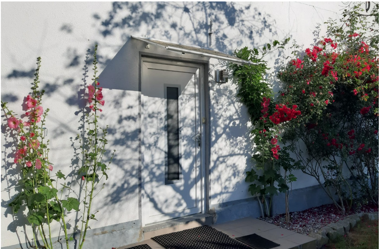
Eingang Wohnung 1