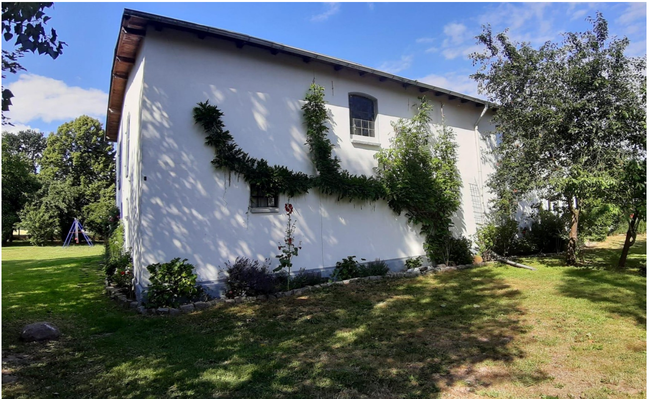
Scheune / Lager