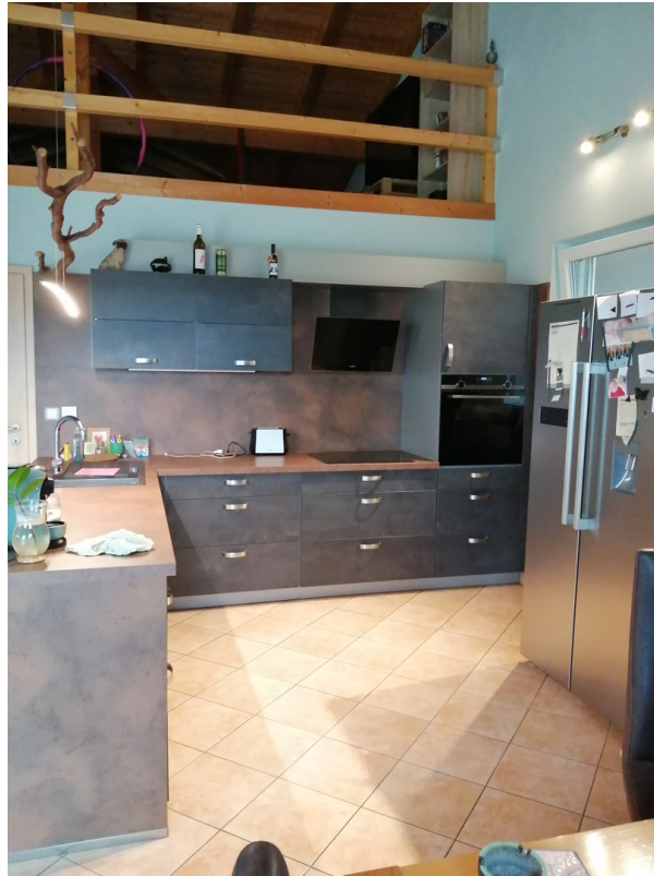
Küche v. 2019