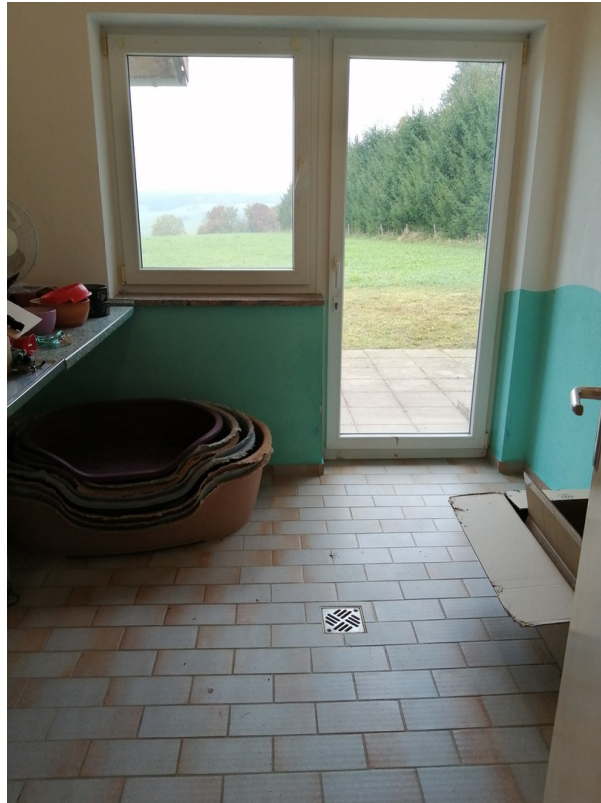
gewerbl. Raum m. West-Terrasse