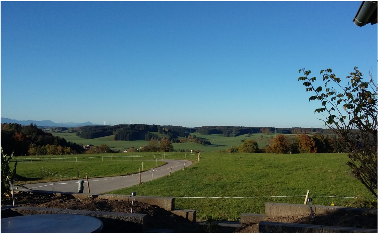
Ausblick v. Terrasse