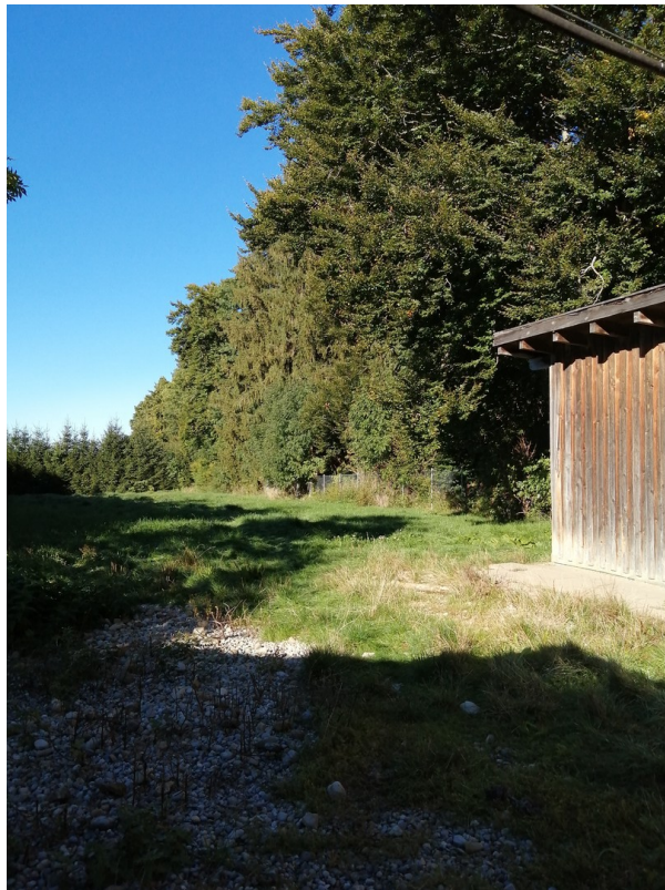
eingez. Außenanlage m. Stadel