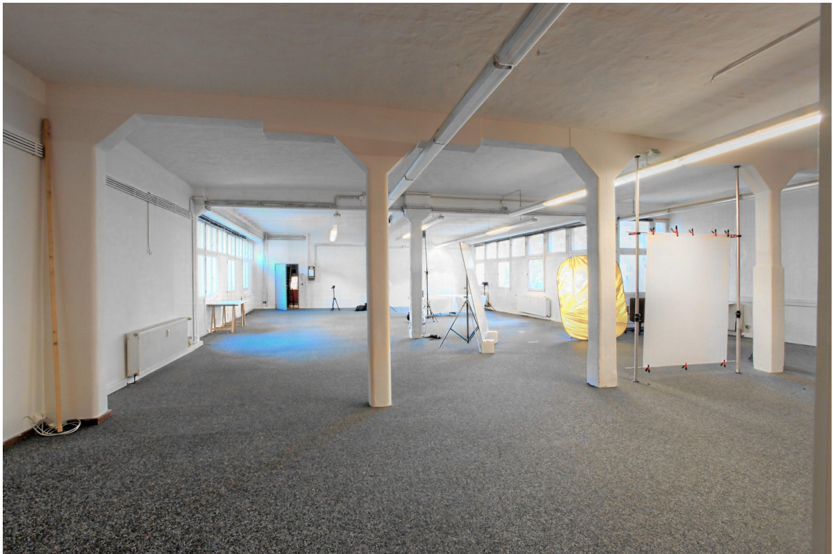
Räume vor Greenscreen-Einbau