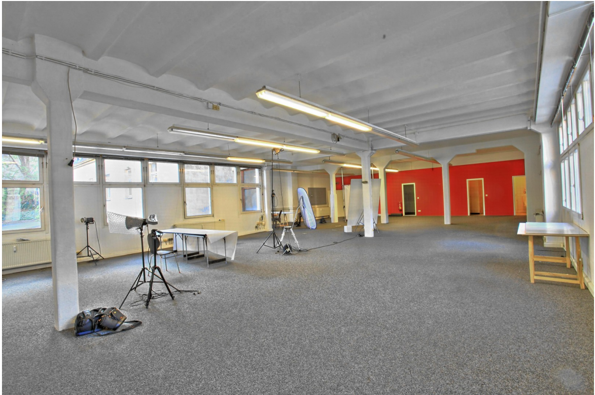
Räume vor Greenscreen-Einbau