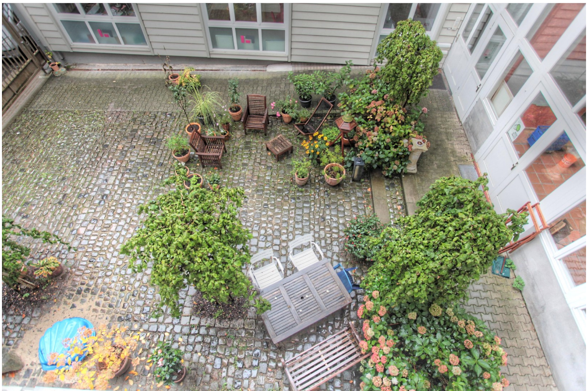
Blick in den Hof