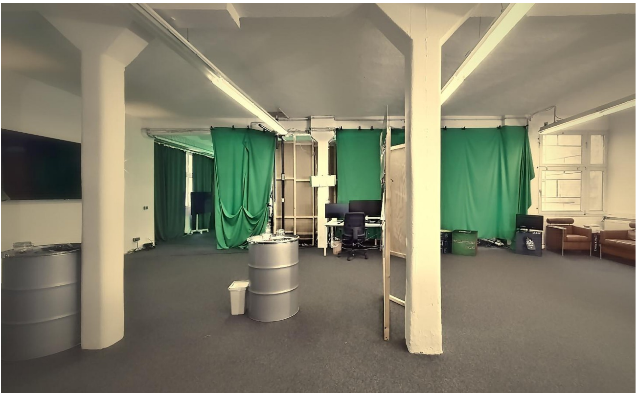
Arbeitsbereich hinter Screen