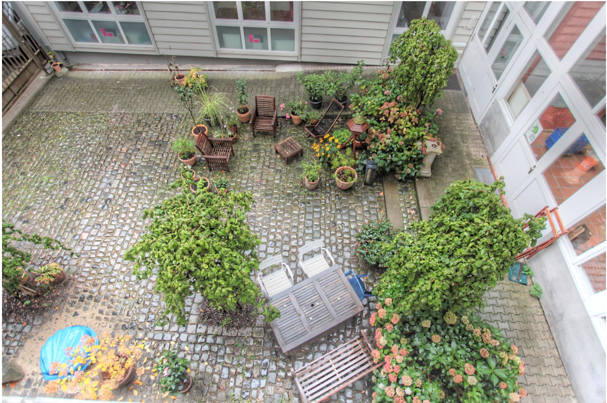
Blick in den Hof