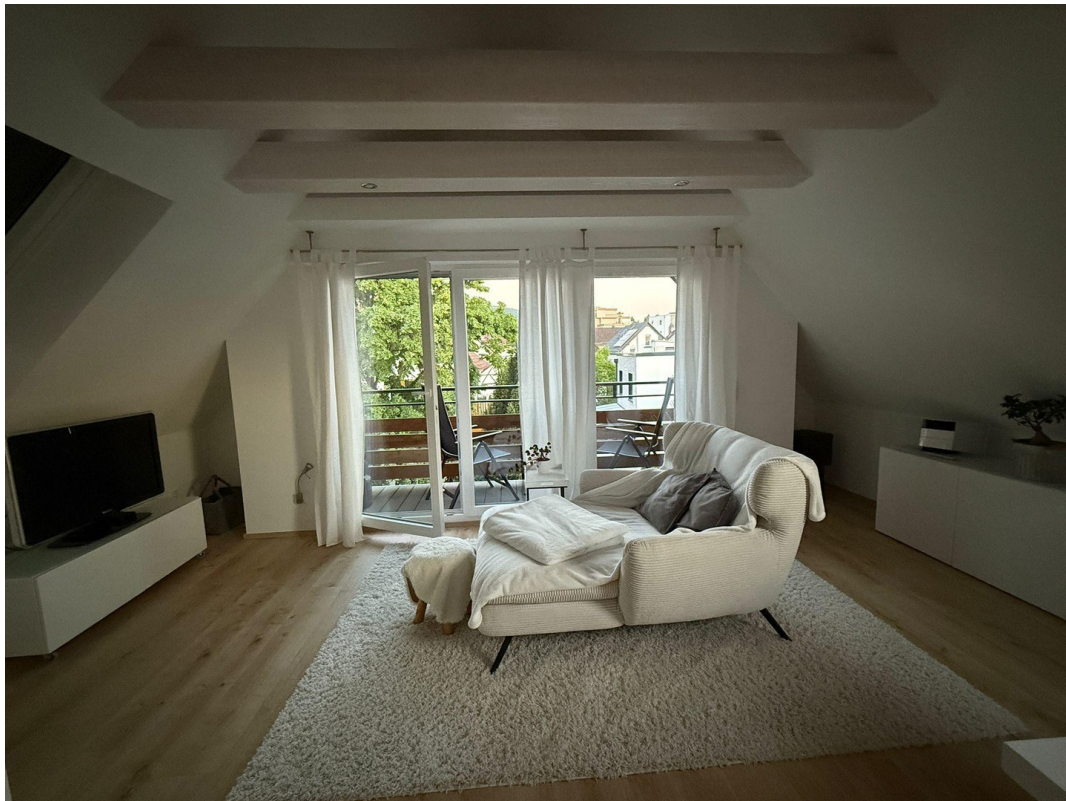
Wohnbereich mit Loggia