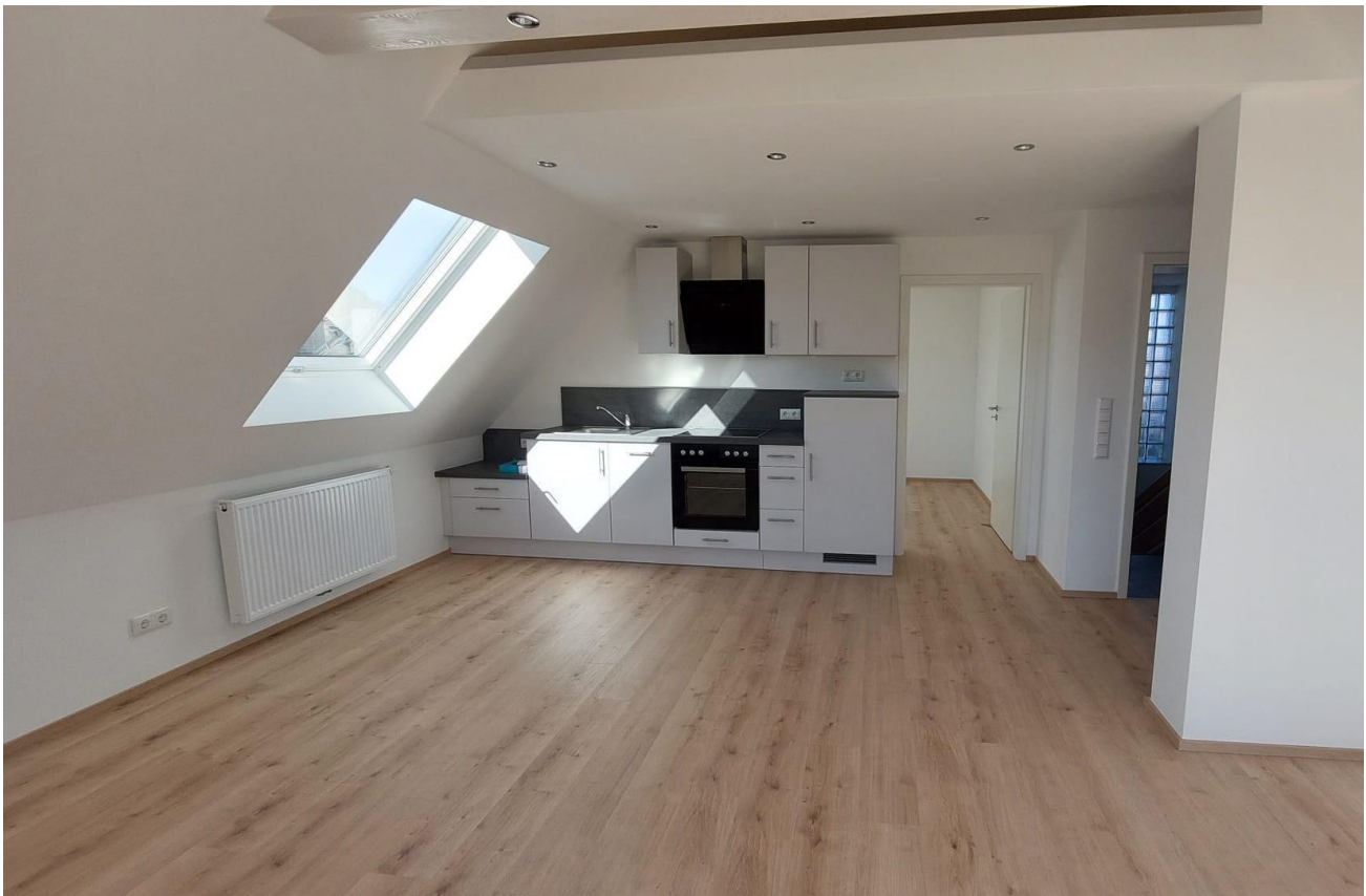
Essbereich mit Einbauküche