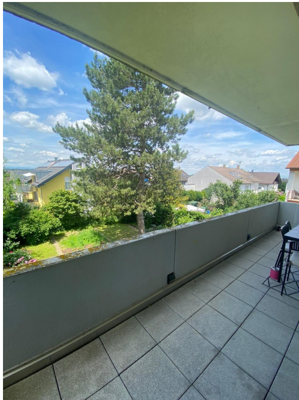
Blick vom Balkon in den Garten