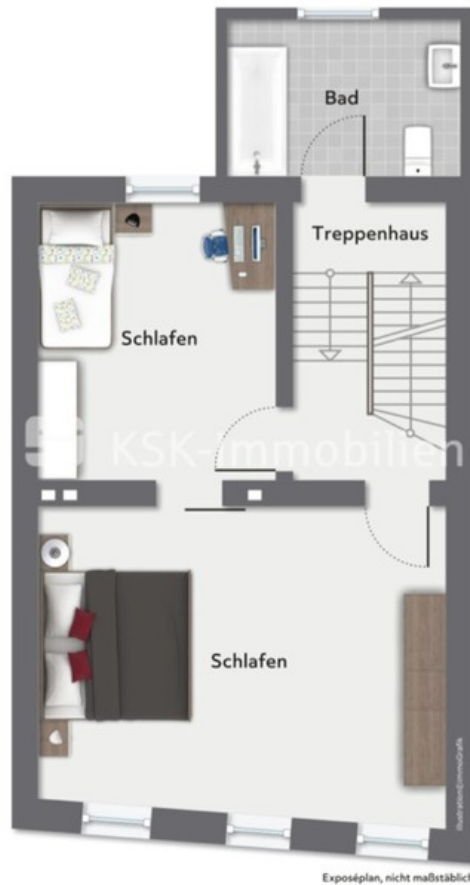
101347 Grundriss Obergeschoss