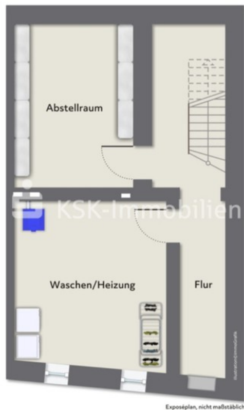
101347 Grundriss Kellergeschoss