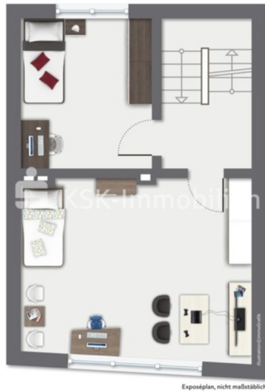
101347 Grundriss Dachgeschoss