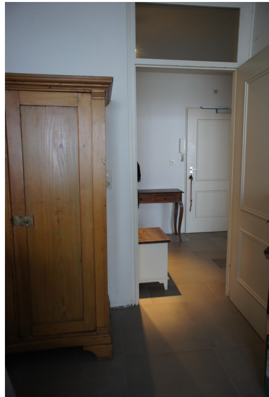
Flur vom Schlafzimmer aus