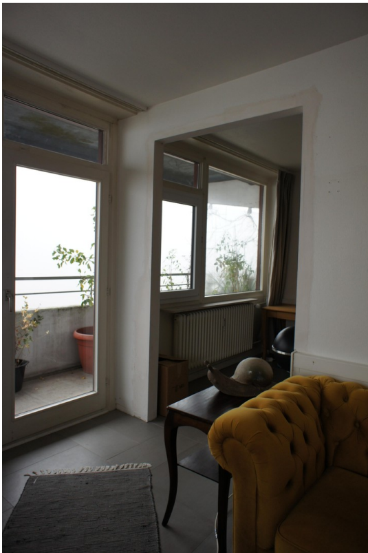
Durchgang zum Schlafzimmer