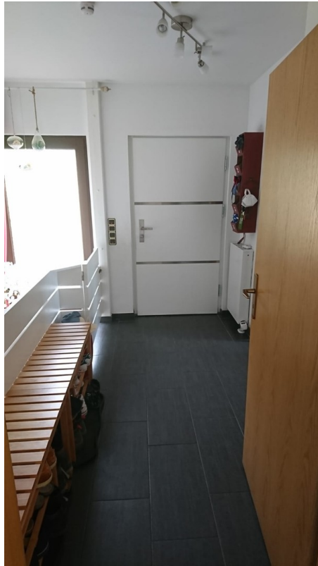
Eingangsbereich / Flur