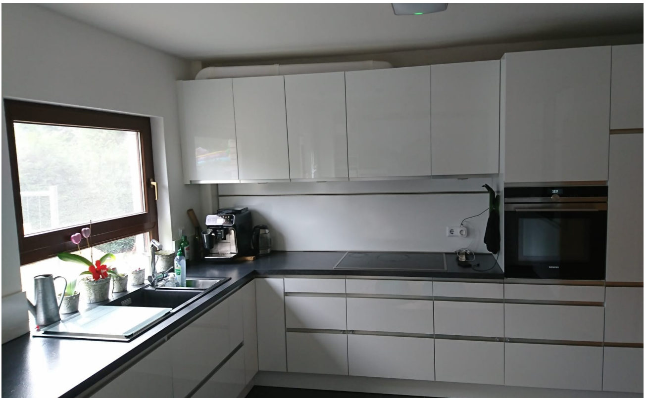
Küche inkl. Einbaugeräte