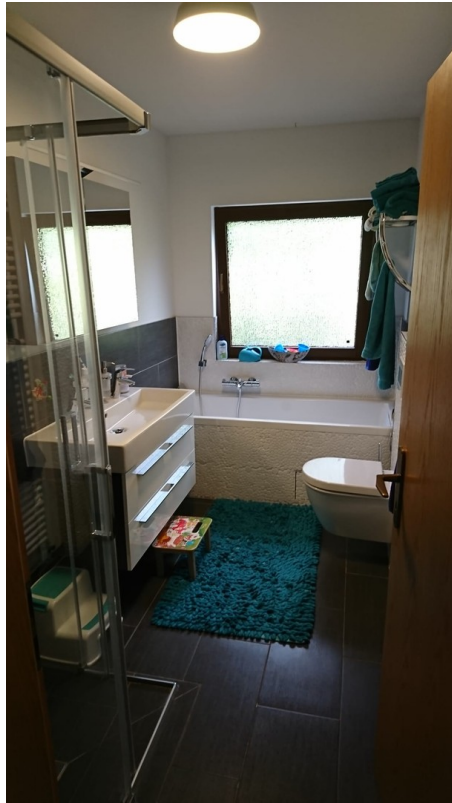
Bad mit Dusche und Badewanne