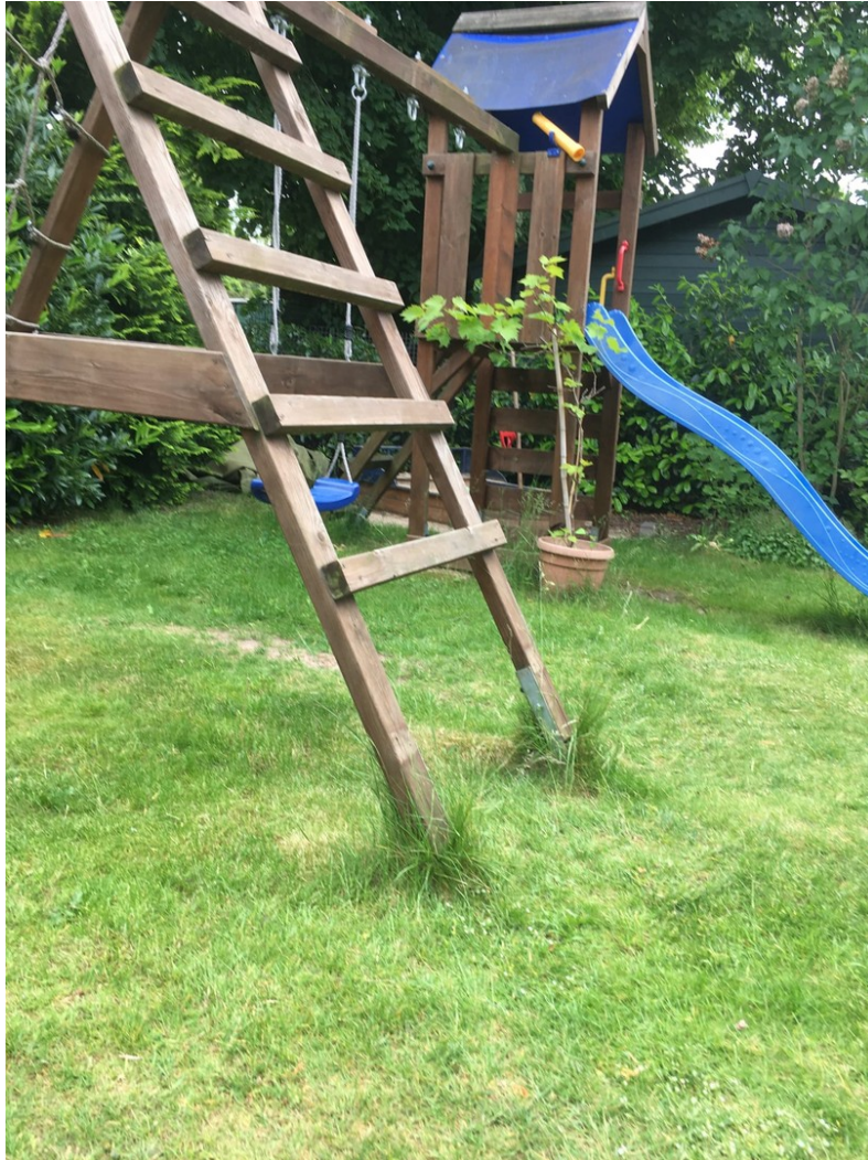
kleiner Spielplatz im Garten