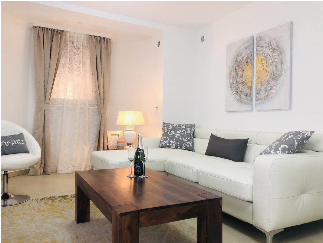
Wohnzimmer m. Einrichtung