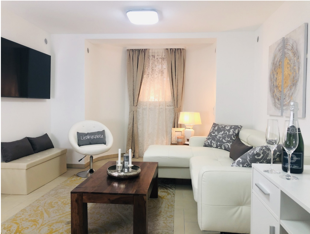
Wohnzimmer m. Smart-TV