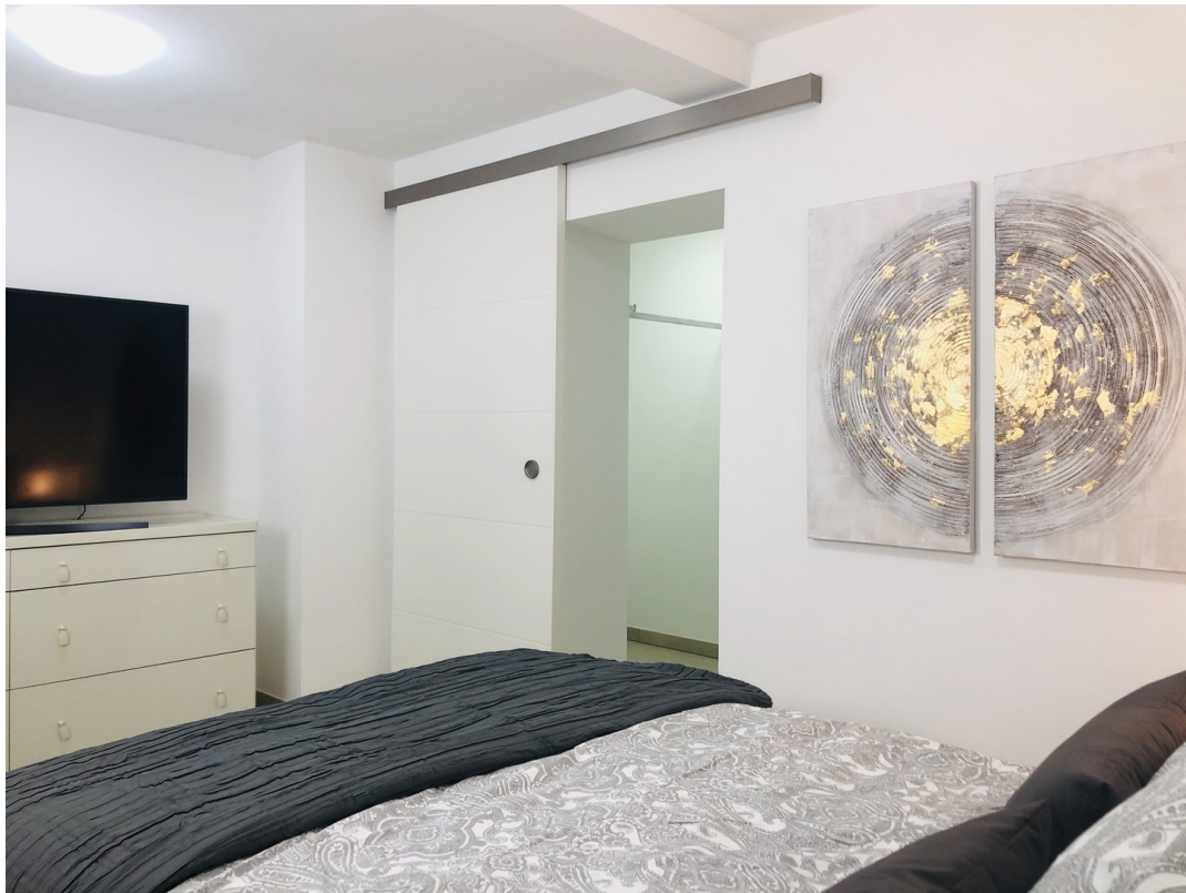
Eingang in begeh. Kleiderschr.