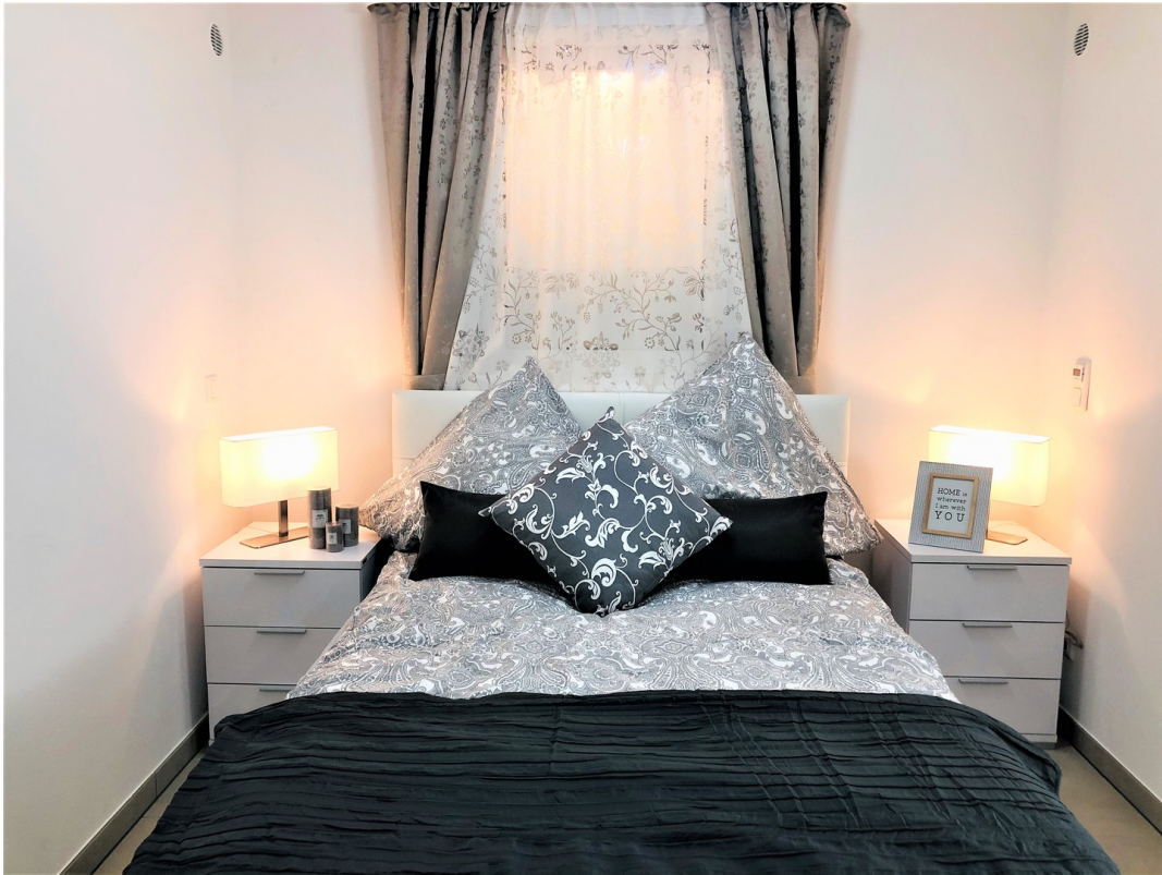
Schlafzimmer mit Einrichtung