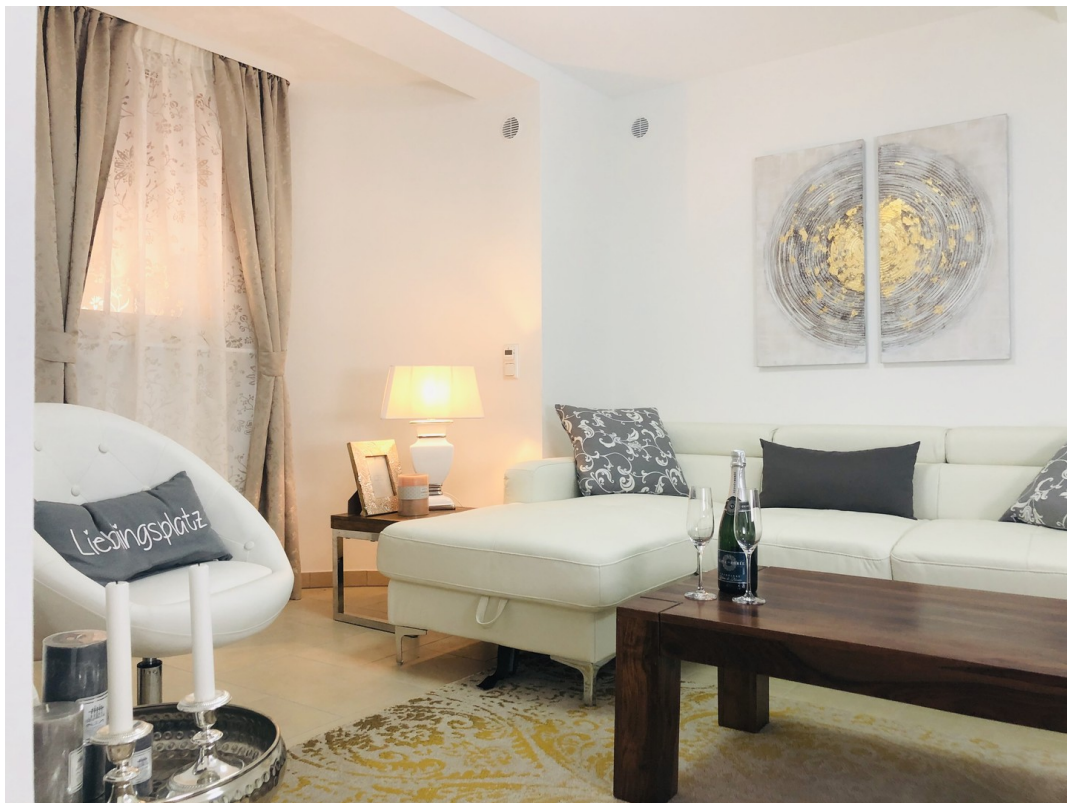
Wohnzimmer m. Einrichtung