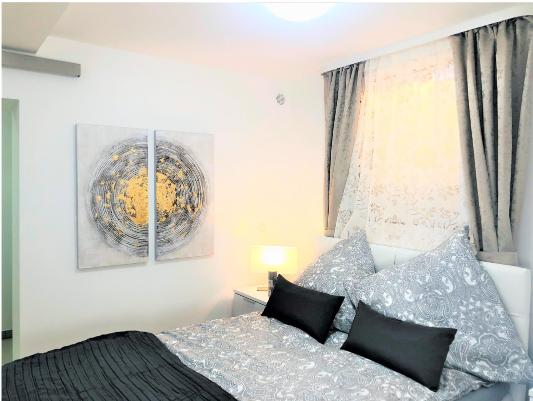
Schlafzimmer mit Einrichtung