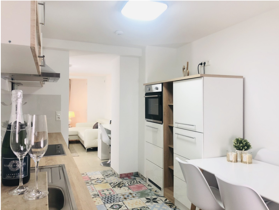
Küche m. kompl. Ausstattung