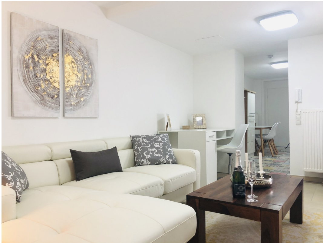
Wohnzimmer m. Einrichtung