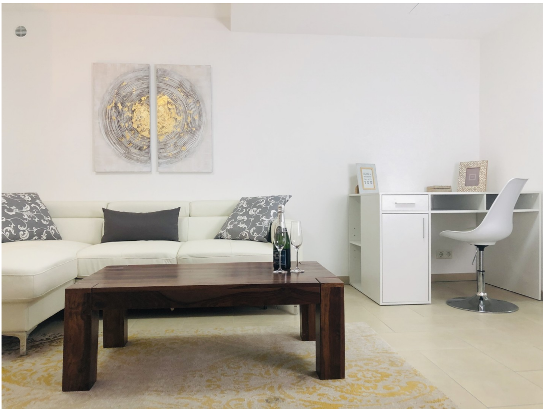
Wohnzimmer m. Büroecke