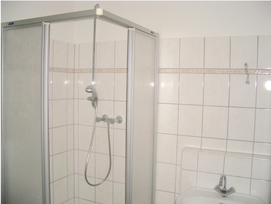
zweites Bad mit Dusche