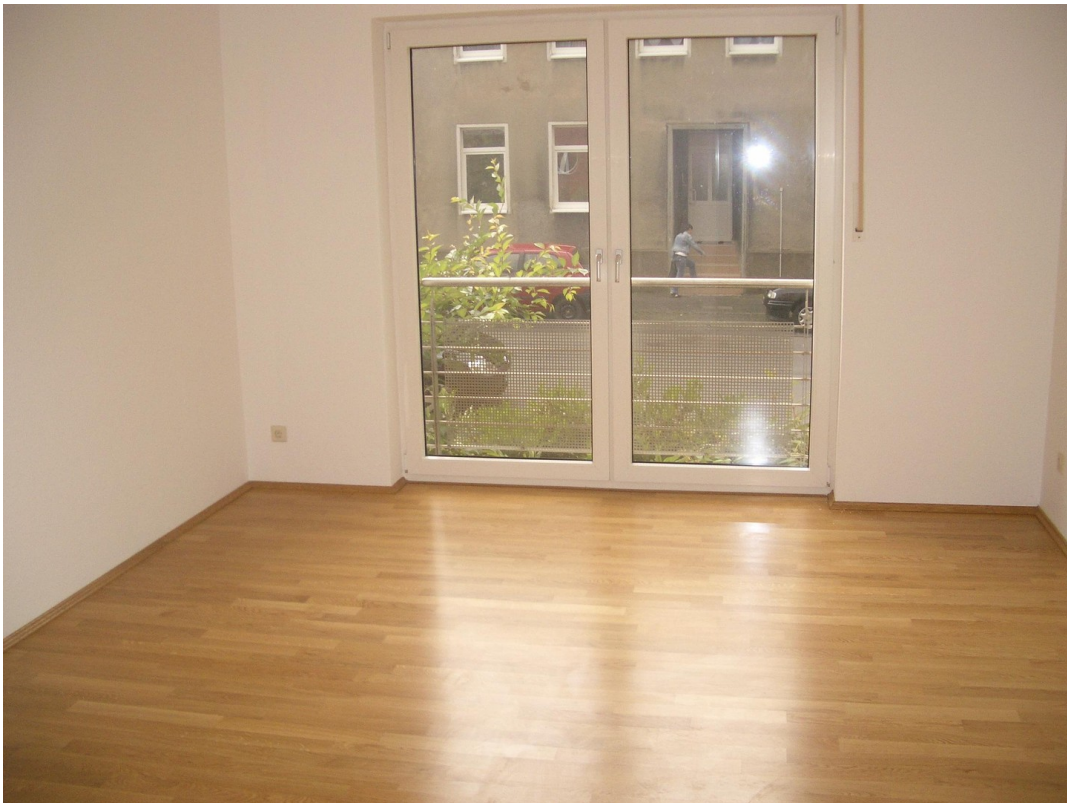
Schlafzimmer m. frz. Balkon