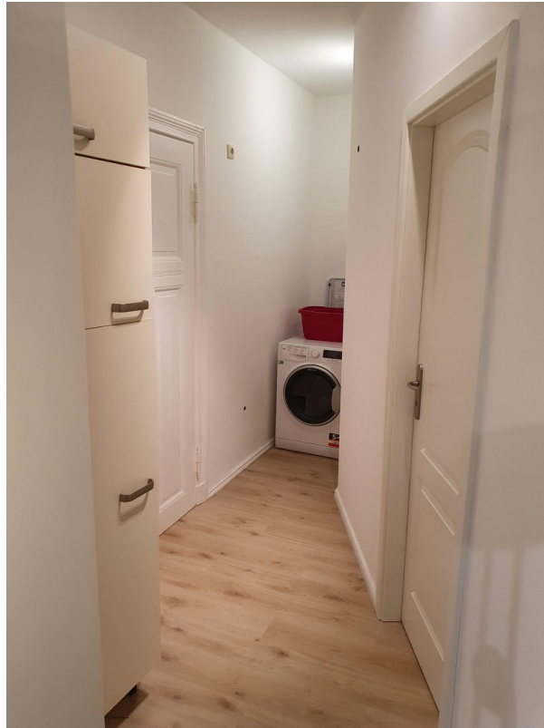
Flur /Waschautomat (Trockner)