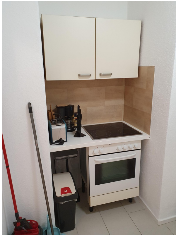
Küche + Geschirrspüler