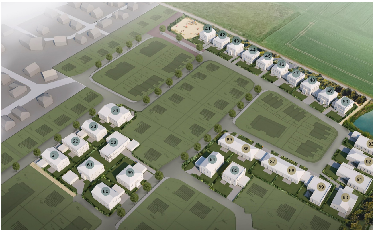
Bauplätze in Königslutter