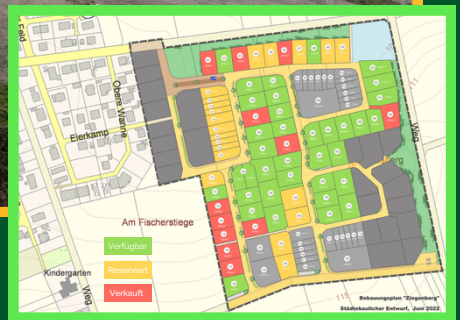
Städtebaulicher Entwurf (Stand April 2026)