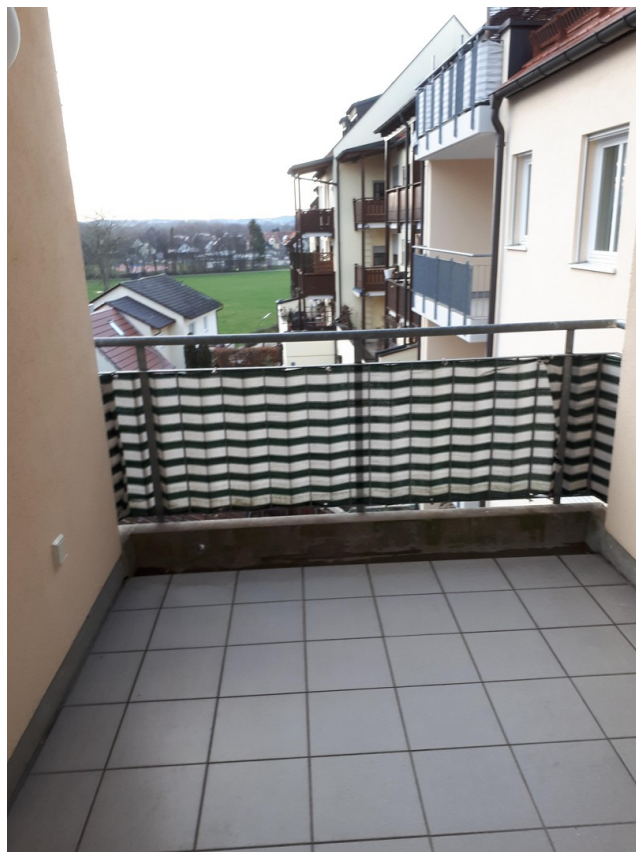
Loggia mit SW-Ausrichtung