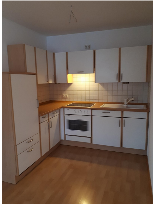
Maß EBK incl. E-Geräte