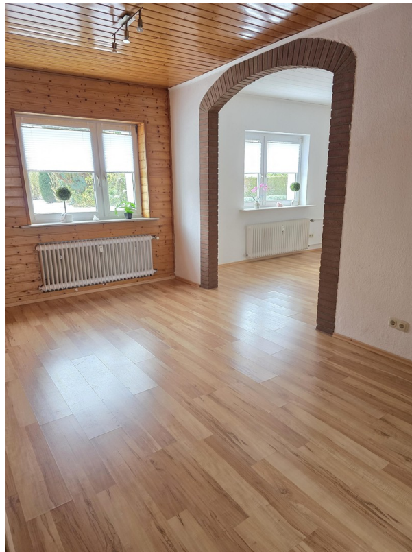
...mit viel Licht