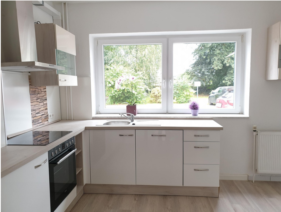
...mit Blick in den Garten...