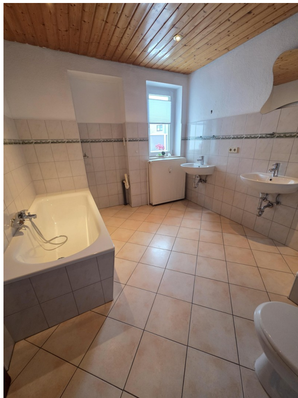
Vollbad mit Wanne...