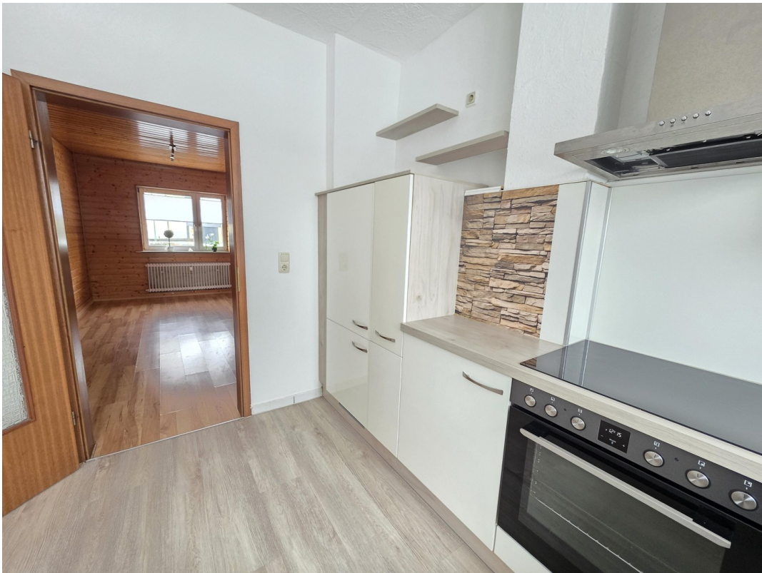
...und viel Platz