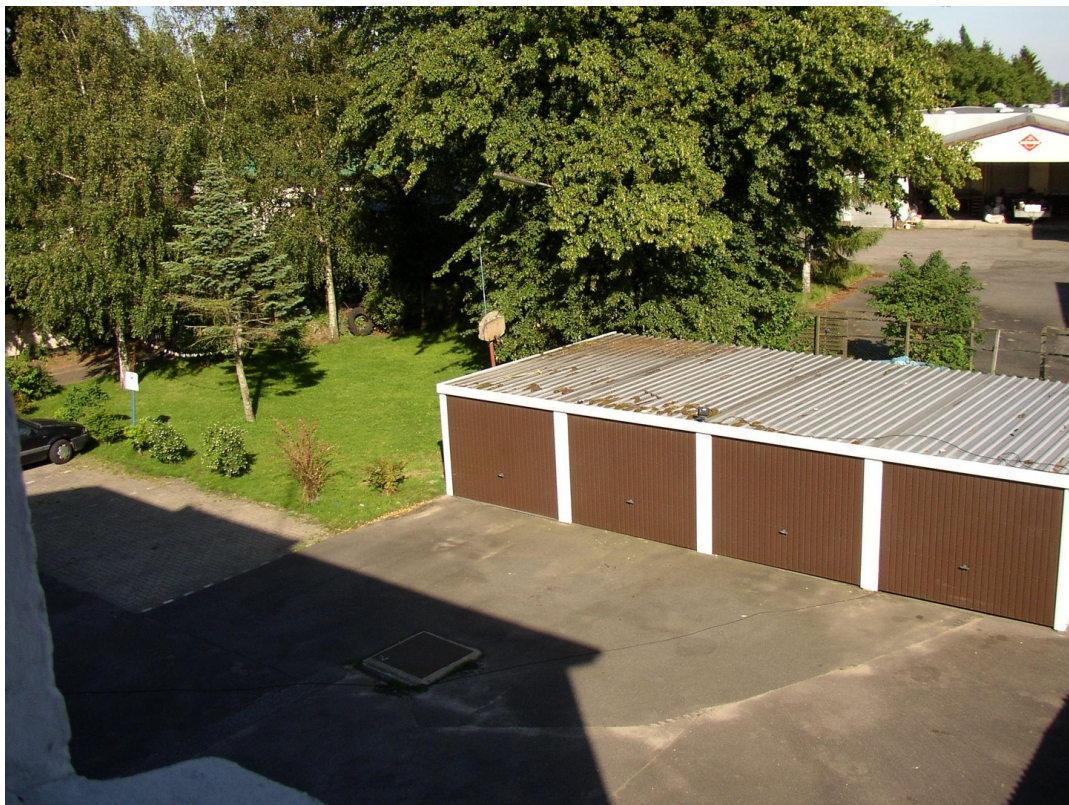
Blick auf die Garagen