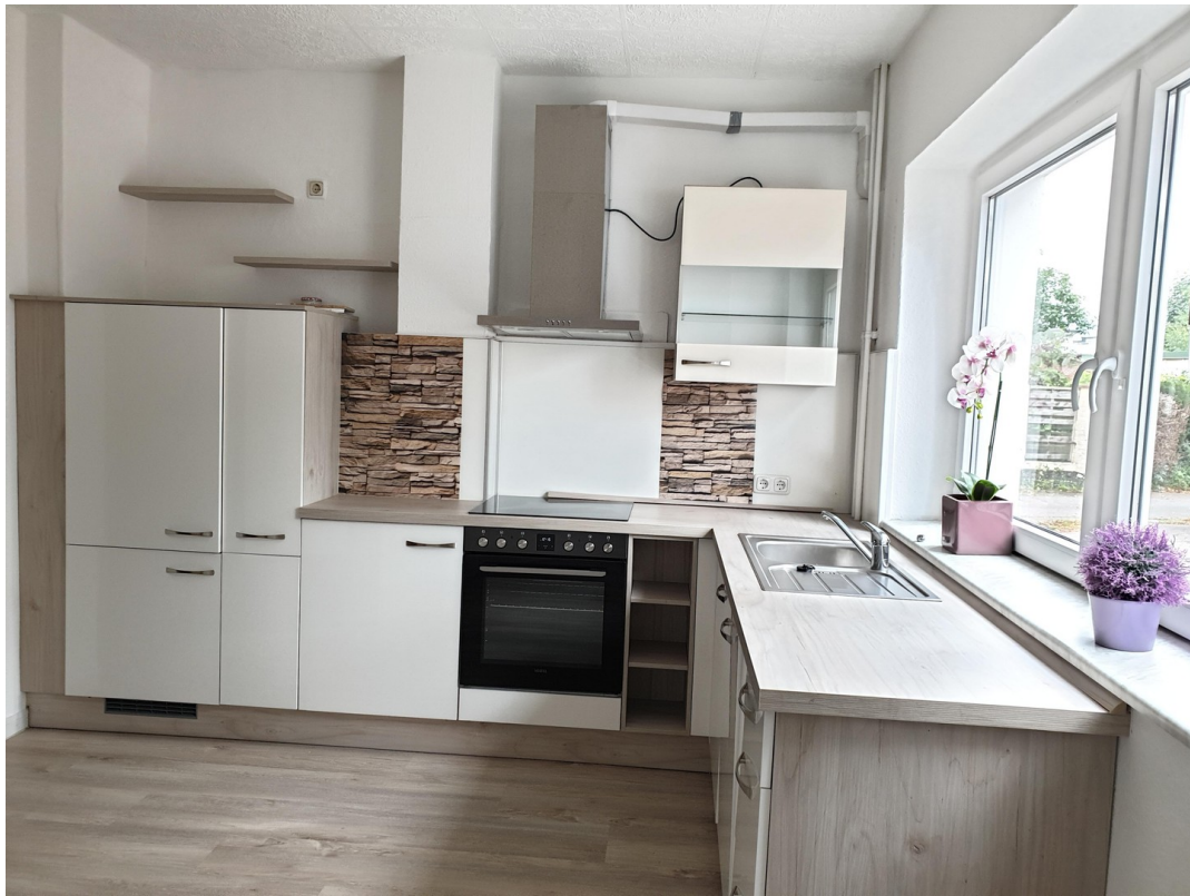
.....mit viel Platz