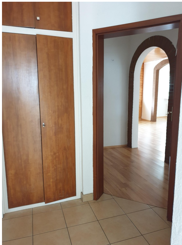
Stauraum im Einbauschränk