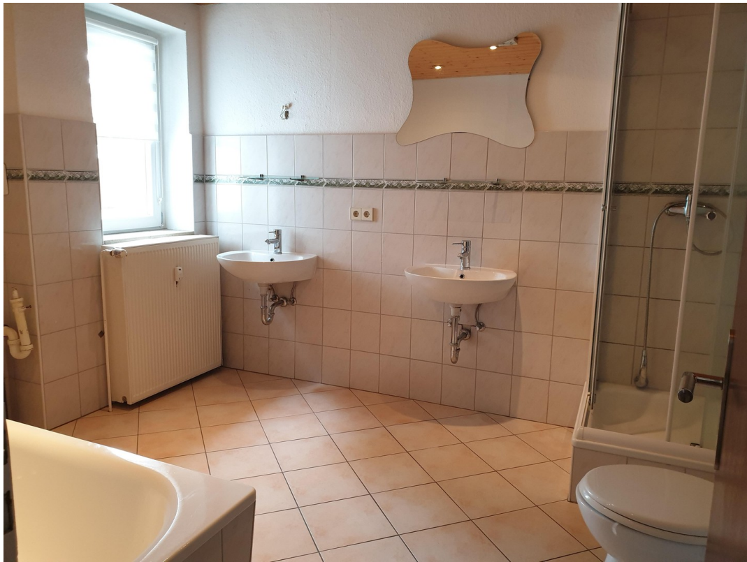
Vollbad mit Dusche ....