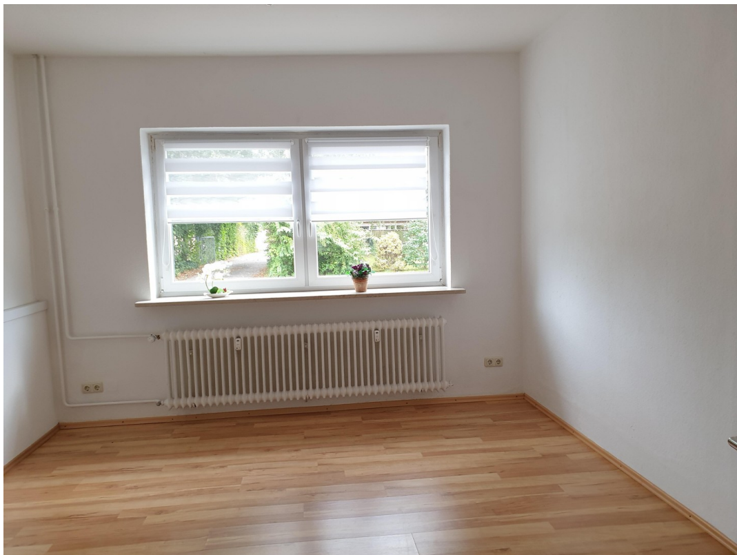
....für große Schränke