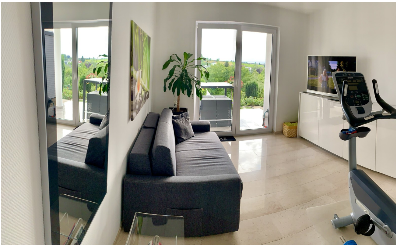
Sportraum / Zimme Gartenebene