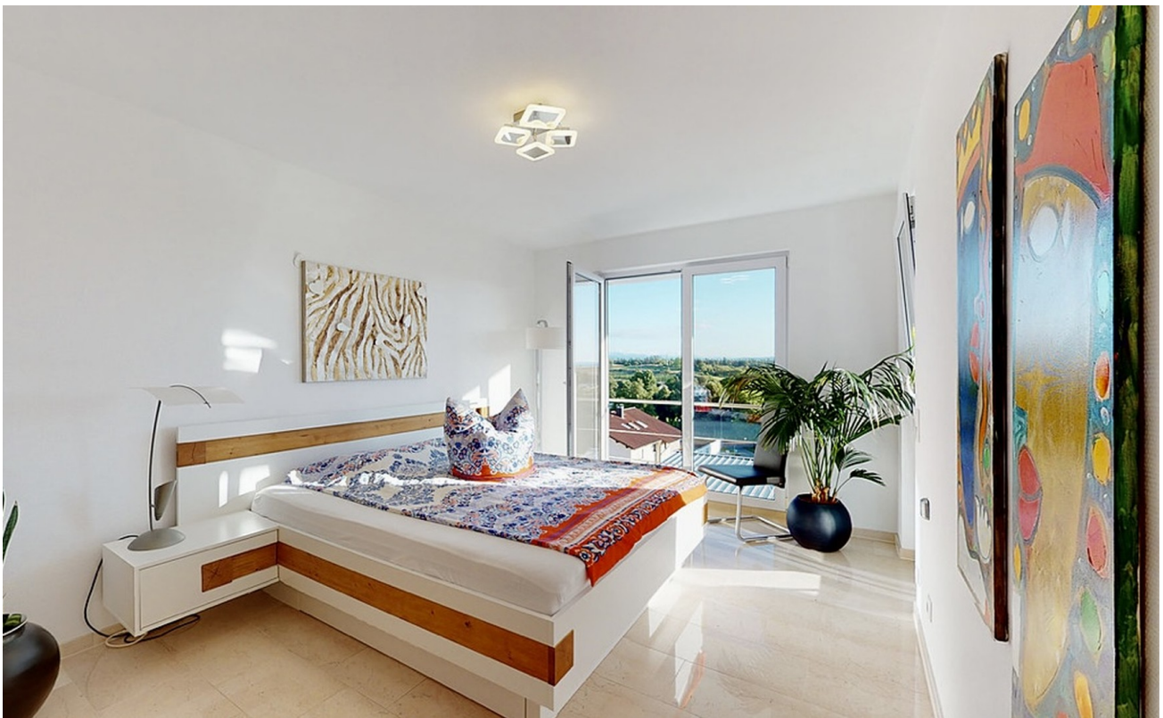
Zimmer mit Bodenseeblick