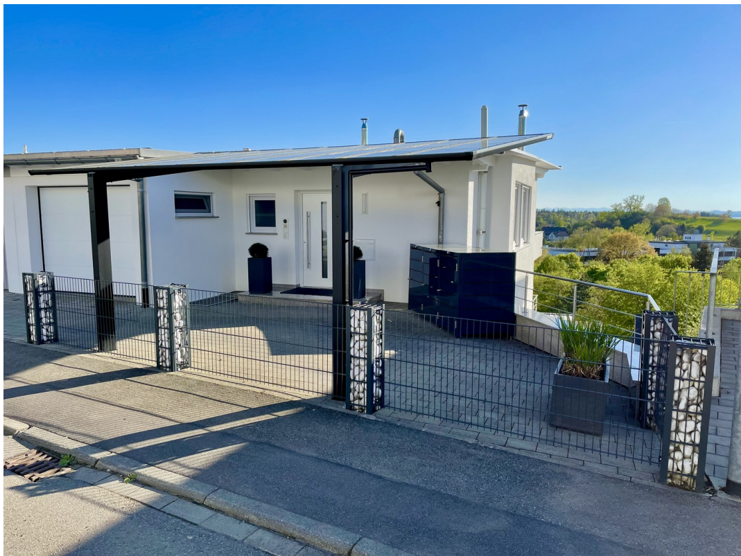
Carport / Eingang