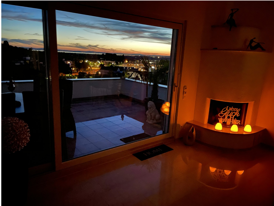
Wohnbereich / Terrasse