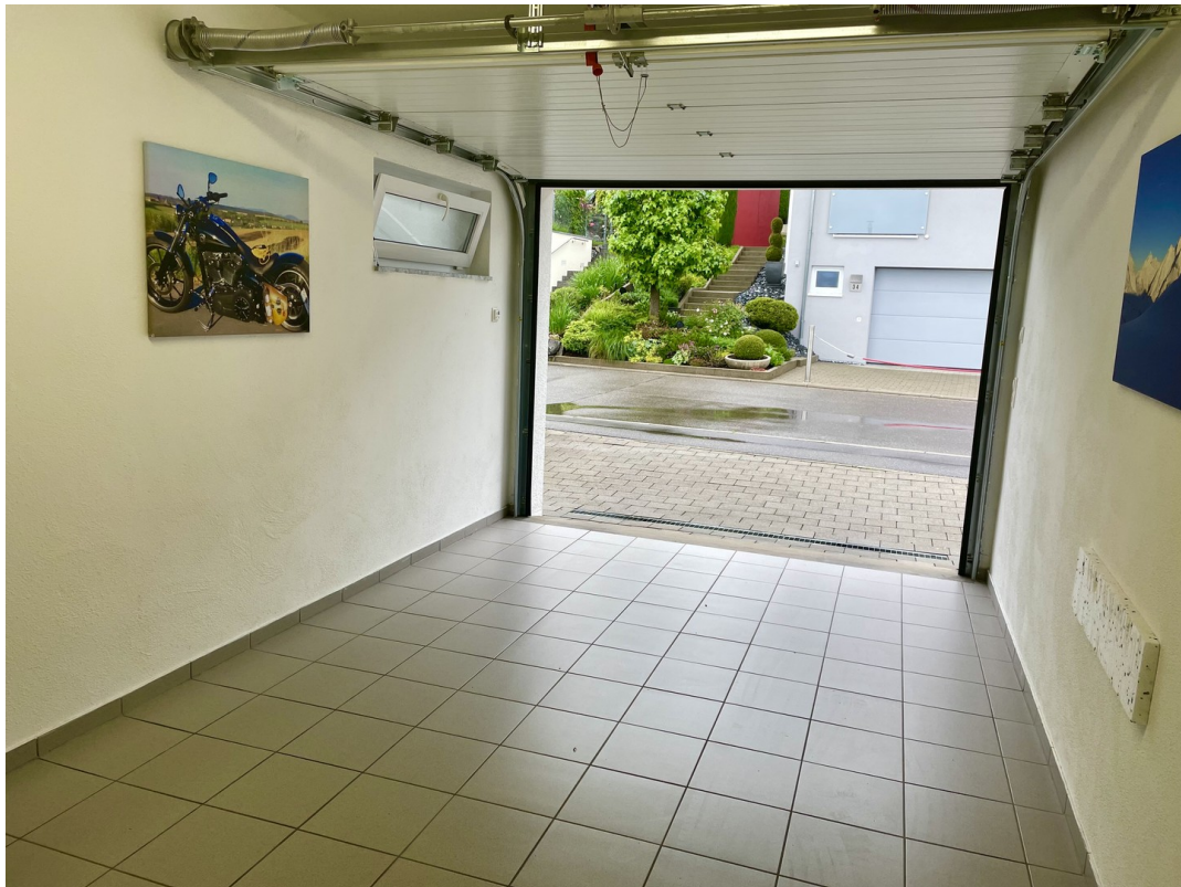
Garage XXL Format