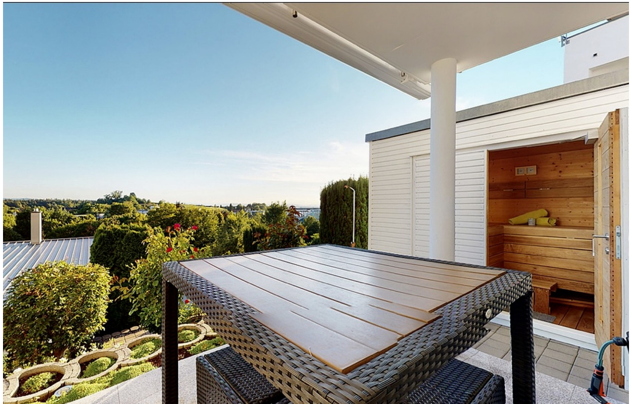
Gartenbereich mit Sauna