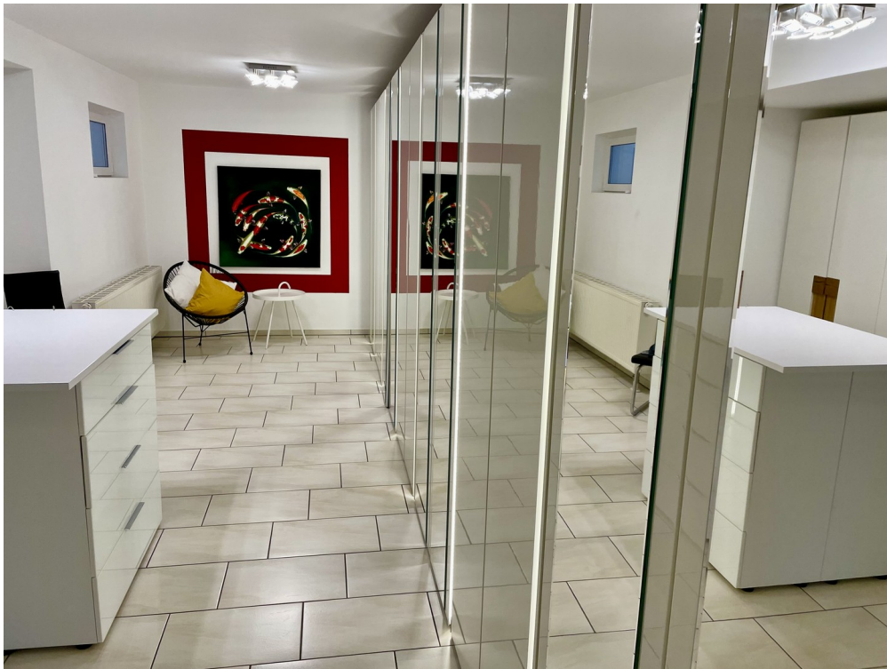
Grosser Raum Schlafebene