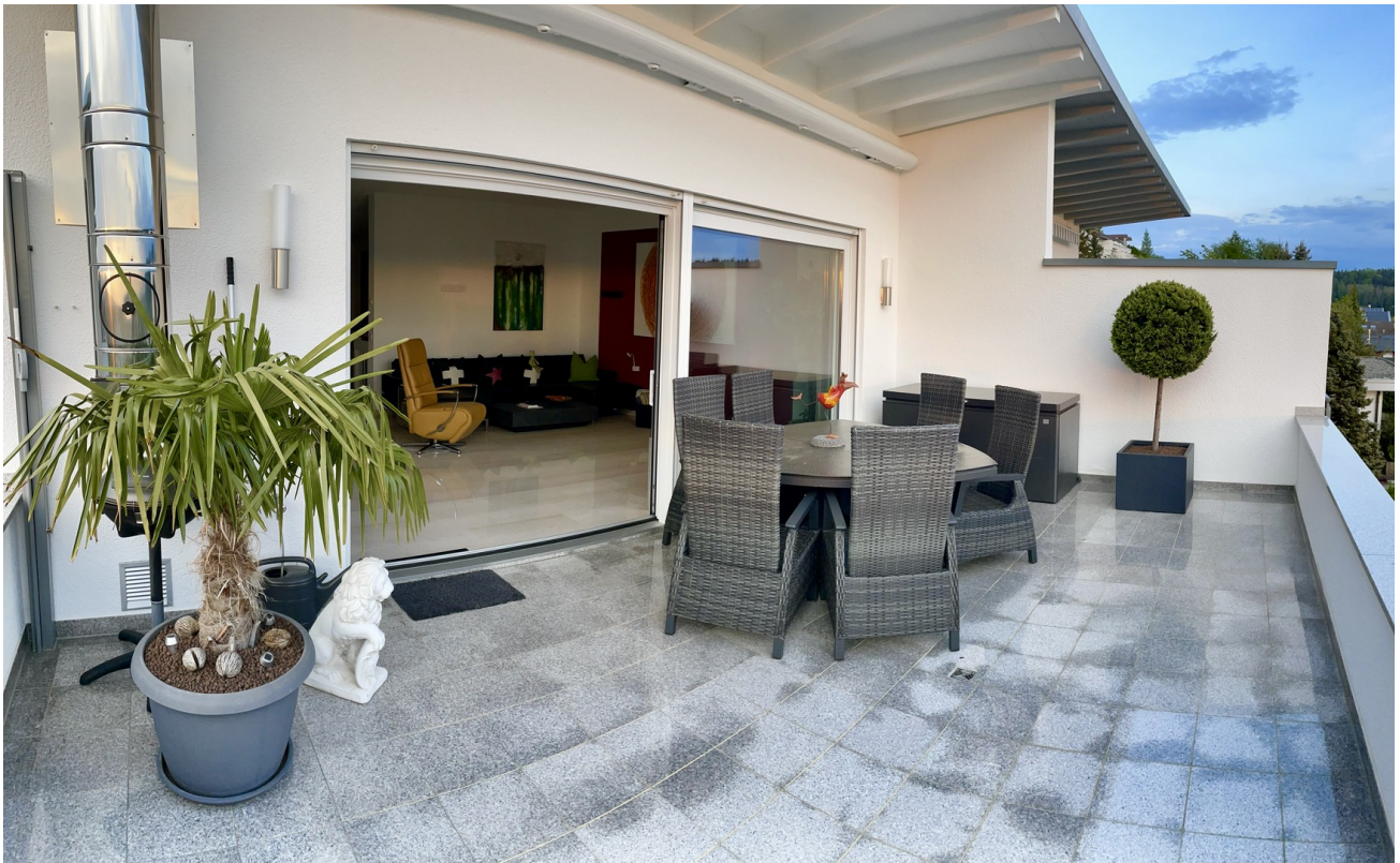
Balkon / Terrasse