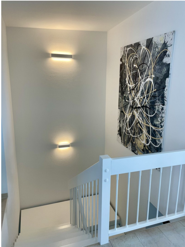
Treppe zum Schlafbereich