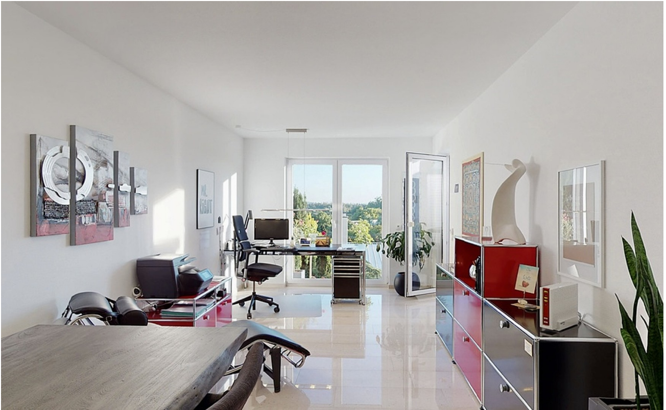
Büro / Zimmer Gartenebene