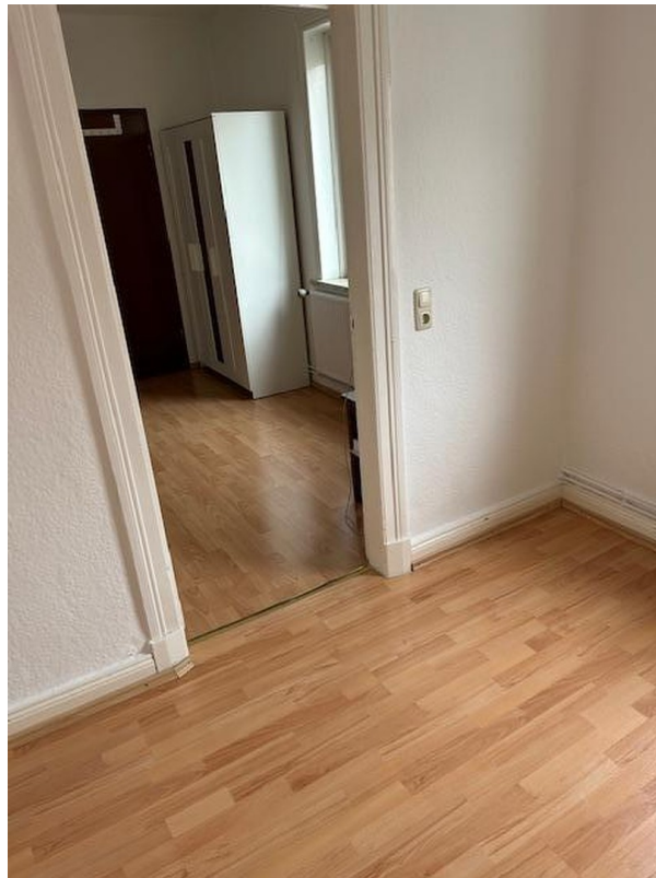
Blick ins Zimmer