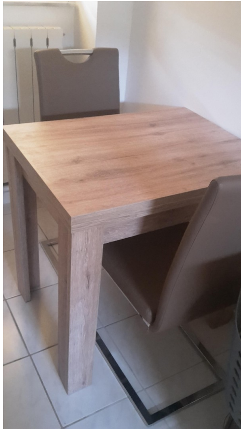
Essplatz in der Küche