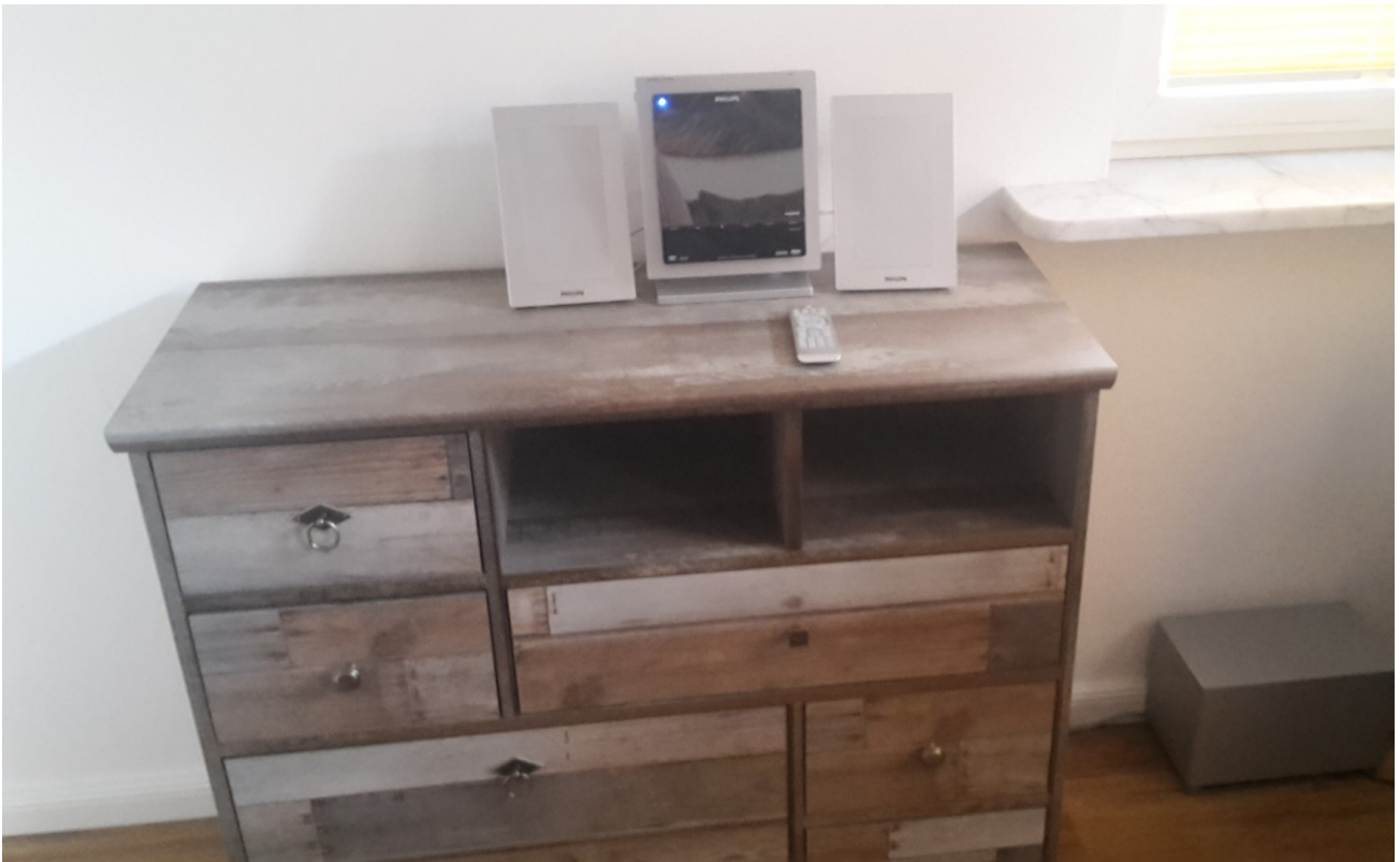
Kommode und Stereo Gerät