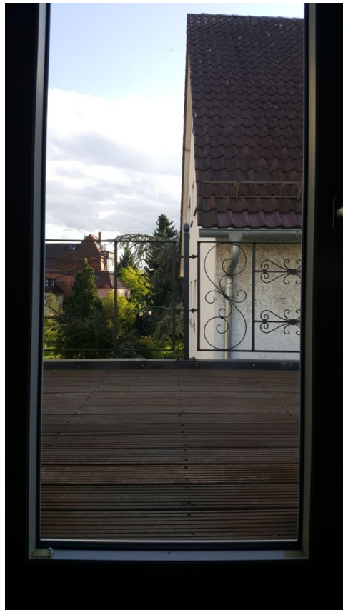
Ausgang zur Dachterrasse