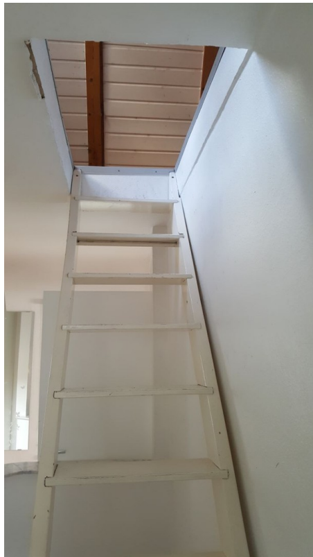
Treppenaufgang zum DG