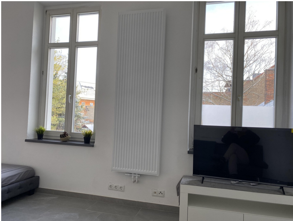
Gartenblick und Smart TV