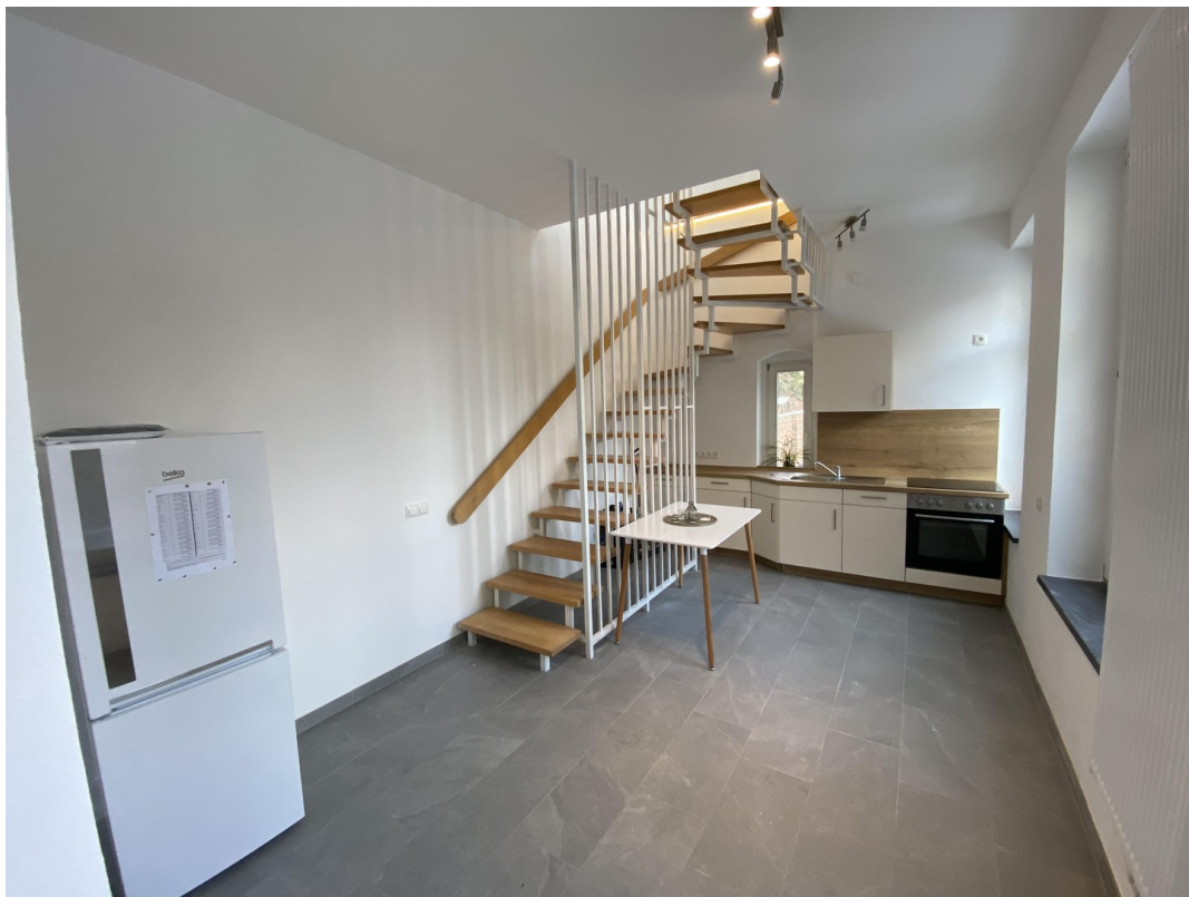
Treppe ins obere Geschoss