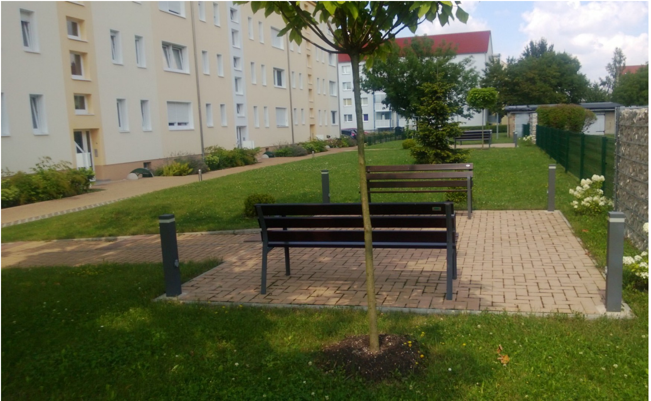
In Ruhe Entspannen...