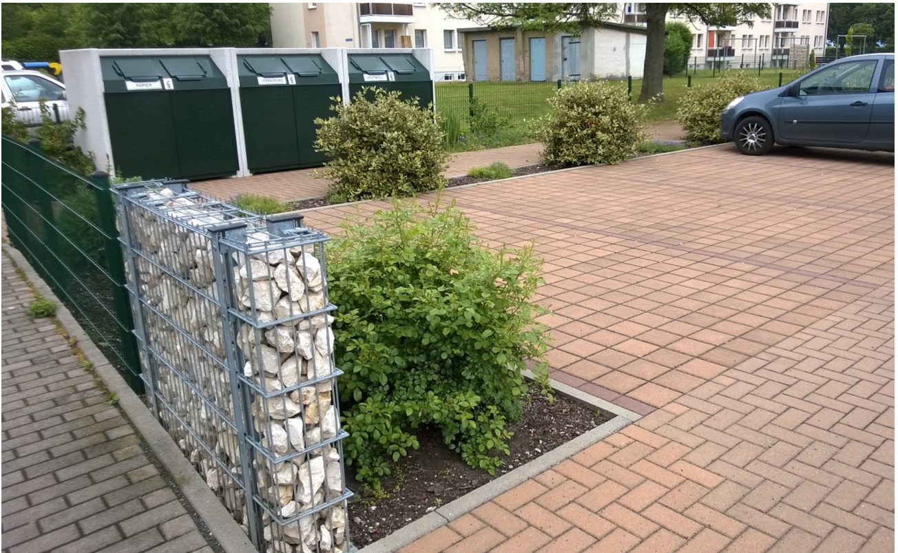
Parken jederzeit möglich....