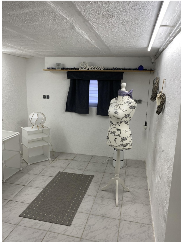
Keller / Büro