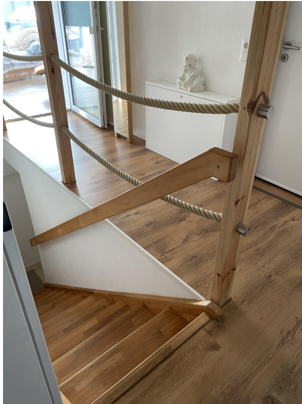
Galerie mit Kellertreppe