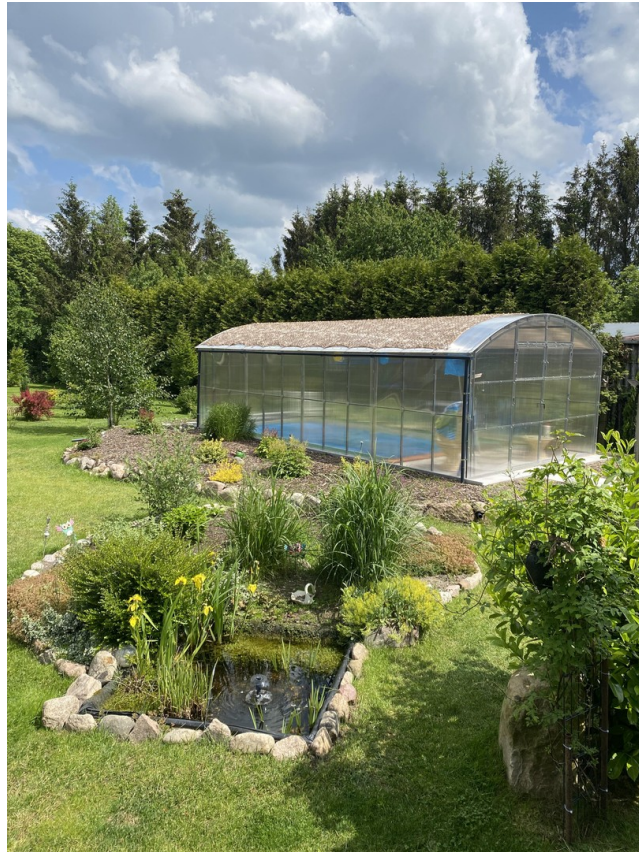
Poolhaus und Teich