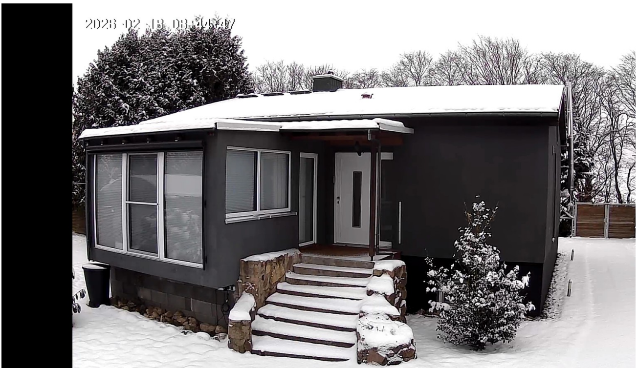
Winter in Stöllnitz