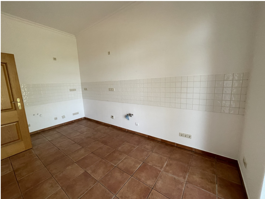
Küche ohne EBK