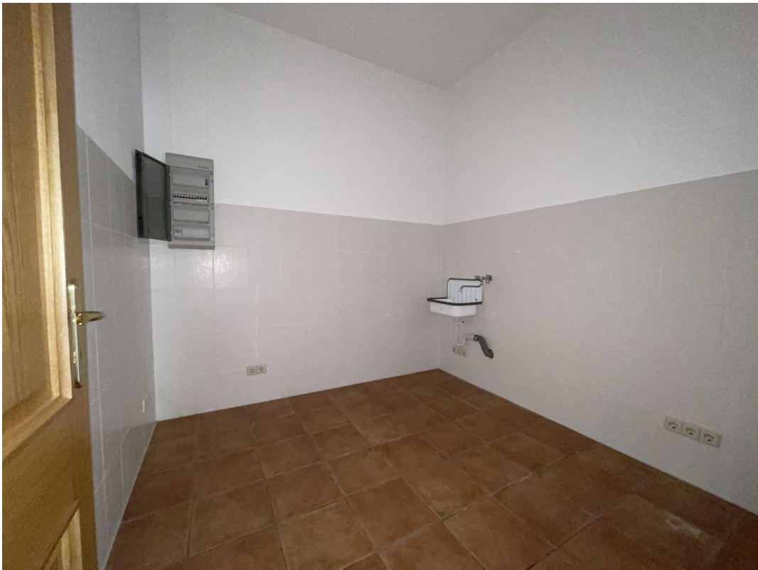
Hauswirtschaftsraum ohne Möbel