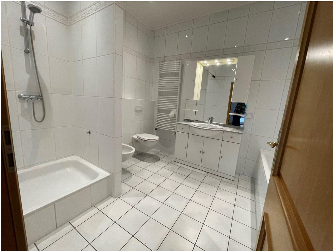
1. Bad mit Dusche u. Wanne