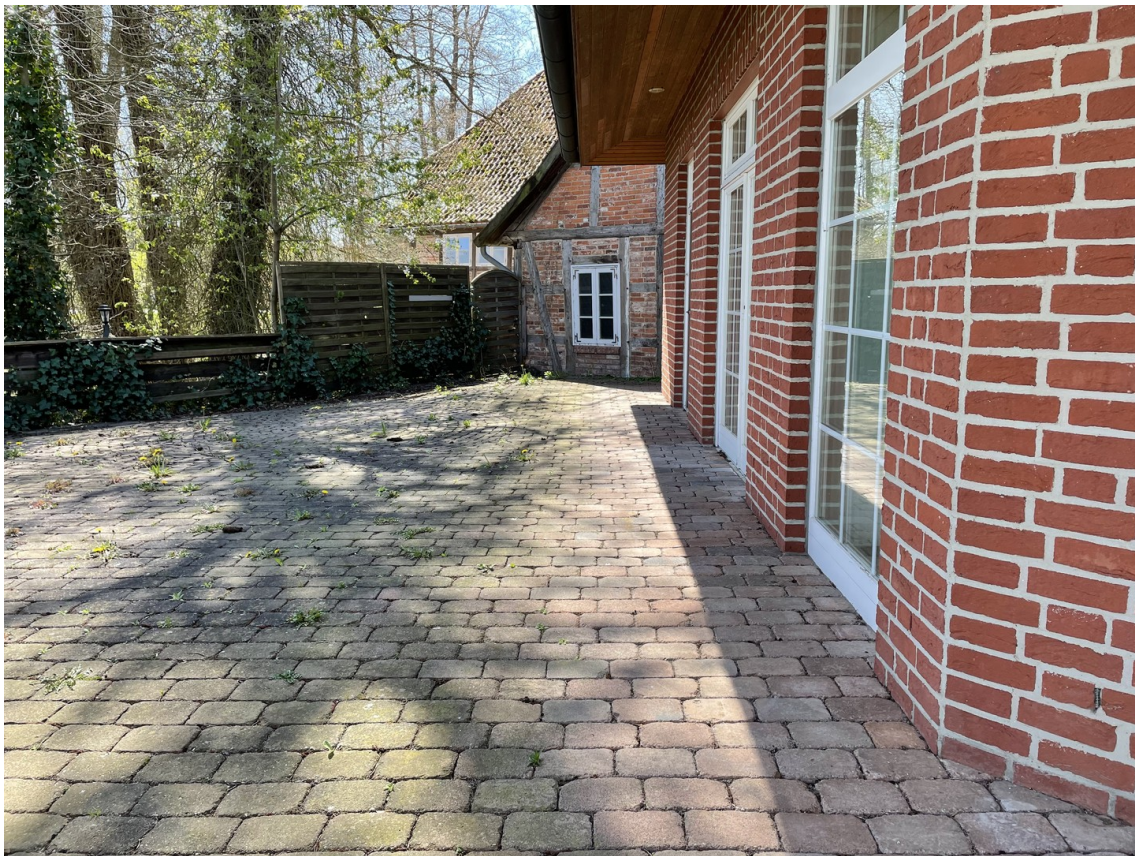
Terrasse zur Alpe