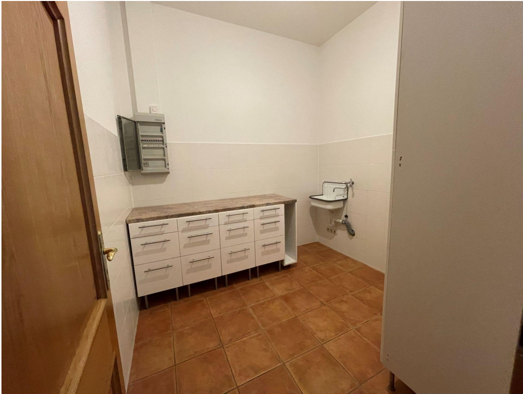
HWR mit Möbel