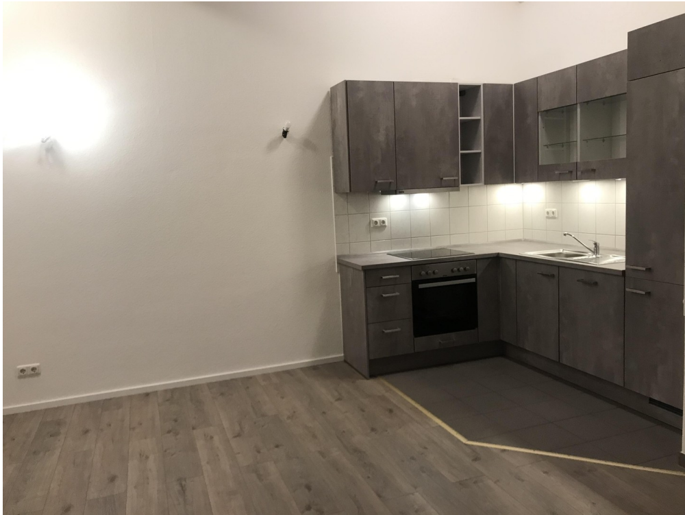
Die Küche und Essbereich