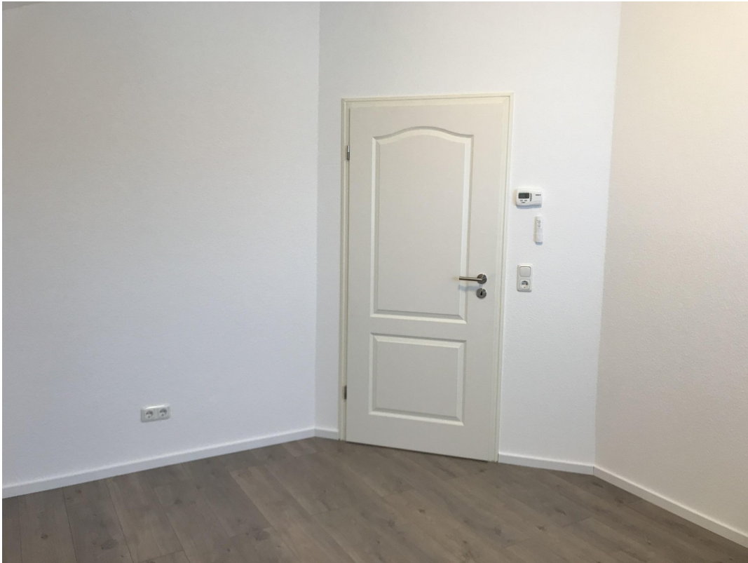
Ausschnitt Zimmer 02