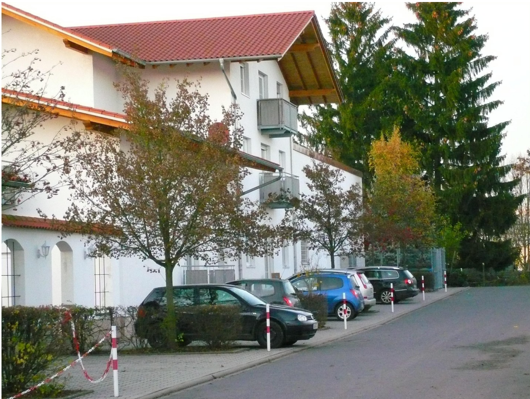
Ansicht mit der eigenen Straße