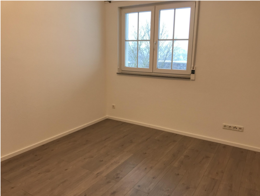
Ausschnitt Zimmer 02