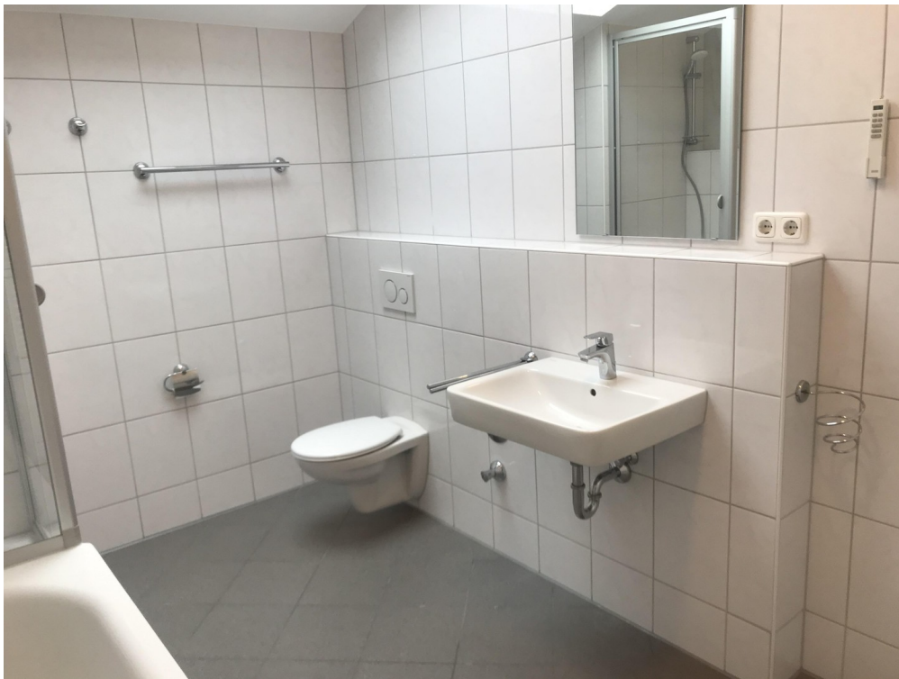
Ausschnitt des geräumigen Bads