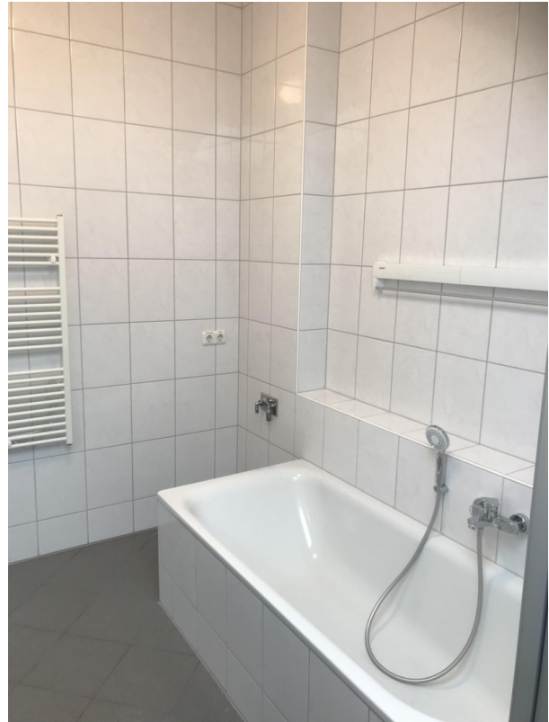
Ausschnitt des geräumigen Bads