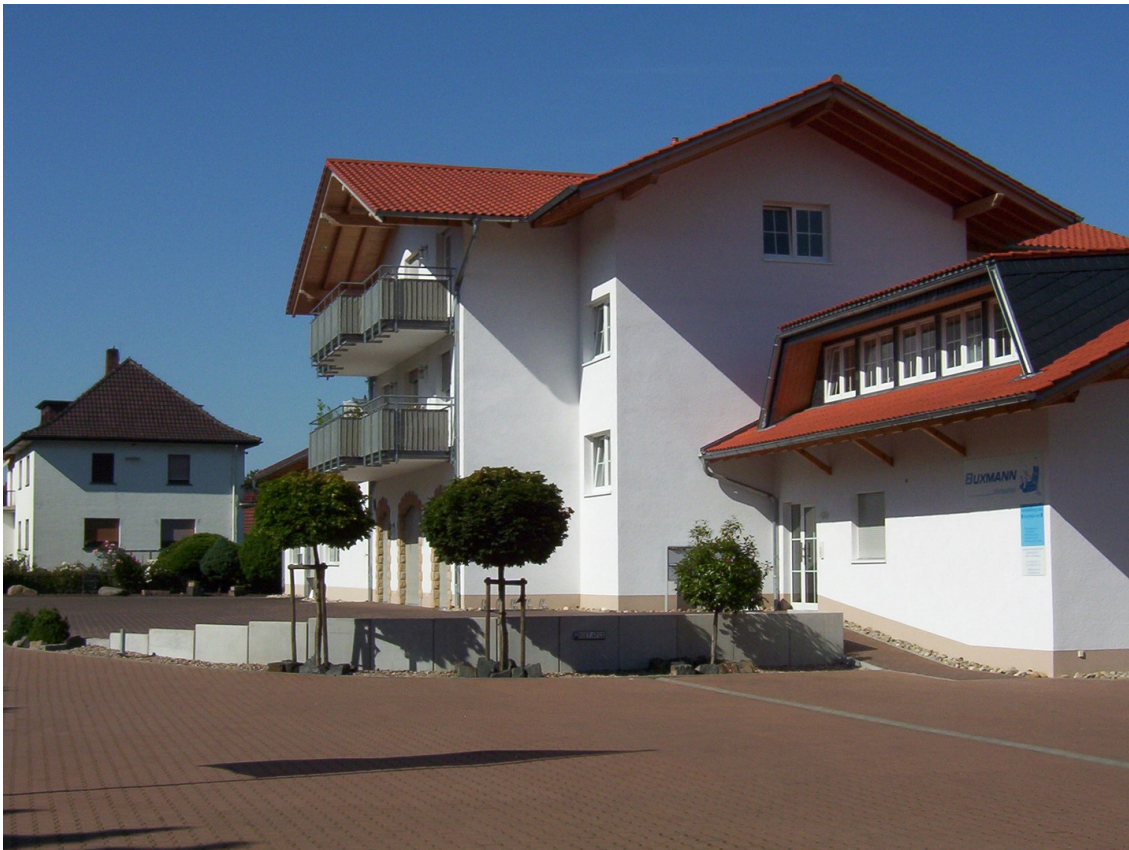
Die tolle, gepflegte Anlage