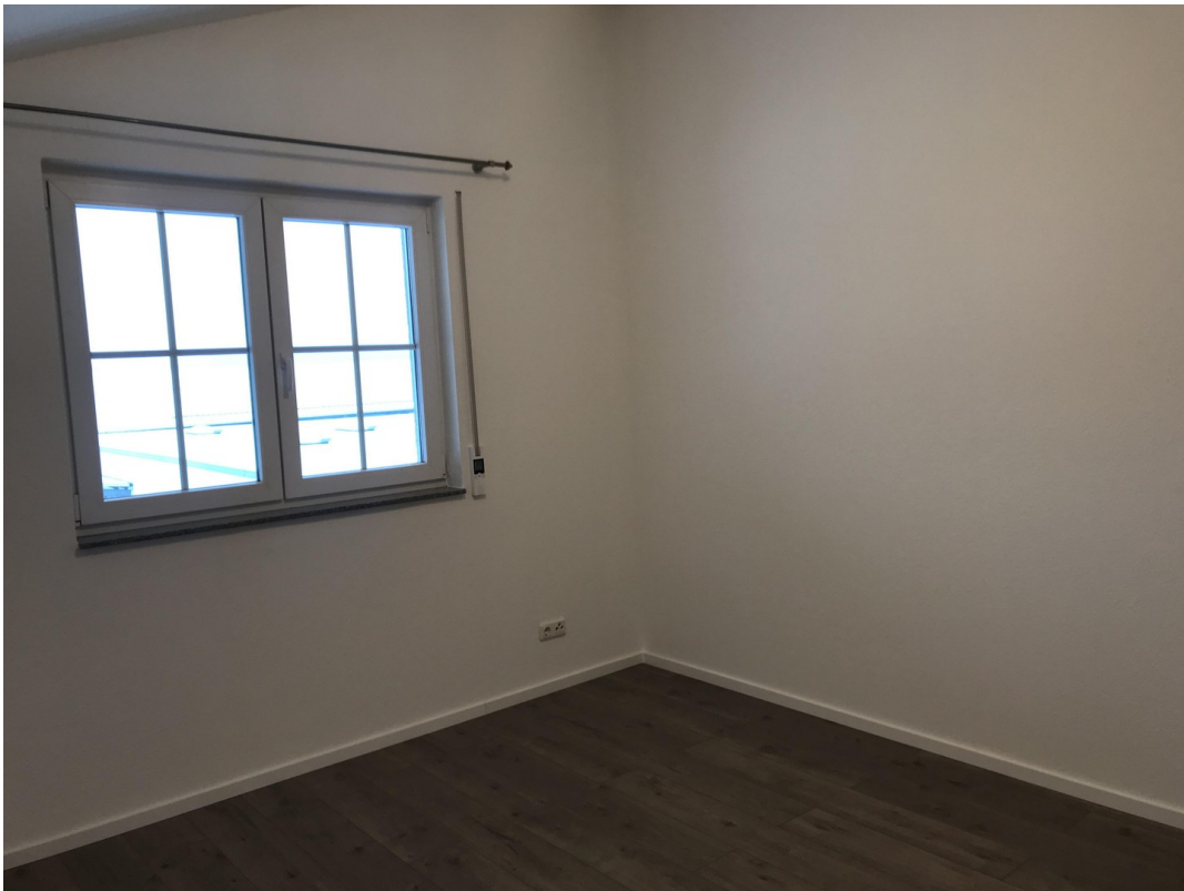
Ausschnitt Schlafzimmer 01