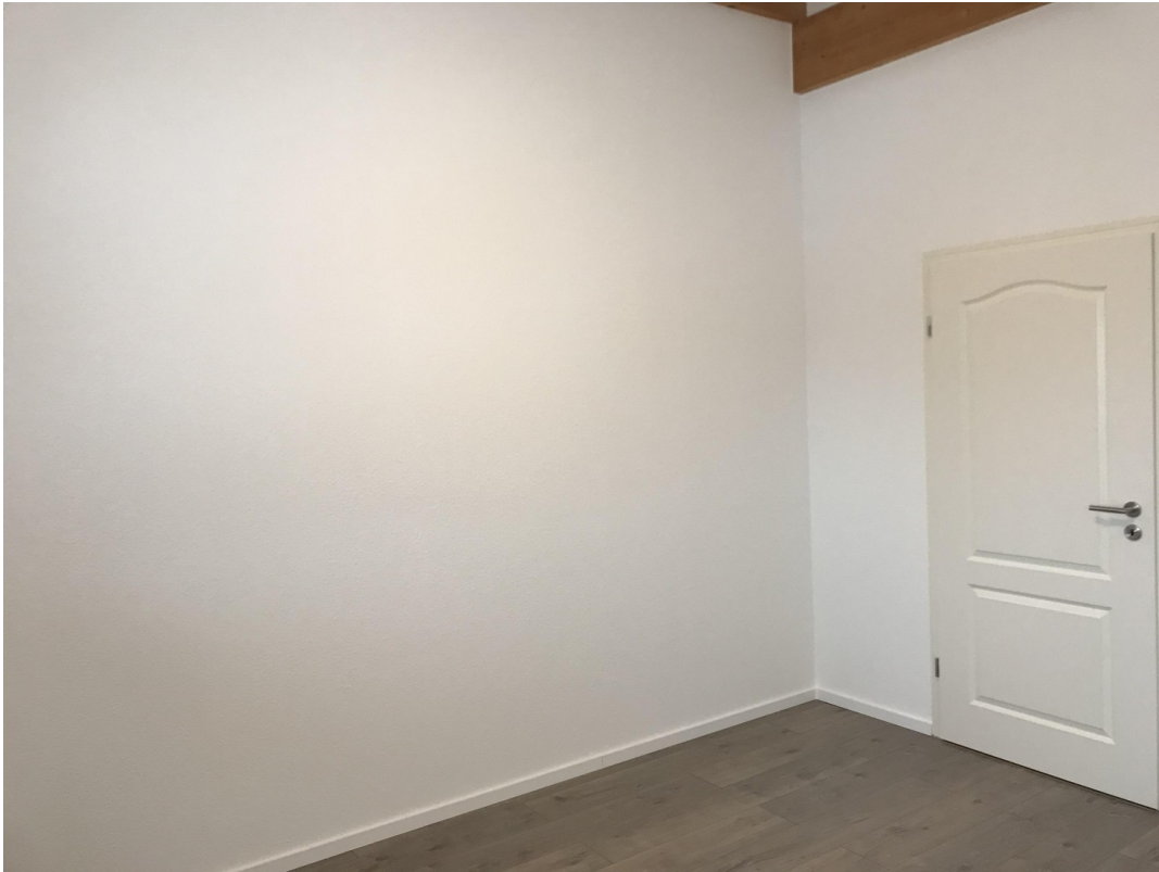
Ausschnitt Schlafzimmer 01