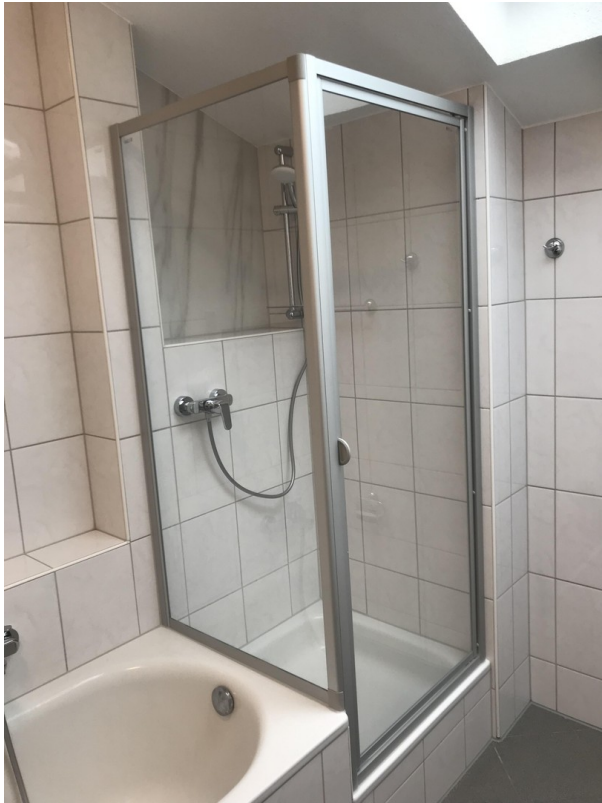
Ausschnitt des geräumigen Bads