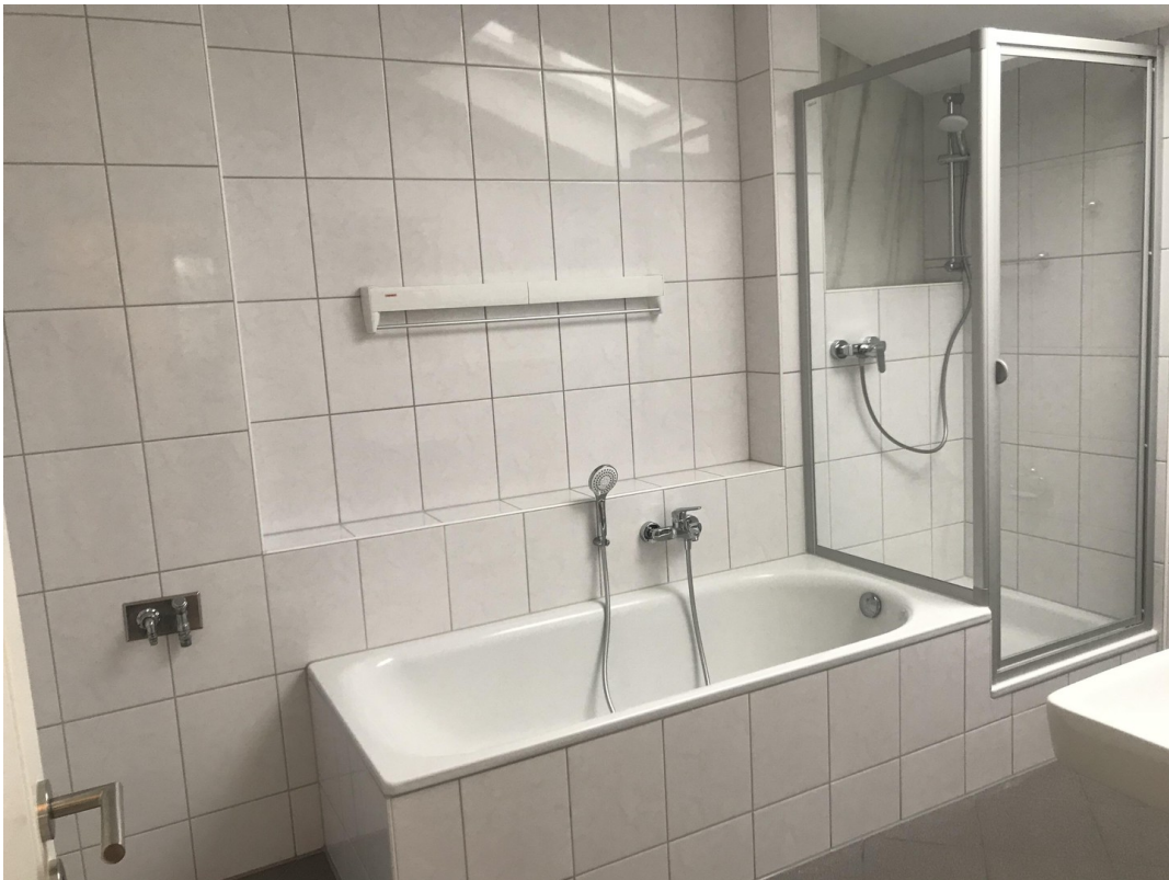
Ausschnitt des geräumigen Bads