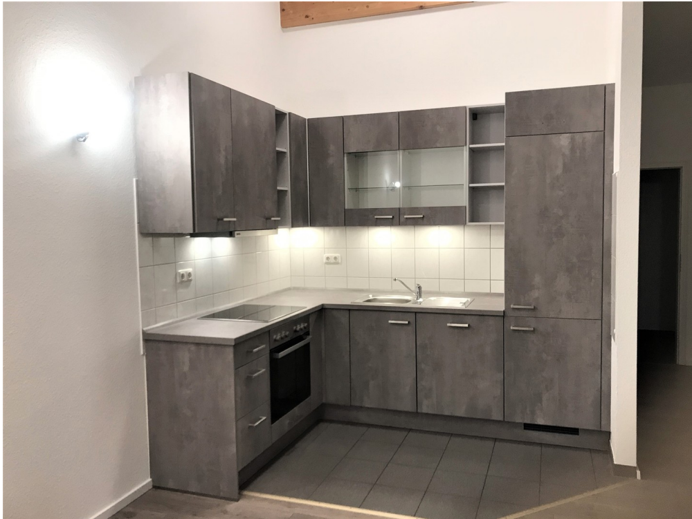
Die moderne Küche