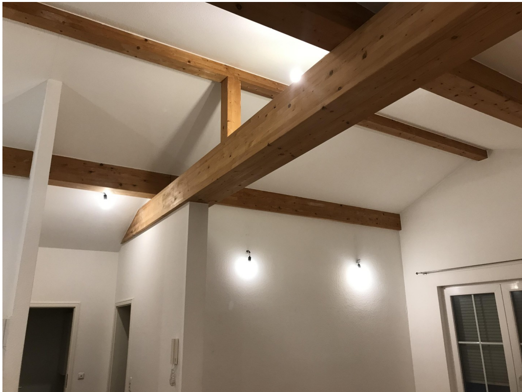
Welch ein Anblick