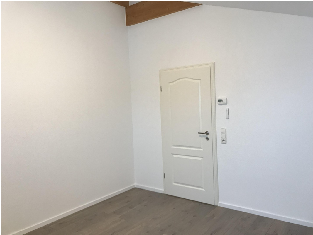
Ausschnitt Schlafzimmer 01