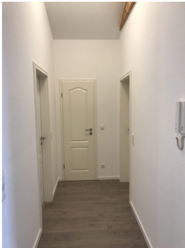
Flur Bad und Schlafzimmer