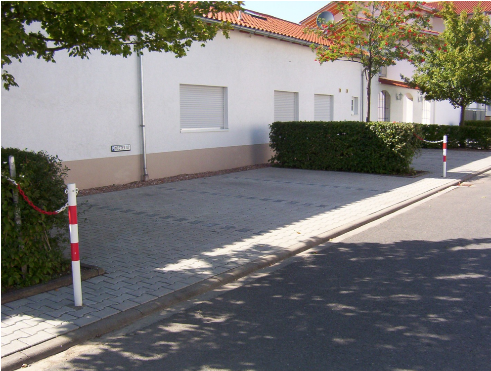
Ihre 4 Parkplätze