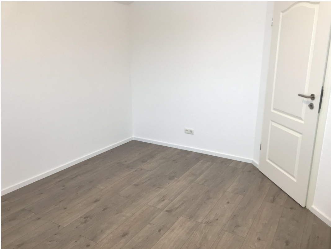
Ausschnitt Zimmer 02