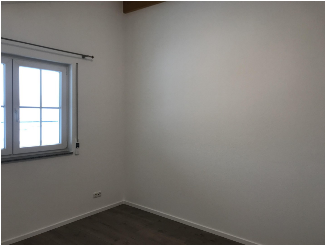
Ausschnitt Schlafzimmer 01