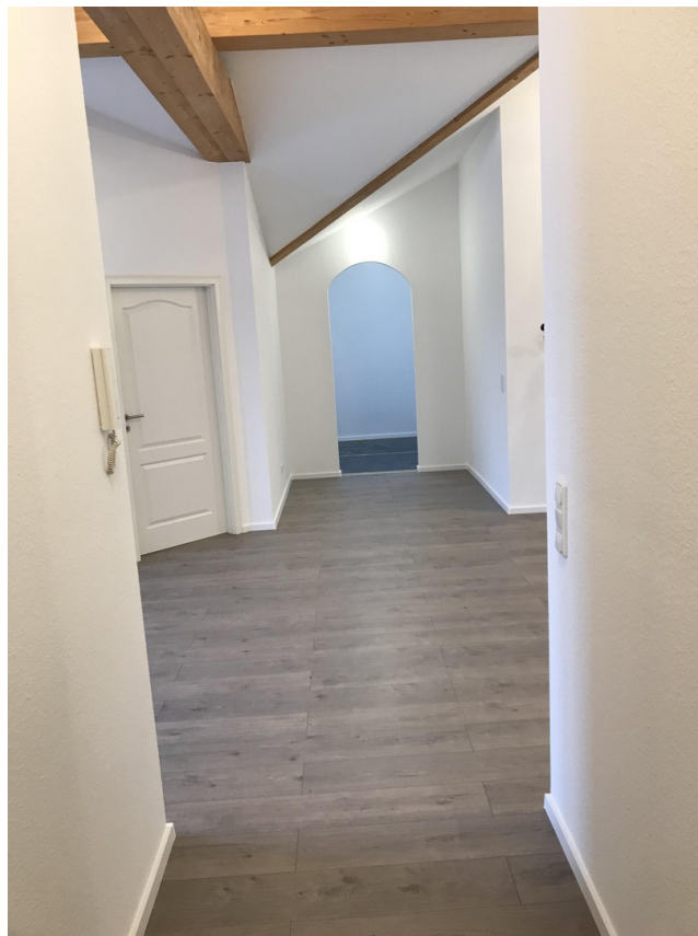
Flur zum Wohnbereich