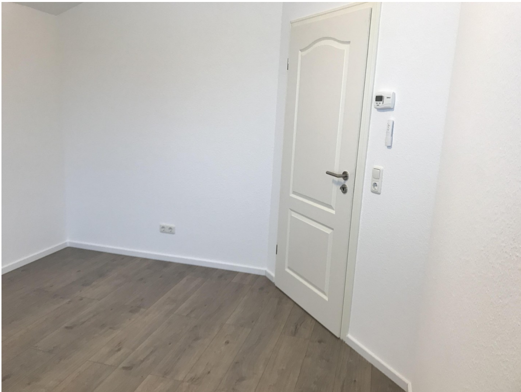
Ausschnitt Zimmer 02