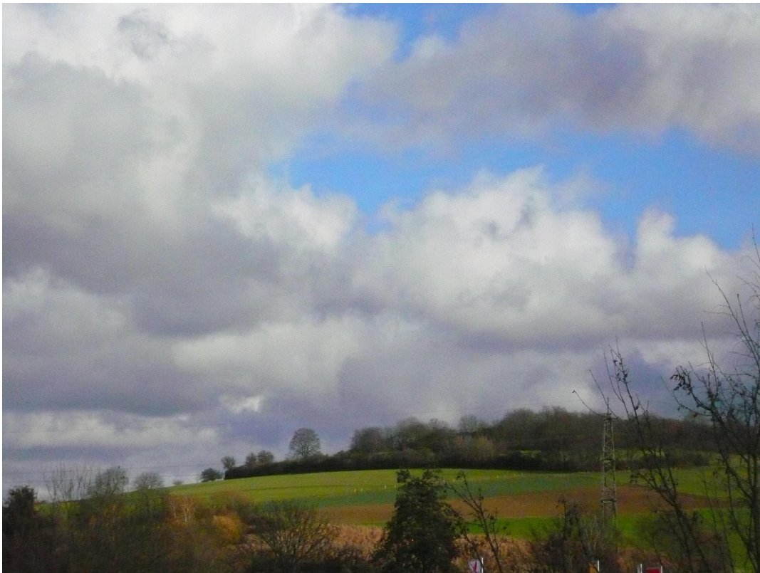
Die Sicht vom Balkon