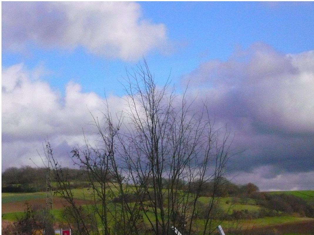
Die Sicht vom Balkon