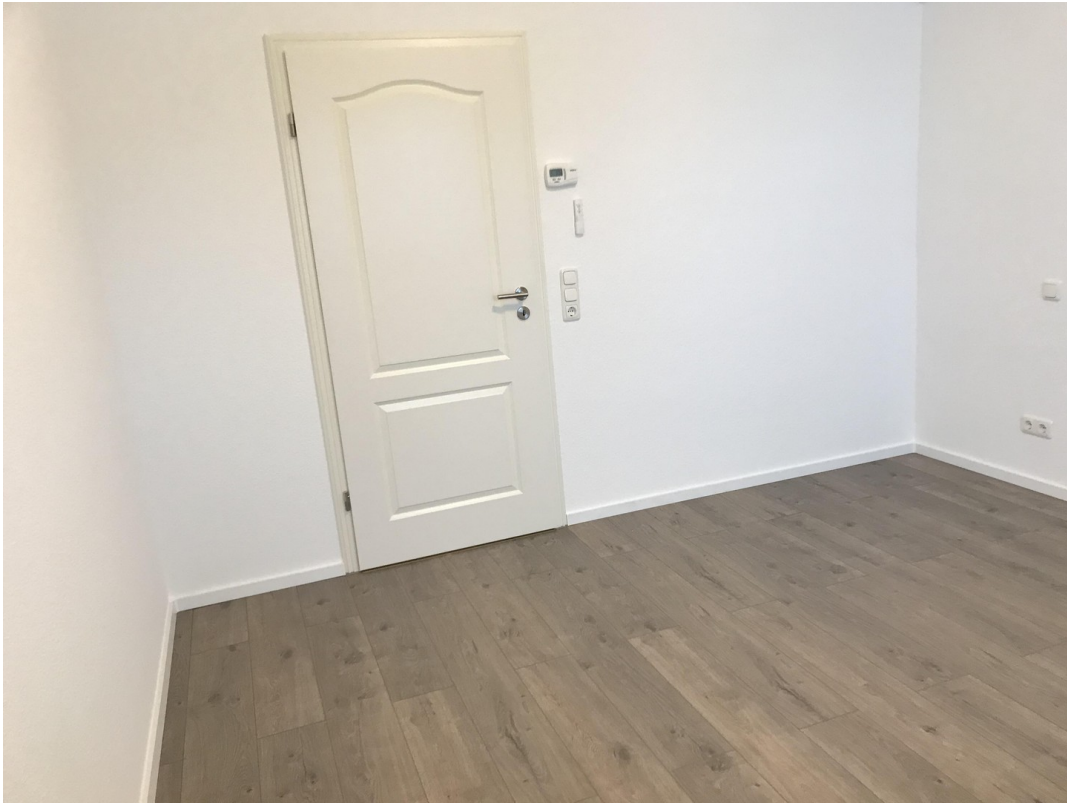
Ausschnitt Schlafzimmer 01