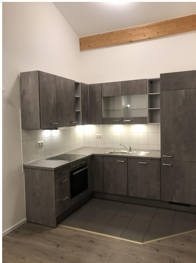
Die moderne Küche