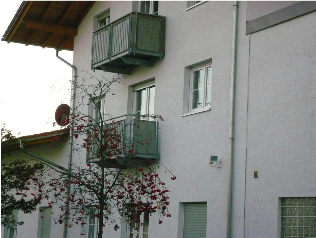
Ansicht von hinten