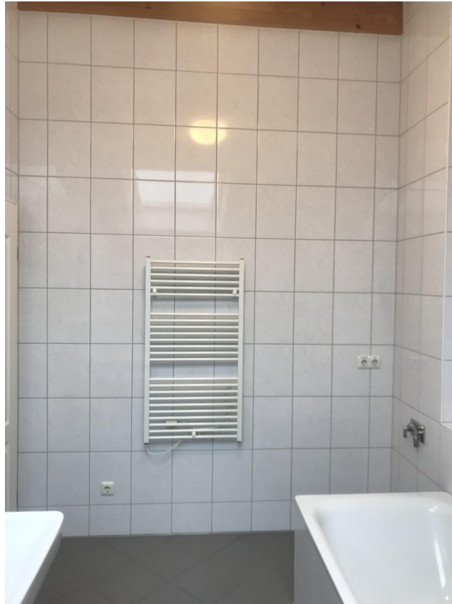
Ausschnitt des geräumigen Bads