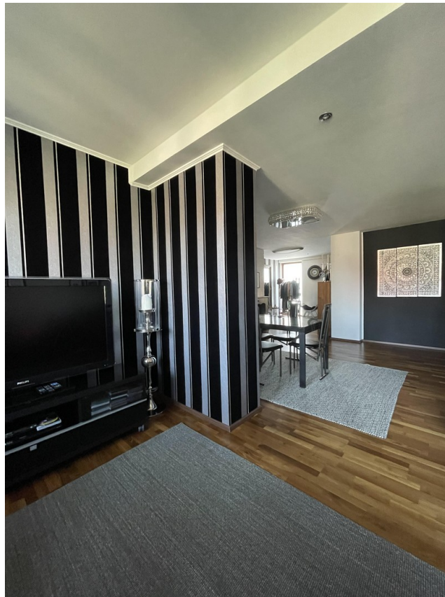
EG Ess- und Wohnbereich