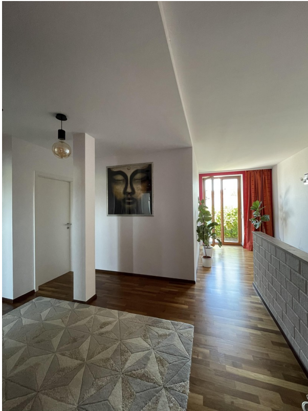
OG Flur mit den Balkon