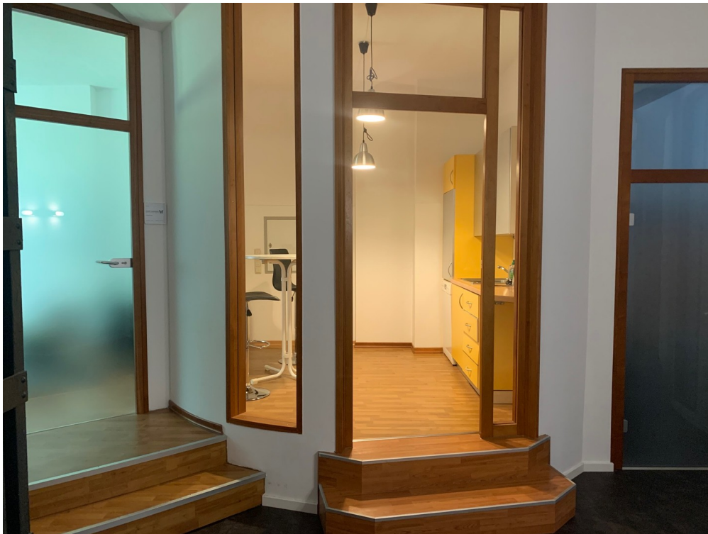
Flurblick zur Küche