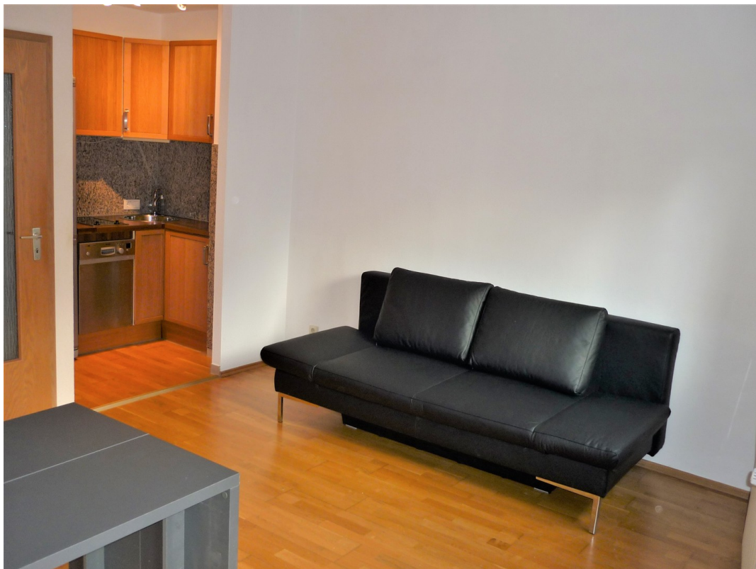
Wohnzimmer Blick auf EBK