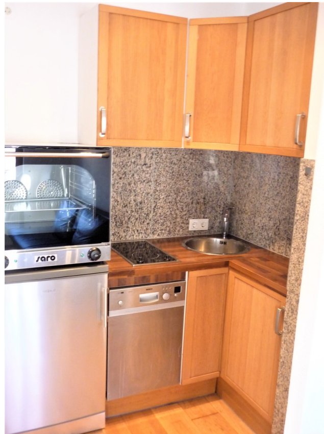
EBK mit Granitrück/seitenwand