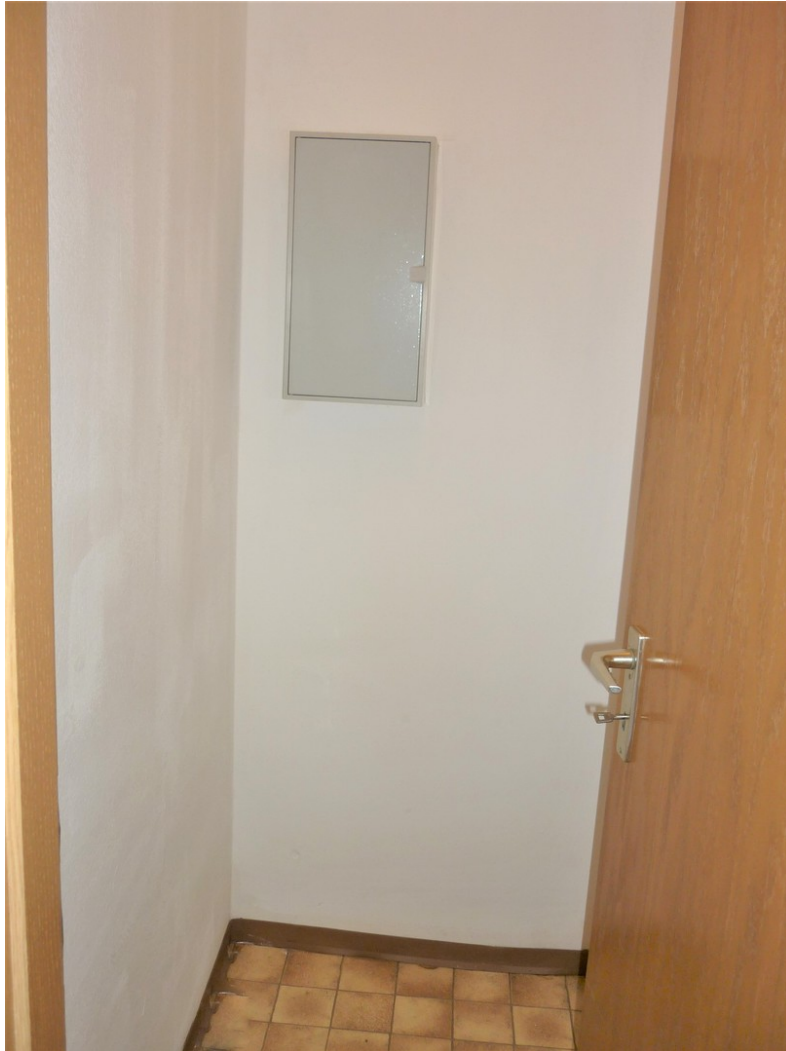
nutzb als begehb.Kleiderschrk