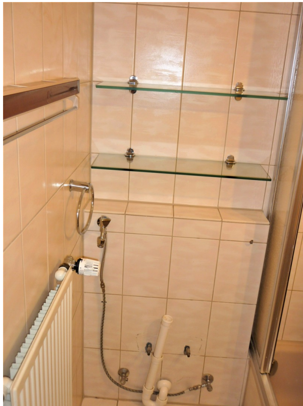
Platz f. Waschmaschine