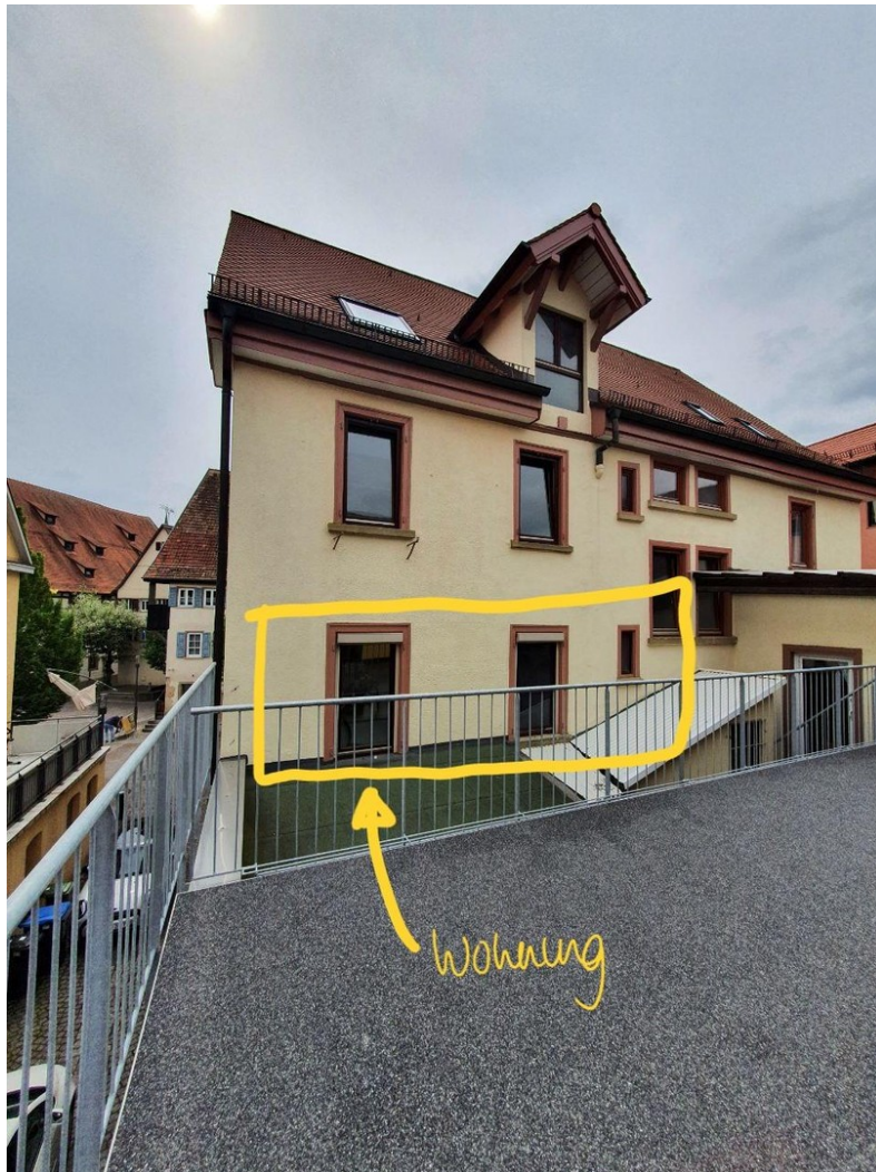
Blick von der Terrasse Wohnung