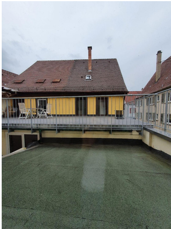
Blick Richtung Terrasse