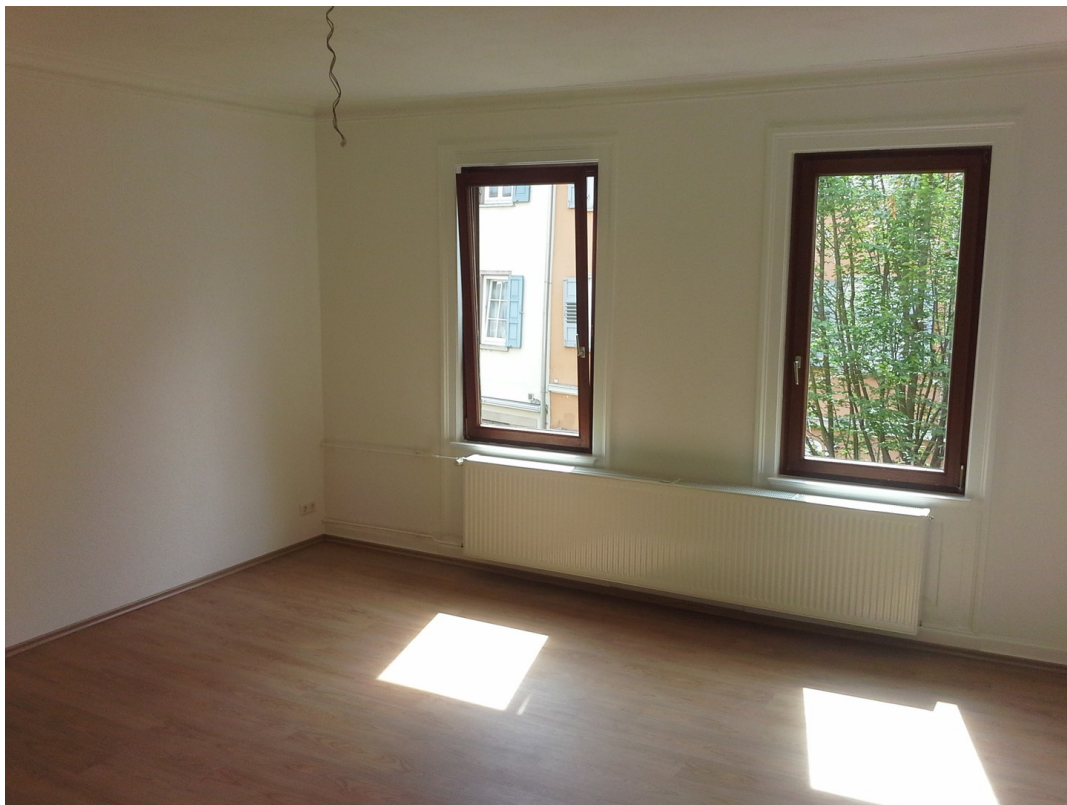
Schlafzimmer ohne Möbel