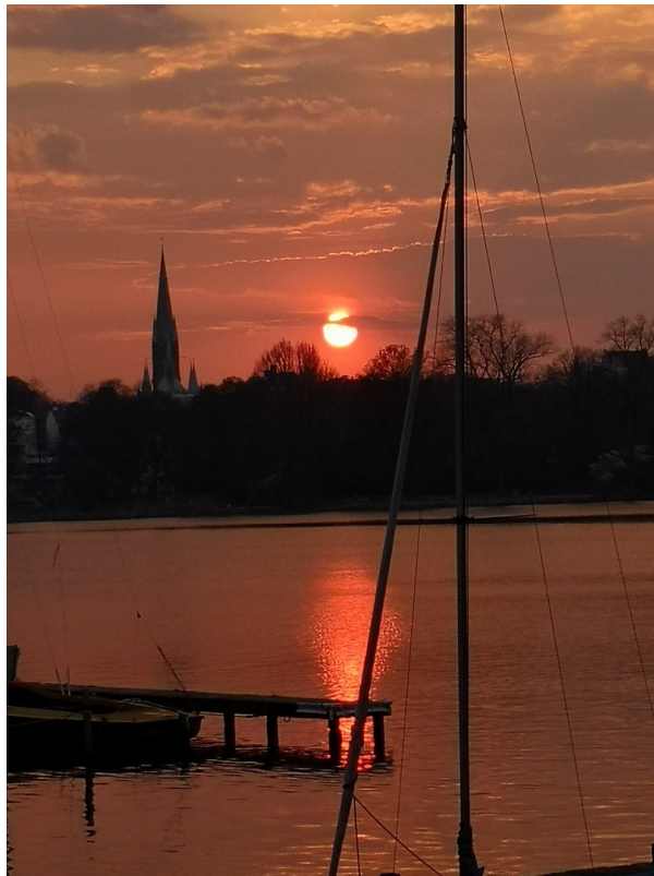
nur 800m zur Alster