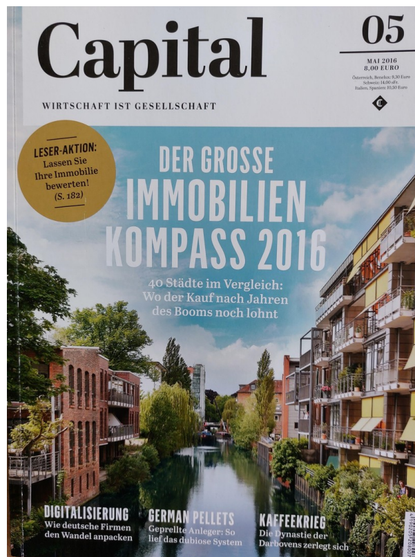
Titelseite im Capital