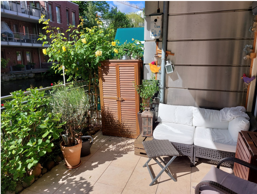
Terrasse direkt am Kanal