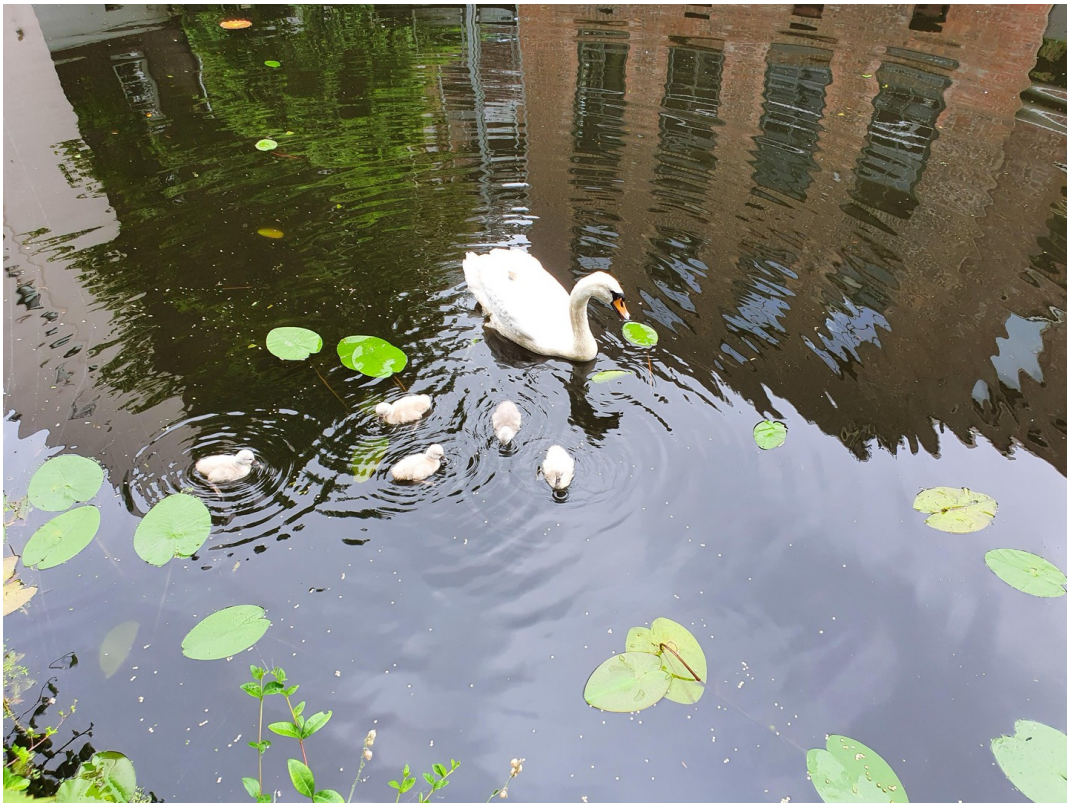
Alsterschwäne mit Jungen