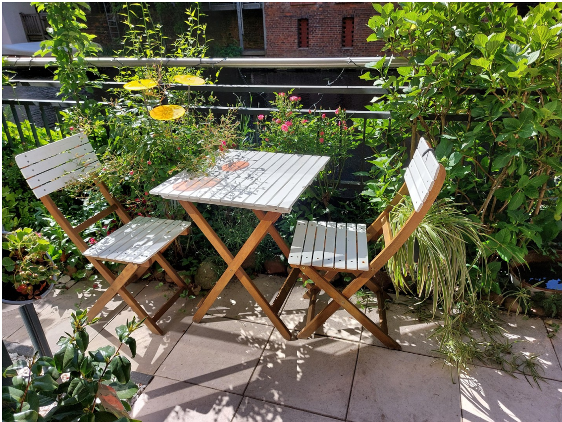
Terrasse direkt am Kanal