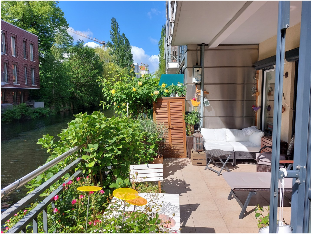
Terrasse direkt am Kanal