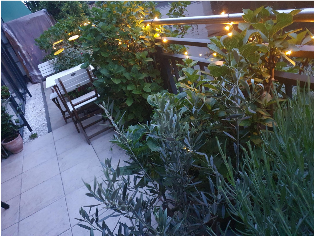
Terrasse direkt am Kanal