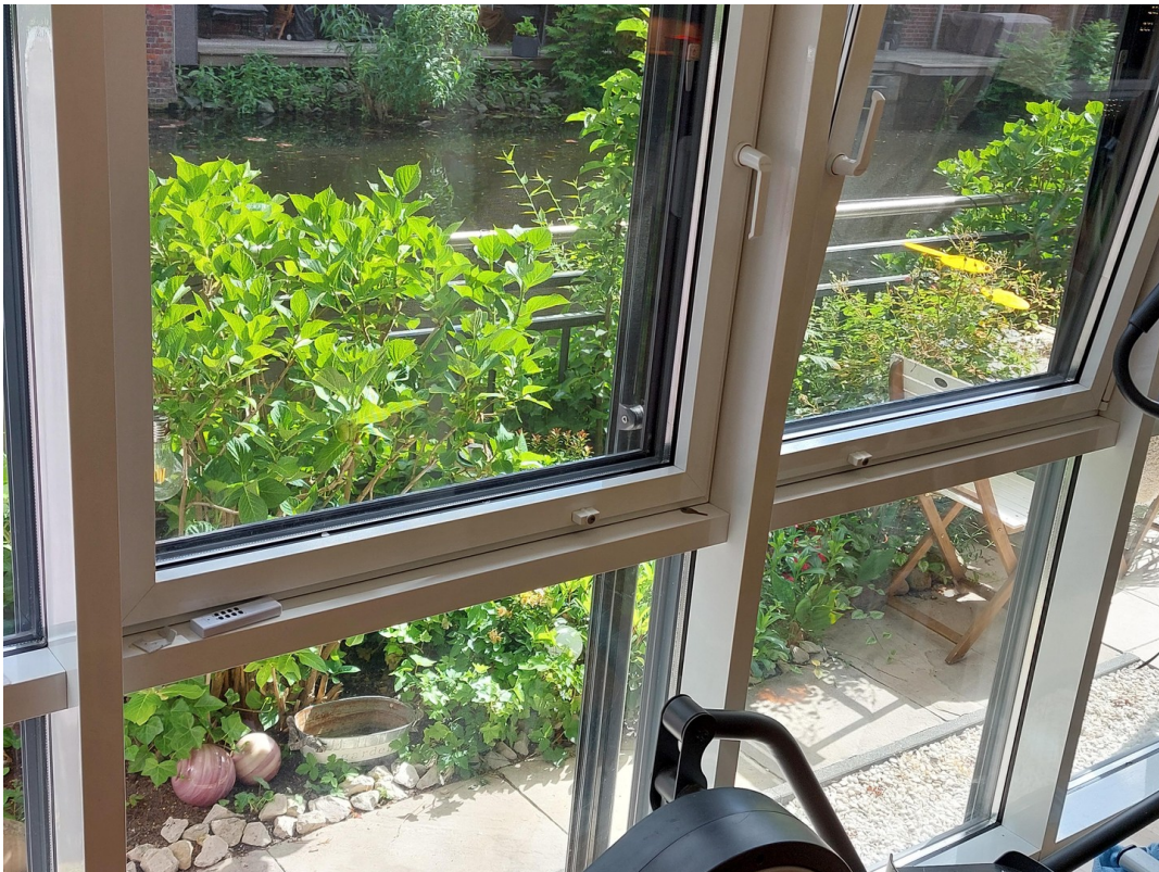
Wohnzimmer, Blick zum Kanal