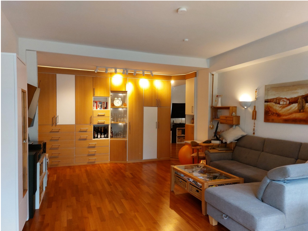
Wohnzimmer mit Einbauschränk