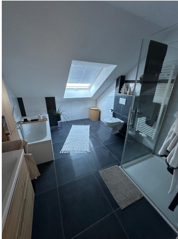
mit Dusche, Badewanne, WC