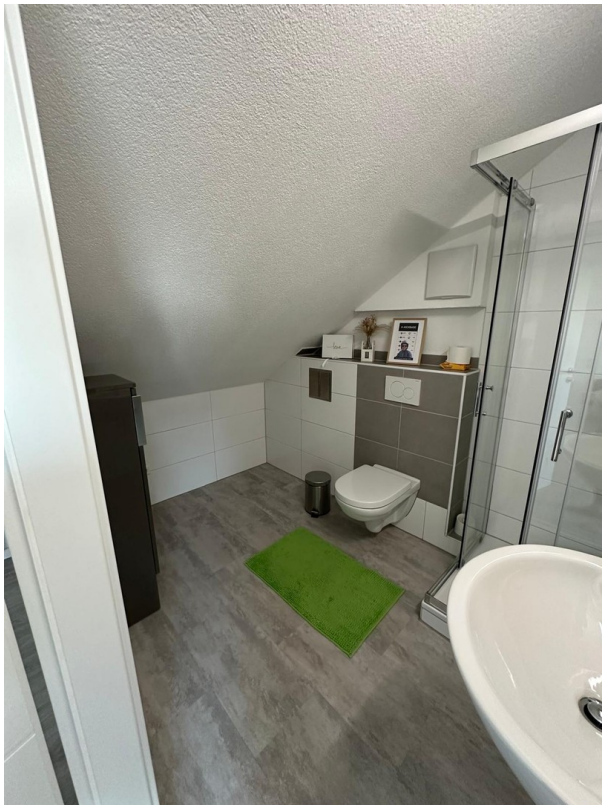
Dusch-WC oben beim Studio