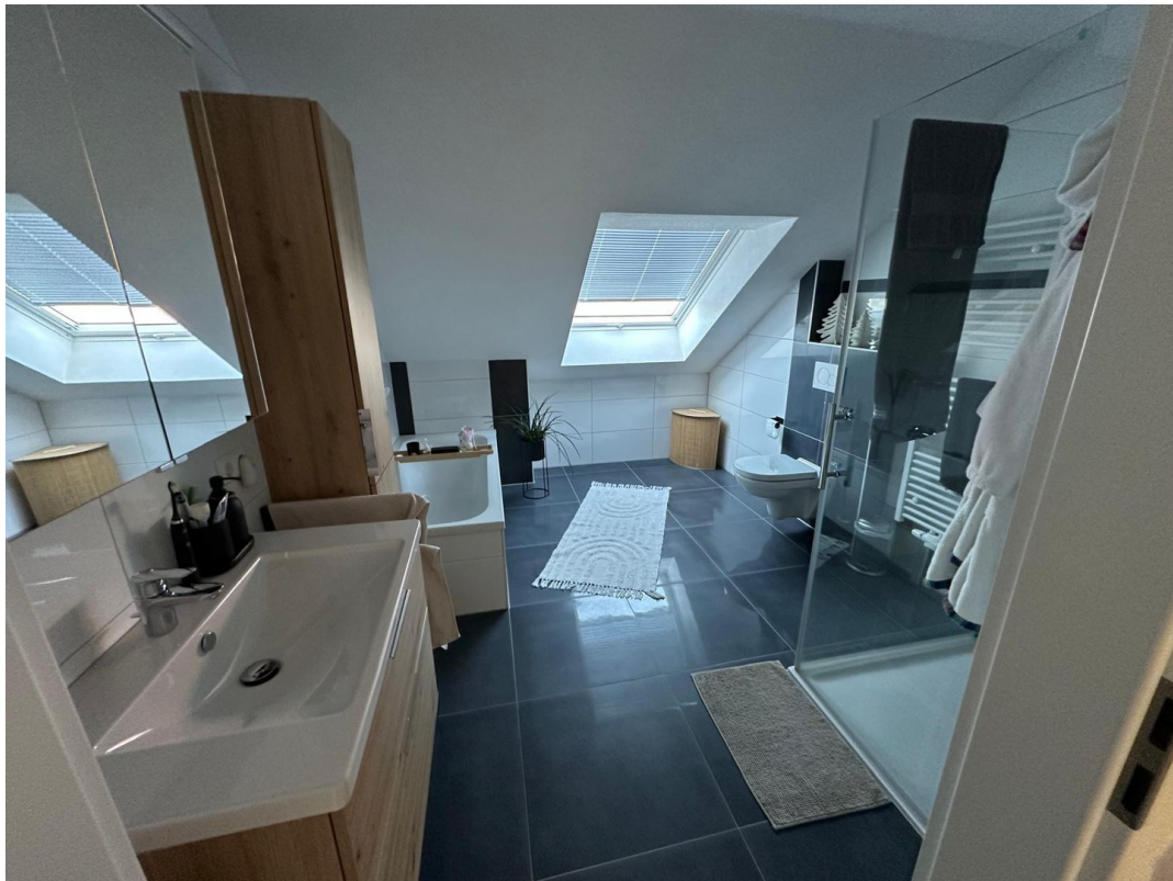
Großes Tageslicht-Bad unten