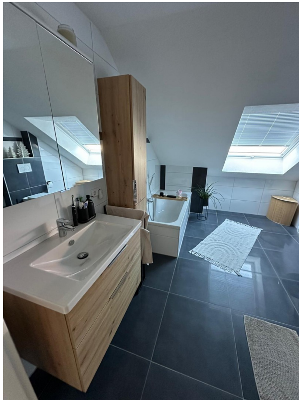
Spiegel- u. Badschränke