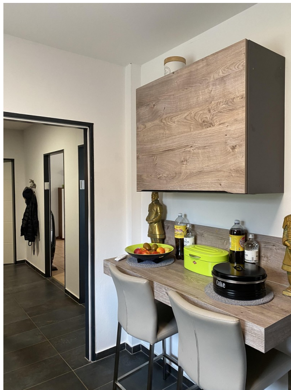
Küche kleiner Essbereich