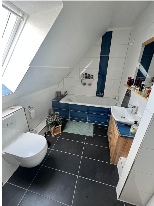
Neues Wannenbad Obergeschoss