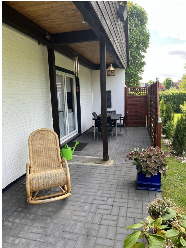
Blick erste Terrasse