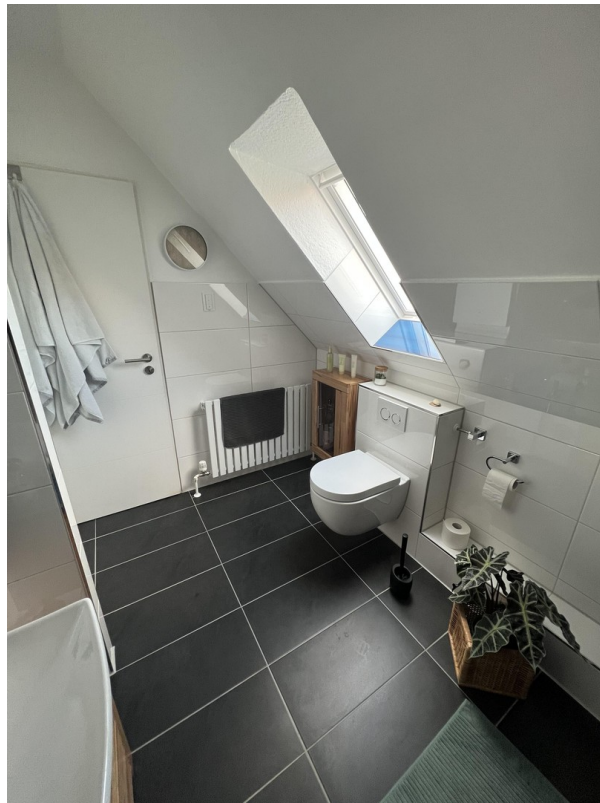
Neues Wannbad Obergeschoss