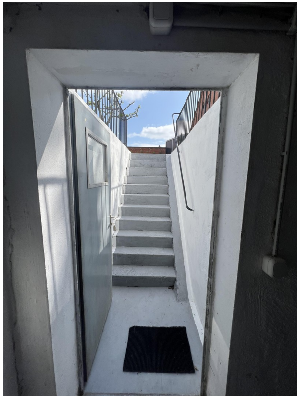
Ausgang Keller/ hinterer Garten