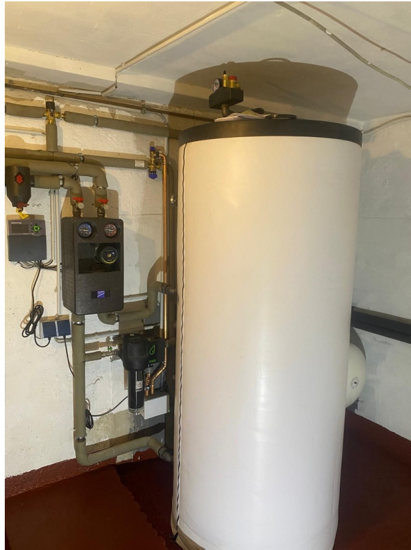
Neue Heizungsanlage/ Fernwärme