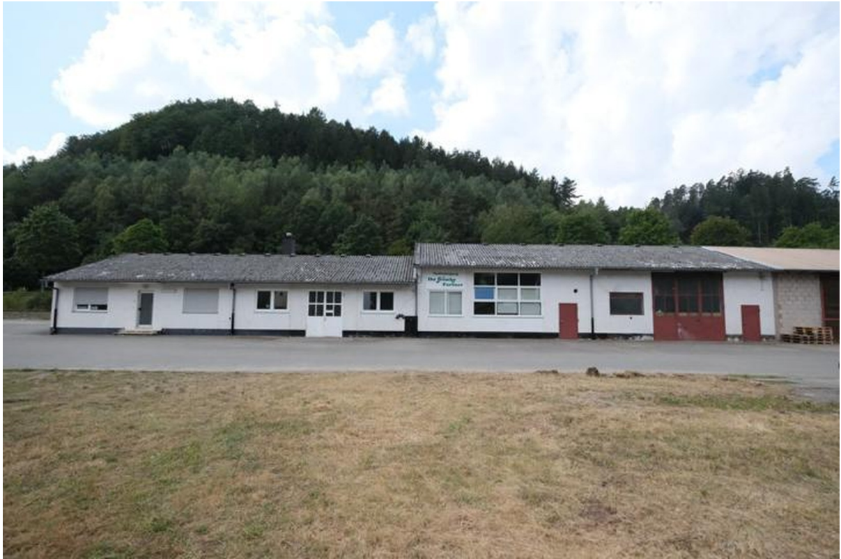
Gebäude mit weiteren Hallen