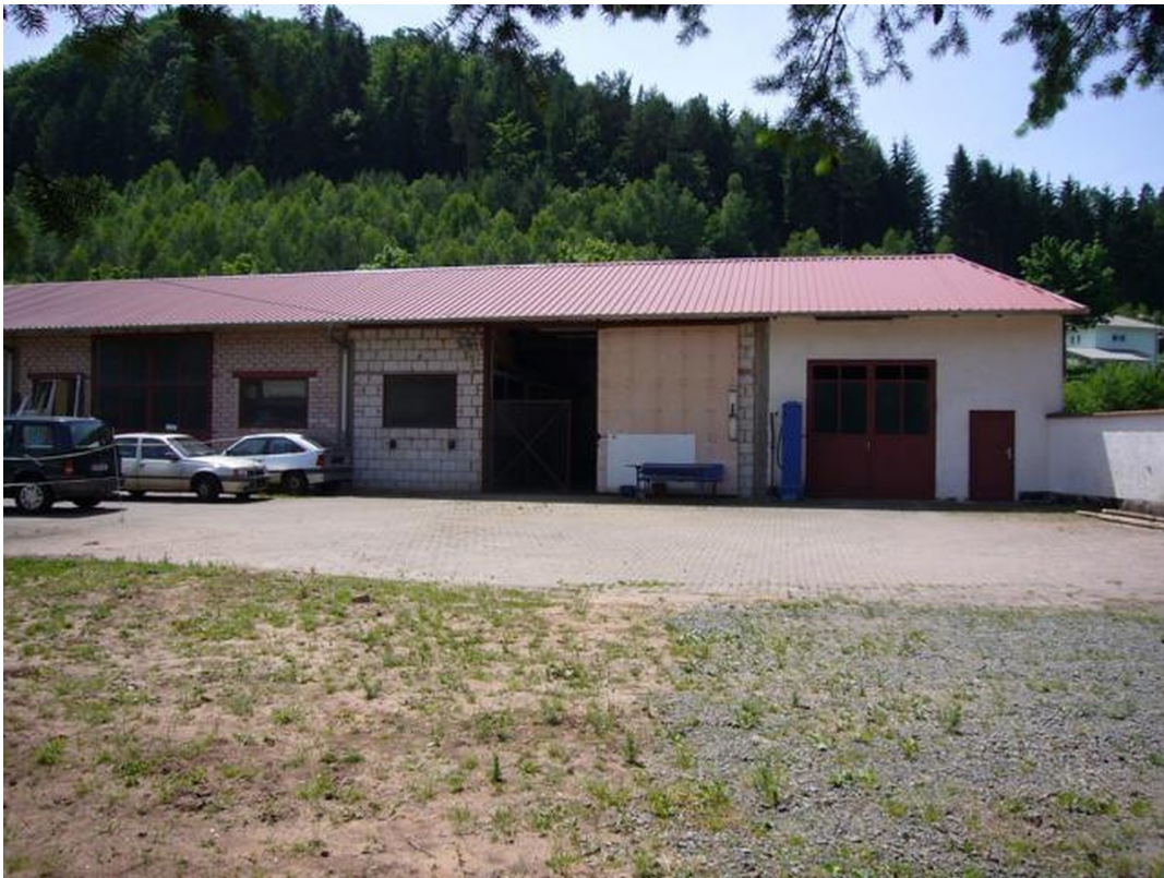
hinterer Teil des Gebäudekompl