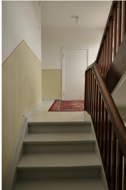
Treppe zum 1.OG