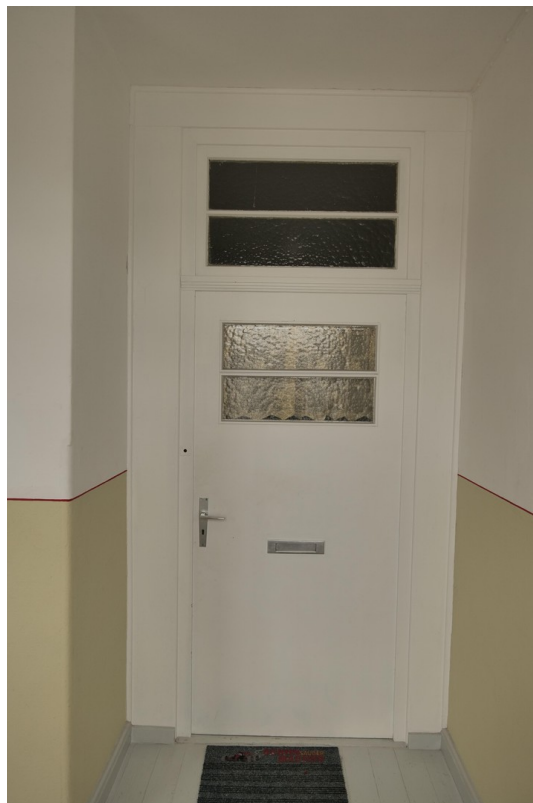
Tür zur Wohnung 1.OG