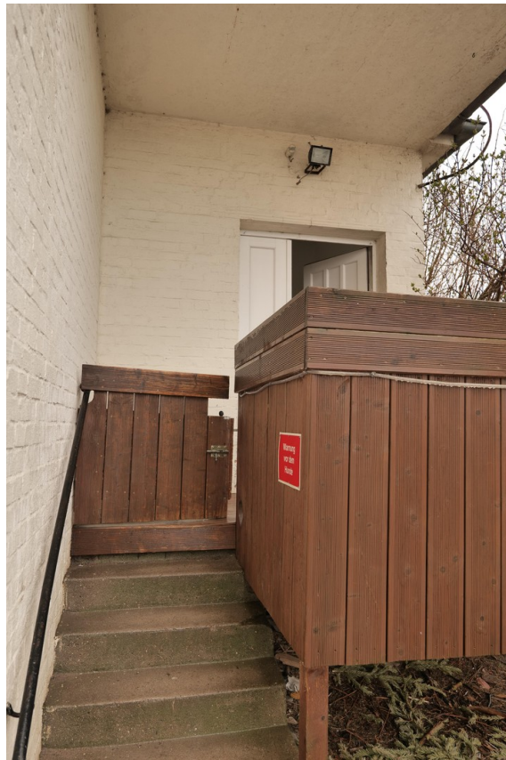
Zugang Loft Hinterhof