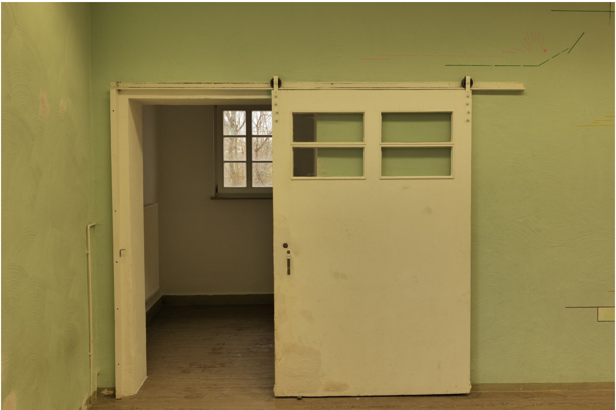
Ausgang Loft Hinterhof