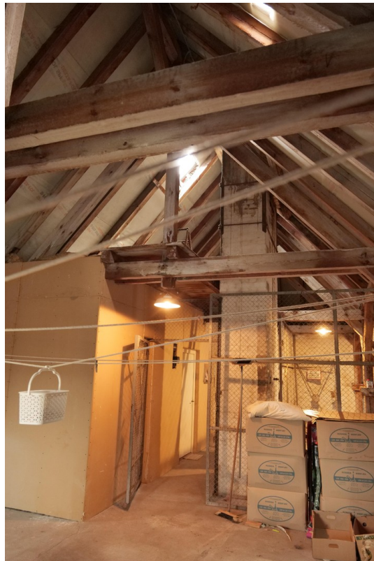
Dachboden mit 2 Räumen