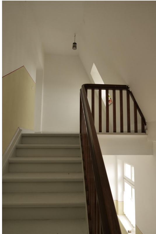
Teppe zum Dachboden