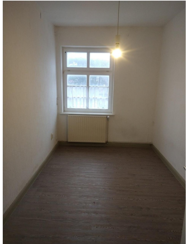
kleines Zimmer 1.OG