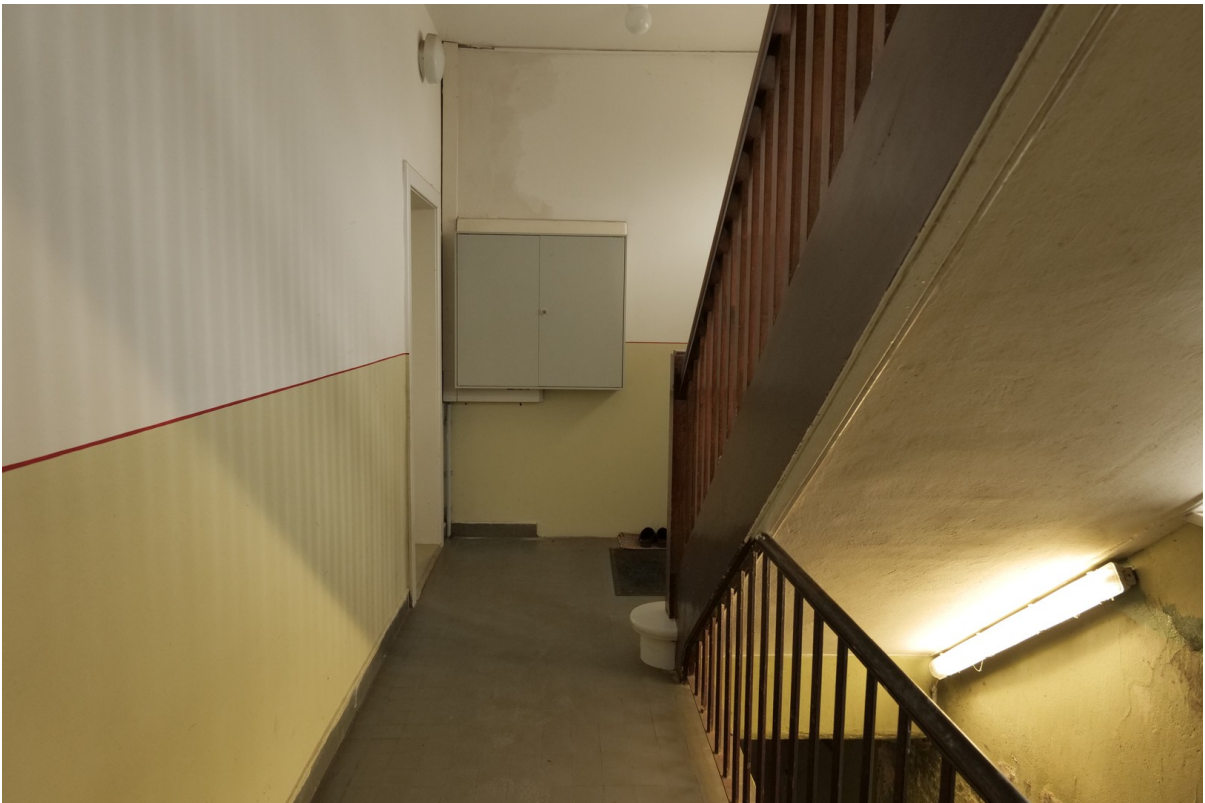
Flur mit Kellertreppe