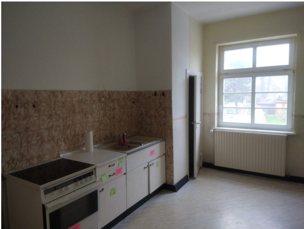
Küche Wohnung 1.OG