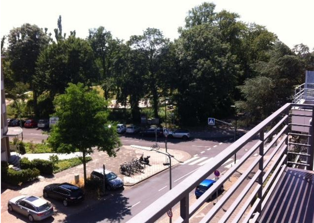
Blick Richtung Zoopark