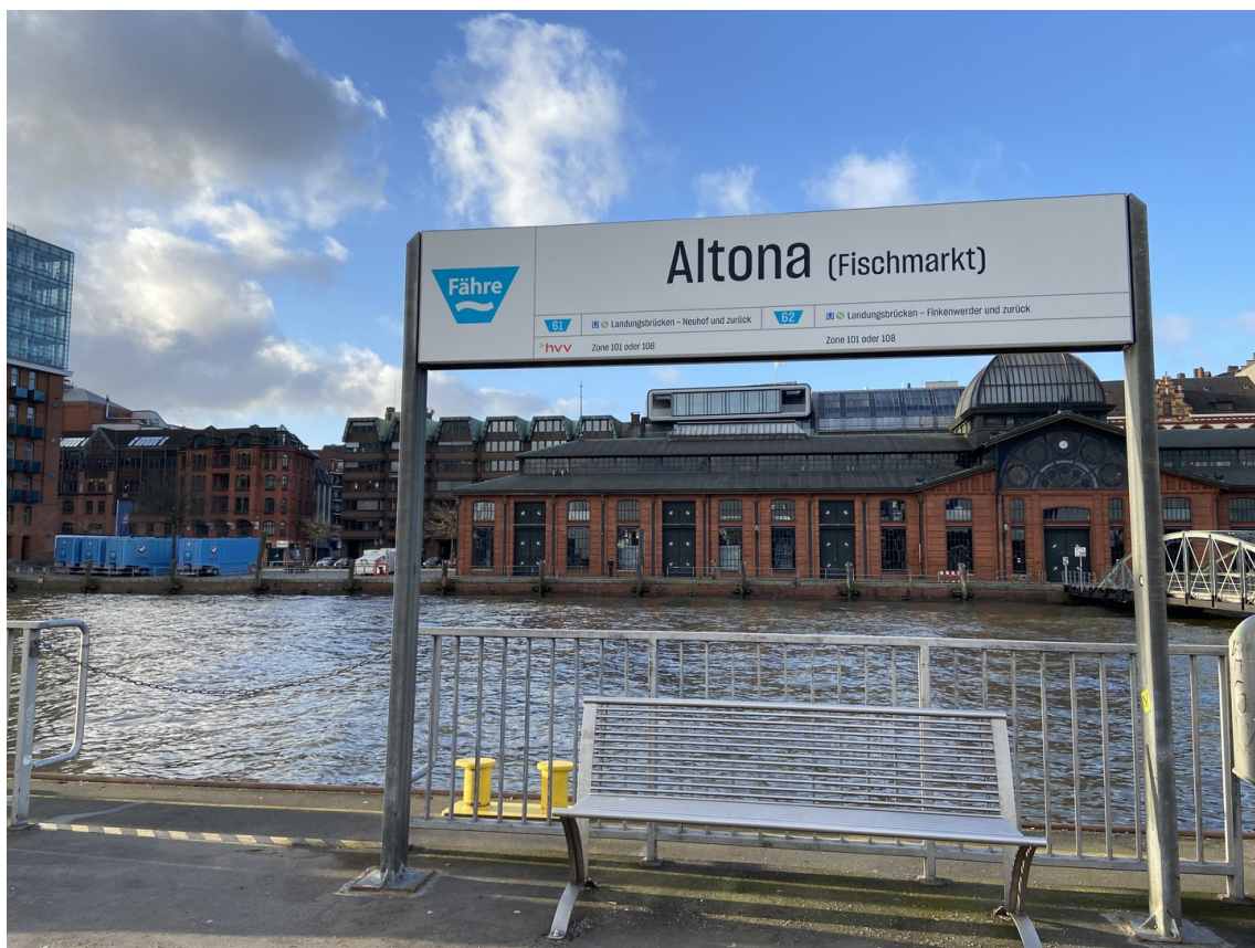
Blick vom Fähranleger