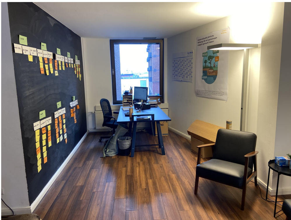
Büro 1 mit Elbblick