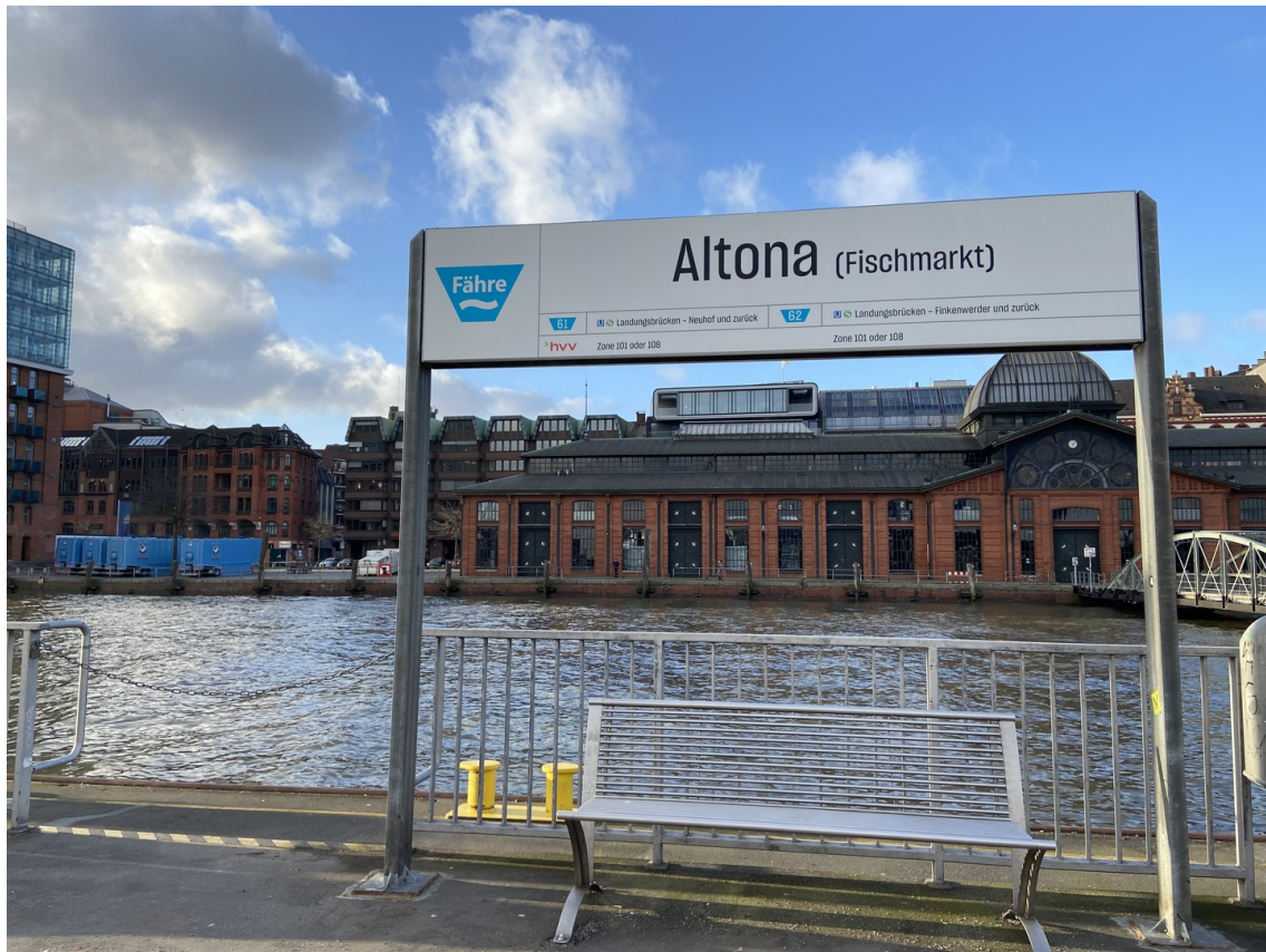
Blick vom Fähranleger