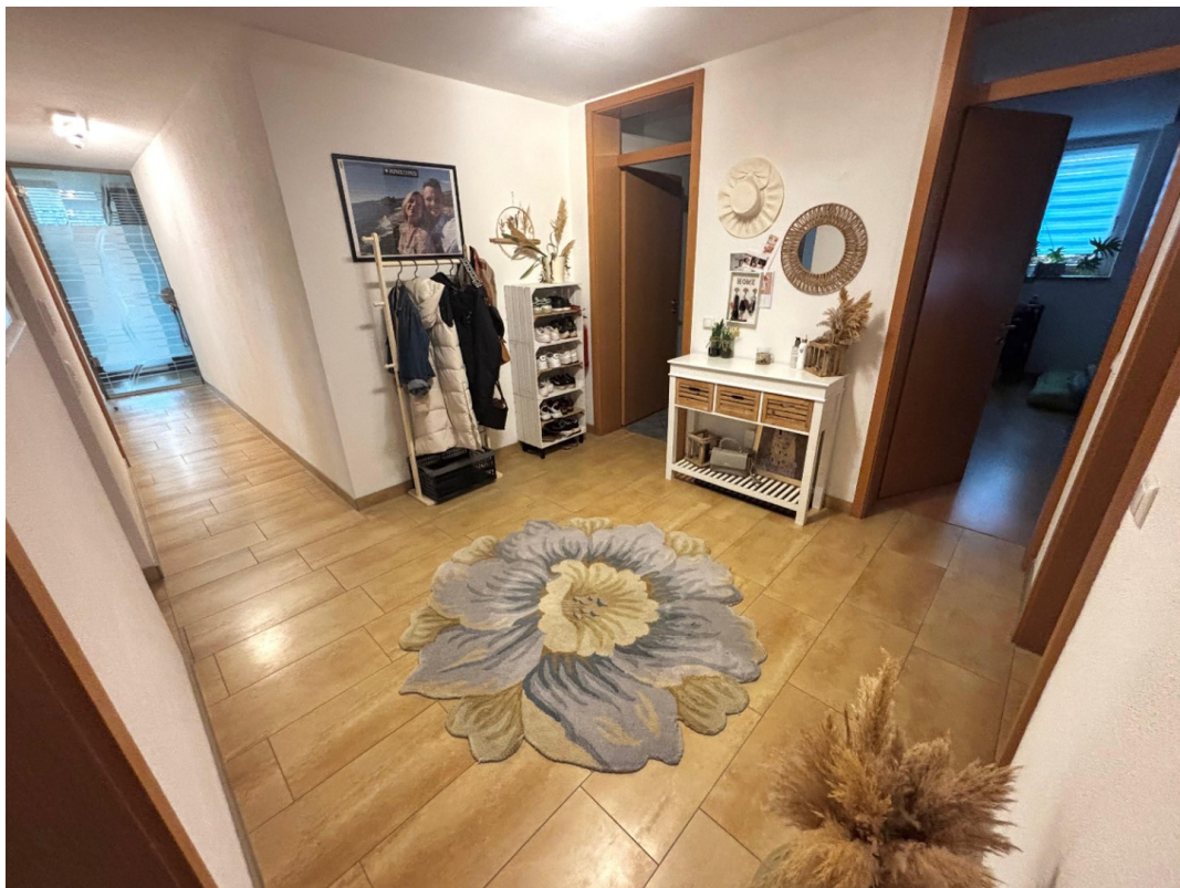
gr. Flur, viel Abstellfläche