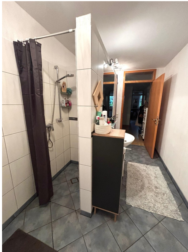
ebenerdige Dusche u.a.