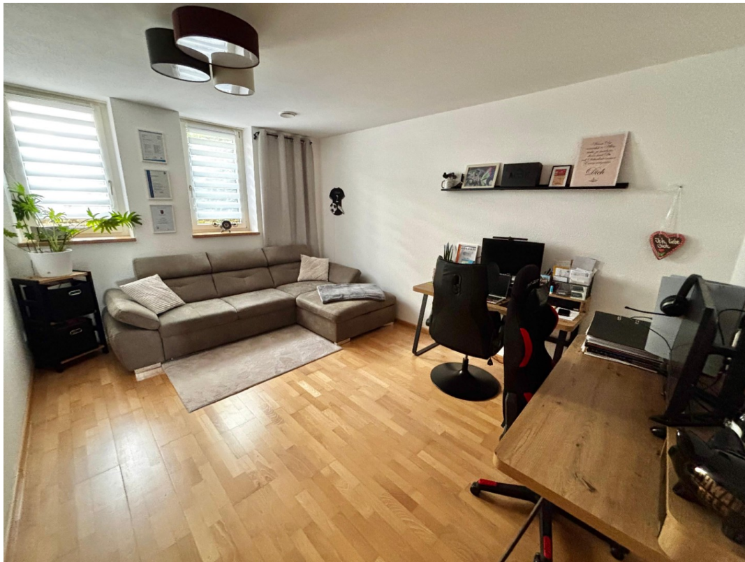
Schlafzimmer / Büro/ Gästezi.