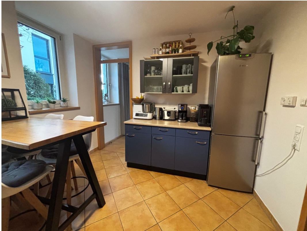
Küche m. Küchenzeile 2