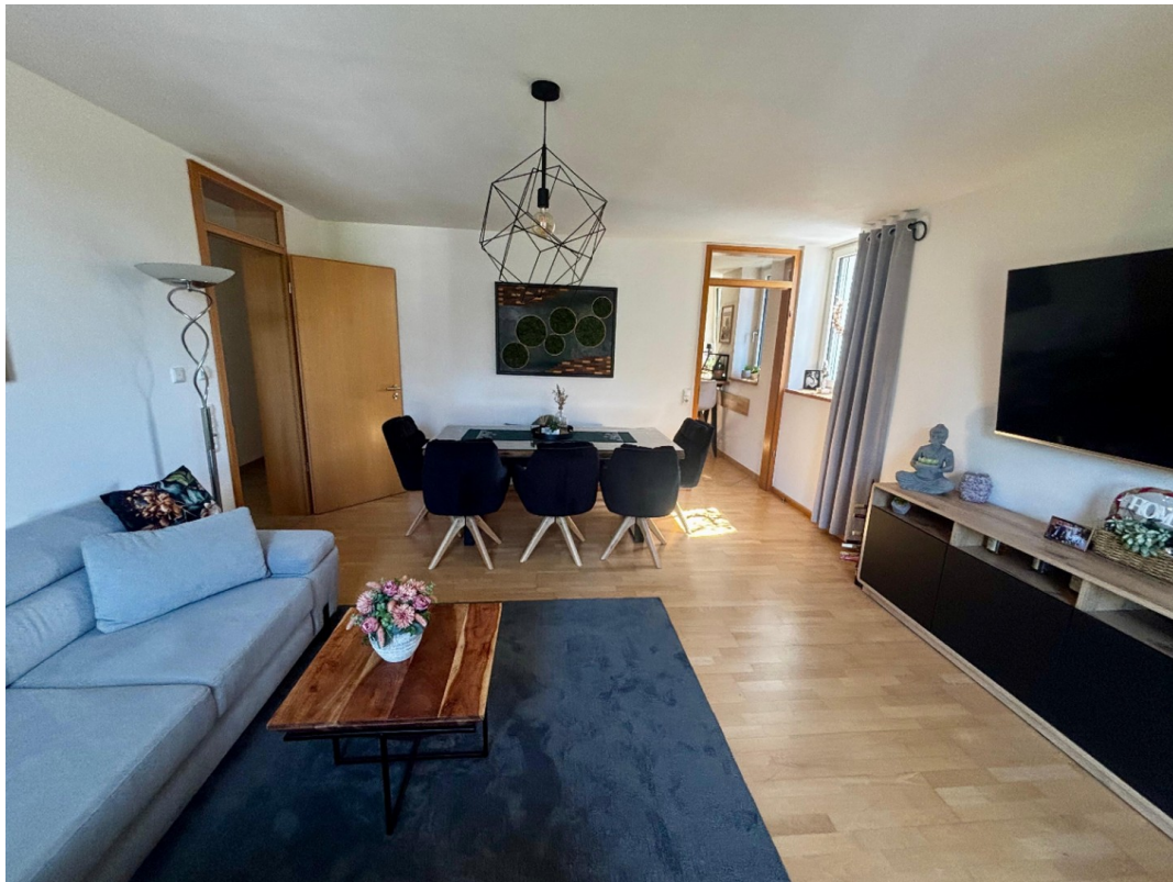
Wohn- / Eßzimmer