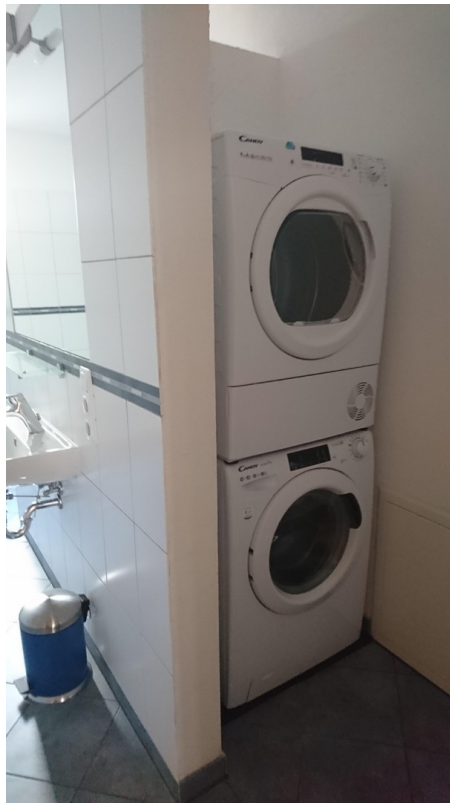
Platz Trockner, Waschmaschine