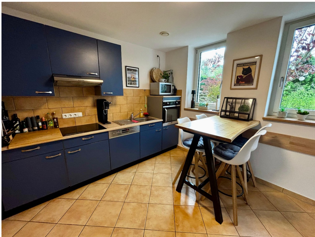
Küche m. Küchenzeile 1