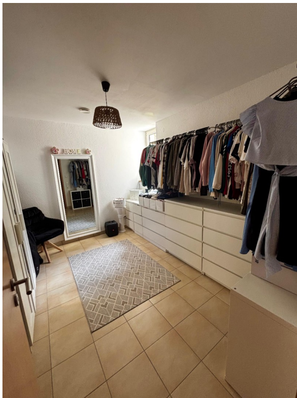
Abstellraum, genutzt Ankleide