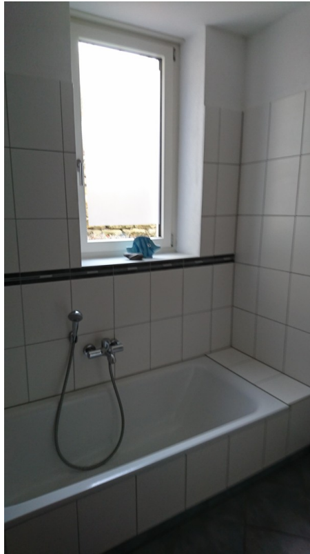
Badewanne m. Fenster