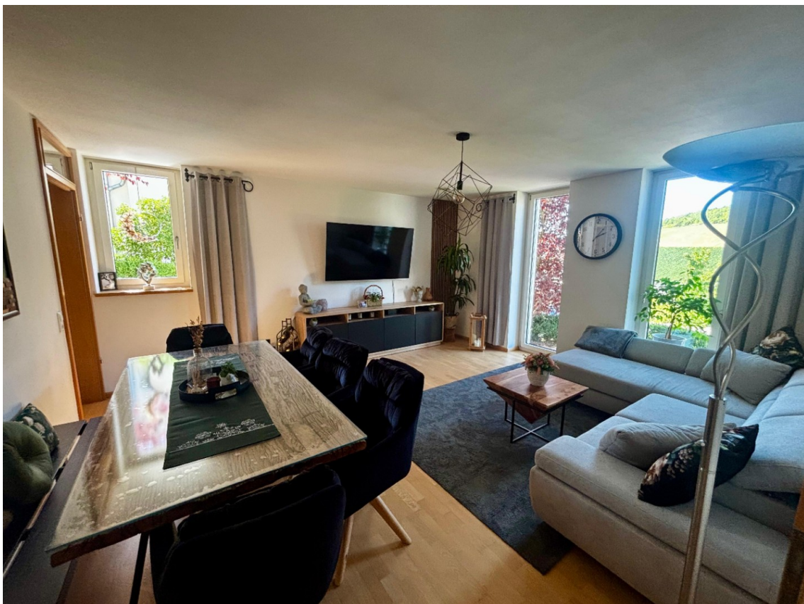
Wohn- / Eßzimmer