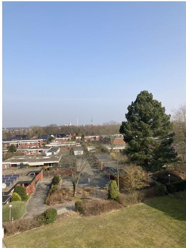
Blick über Uelzen